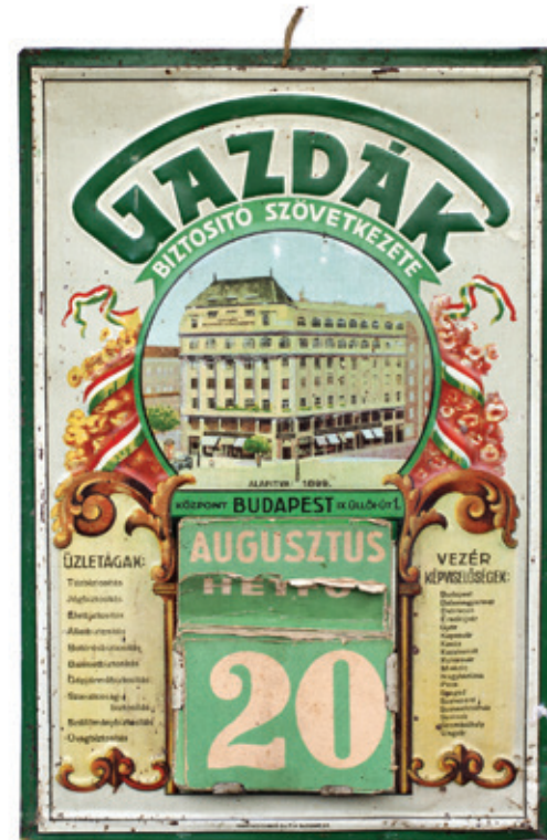
Gazdanaptár az 1940–44 közötti időszakból