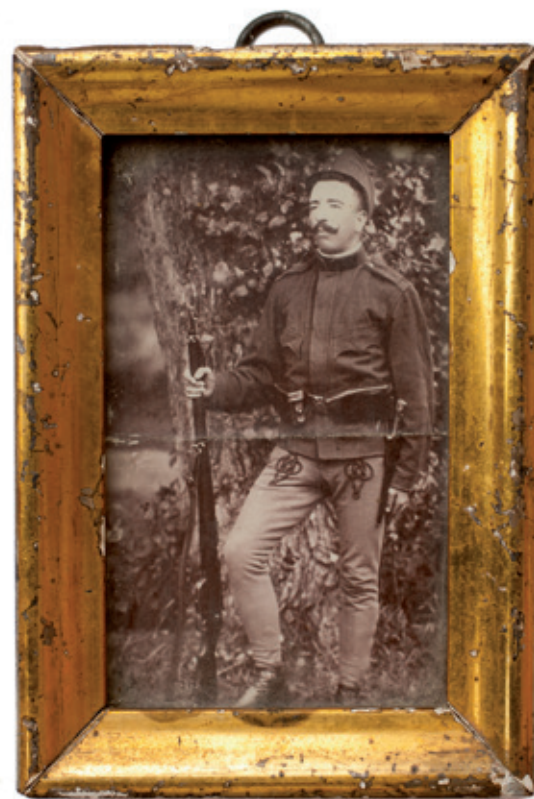
Székelly baka fényképe

Család- és helytörténeti szempontból is értékesek azok a 20. század első és középső periódusából származó fényképek, melyek családi eseményeket, ünnepi rituálékat és munkaalkalmakat mutatnak be.