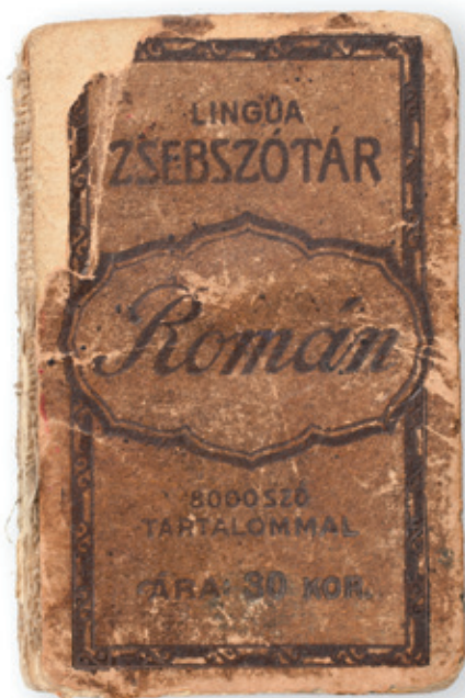
Román–magyar zsebszótár a 20. század elejéről