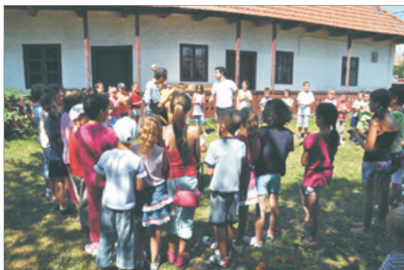
Táncitanítás, II. Zabolai Népzene- és Néptánc tábor

tóként kapcsolódtak be a szakgyakorlat munkálataiba; előadásaik pedig olyan aktuális kutatásokról szóltak, melyeknek későbbi eredményeit a zabolai közös beszélgetések is meghatározták.