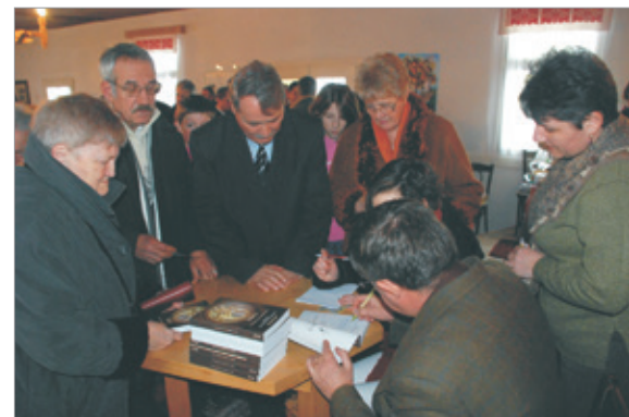
A Páva-kötet dedikálása