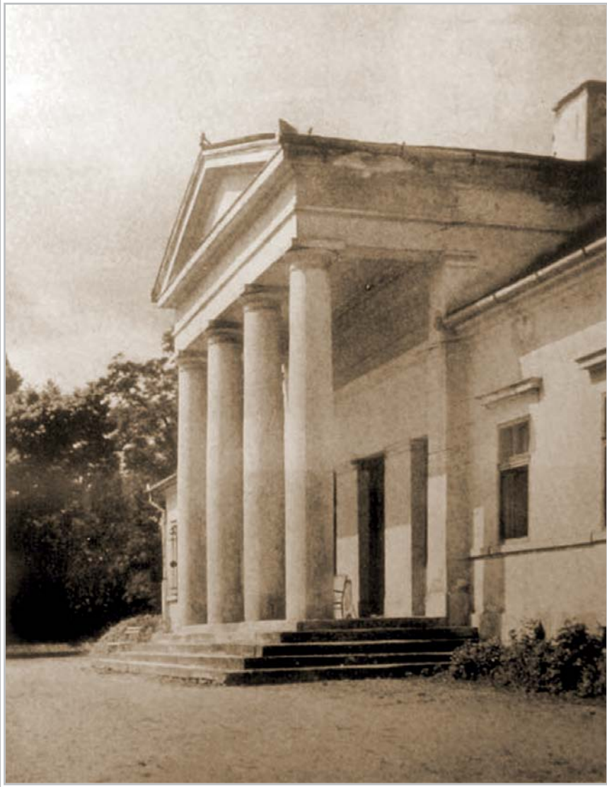
A szászfenesi gróf Mikes kastély

miből kellett megteremtenie a magyar honvédelmet. Mivel a kincstár üres volt, így a minisztérium adakozásra szólította fel az ország és a vele egyesült Erdélyi Nagyfejedelemség lakóit. A Kolozsvári Híradó felszólításai nyomán megindult adakozási hullámot a kortárs és neves történetíró, Jakab Elek így jellemezte: „A