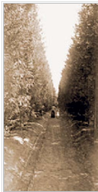
A kriptához vezető sétány a zabolai gróf Mikes-kastélyban