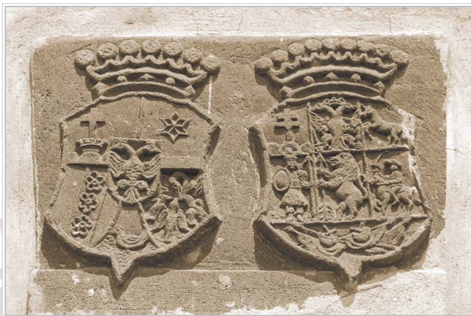
A br. Bornemissza és gr. Mikes család címere az abafájai római-katolikus templom falán