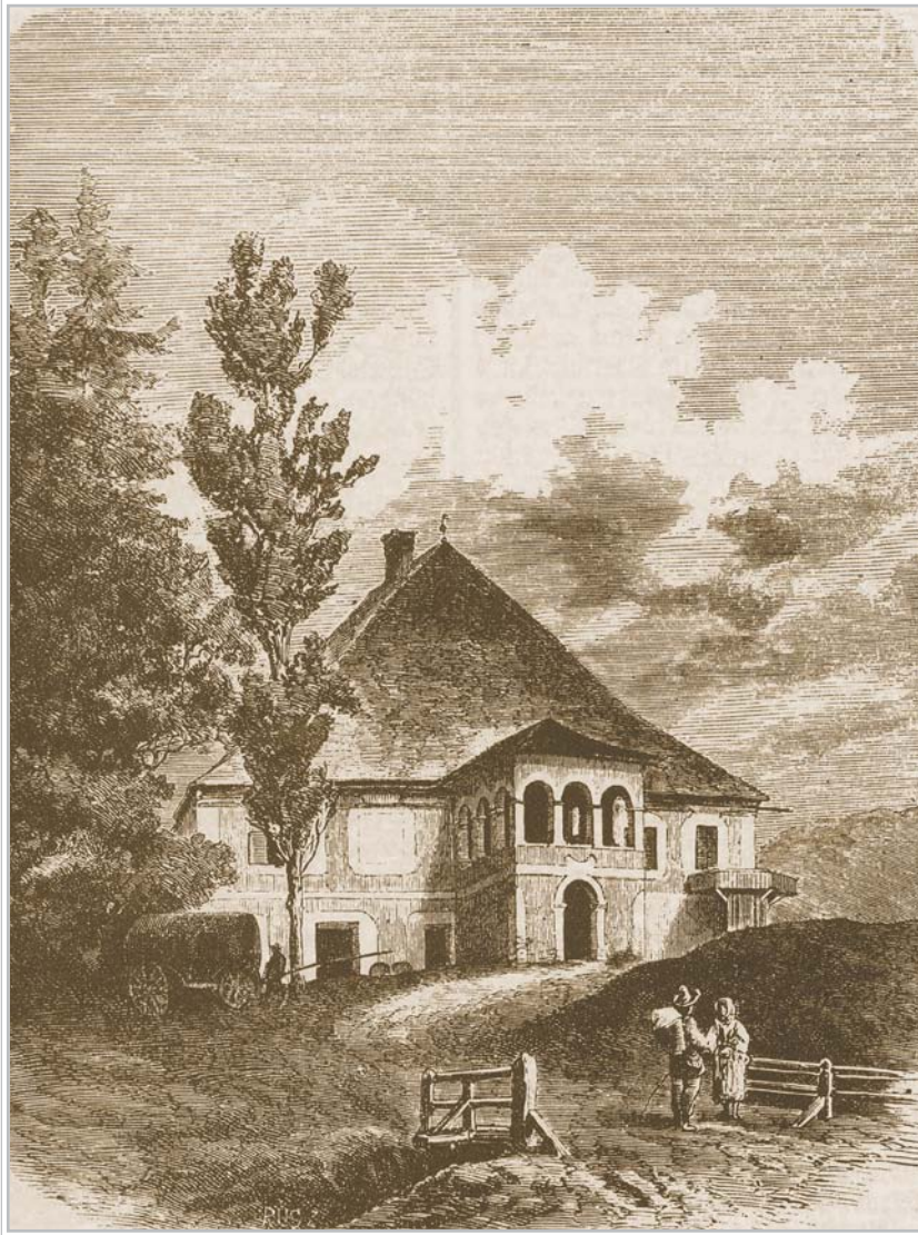
A zabolai Mikes család grófi kastélya az 1860-as években