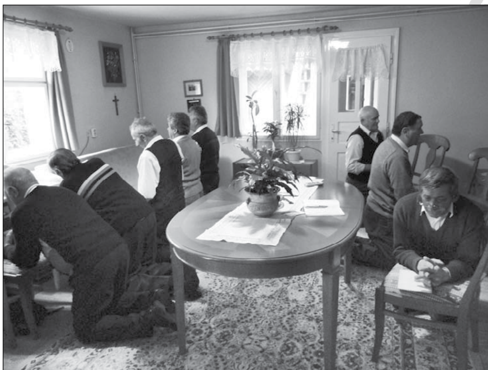
6. Zetelaki férfi Élő Rózsafüzér Társulat sorsolással történő hónap első vasárnapi titokseréje (2011)