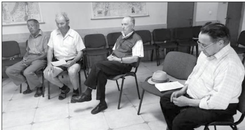
5. Szombatfai férfi Élő Rózsafüzér Társulat sorsolással történő hónap első pénteki titokseréje (2011)