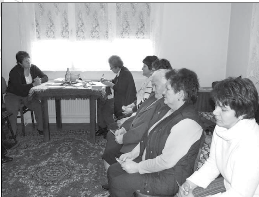
4. Zetelaki női Élő Rózsafüzér Társulat sorsolással történő hónap első vasárnapi titokcseréje (2011)