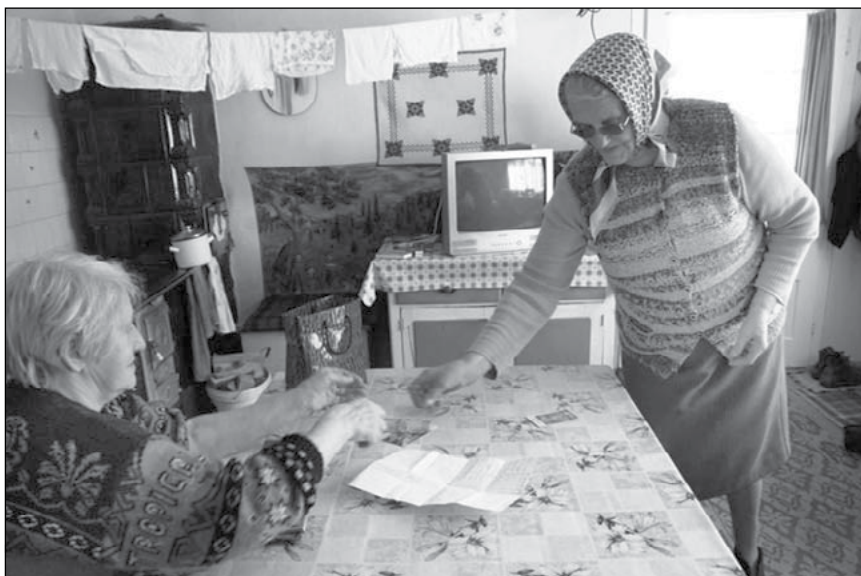
3. Szovátaai női Élő Rózsafüzér Társulat egyénileg történő titokcseréje (2010)