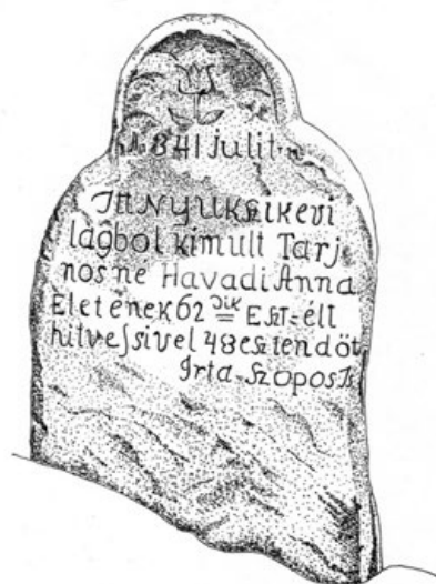
3c. Tar Jánosné 1841-es datálású sírköve a kőfaragó aláírásával – Irta Szopos Is (SzJ, 2014)