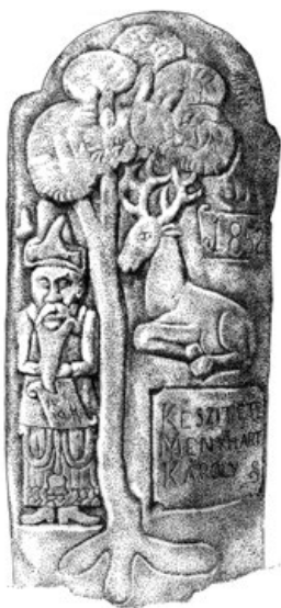
4c. Taar Mihály sírkövének a hátoldalára faragott titokzatos dombormű (PL, 1980)