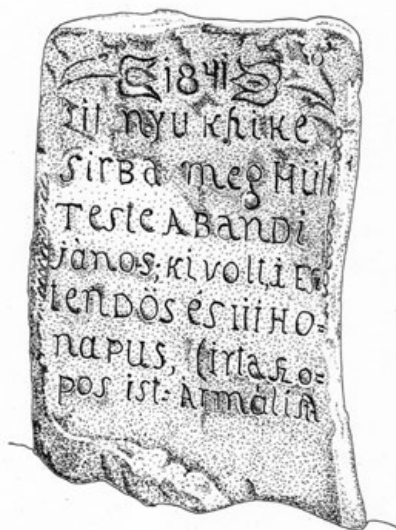
3d. Kisgyermek számára 1841-ben készített sírkő – Irta Szopos Ist : armálista (SzJ, 2014)