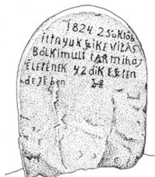
4d. A Taar Mihály temetésére készített eredeti, 1824-es írott követ föld alatti ékként használták az 1852-es reprezentatív síremlék rögzítéséhez – utóbbin, 28 év távlatából, tévesen 1 évvel későbbre keltezték Taar Mihály halálát (Szj, 2014)