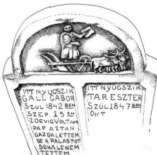
2c. Gaál Gábor és felesége sírköve (PL, 1980)