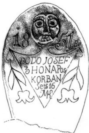
5c. A halált stilizált koponyával ábrázoló sírkő (PL, 1980). A síremléknek az utóbbi évtizedekben nyoma veszett