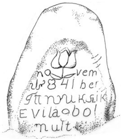
3a. Ismeretlen elhunyt sírköve – ismeretlen kőfaragó munkája, 1841 (PL, 1980)