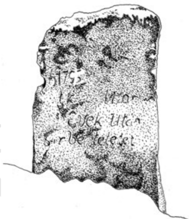
5a. A temető rehabilitációja során előkerült 1795-ös (esetleg 1793-as) datálású sírkő (Szj, 2014)