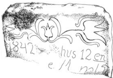
1a. Elsüllyedt sírkő (Péterfy László rajza – PL, 1980)