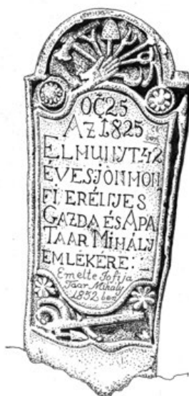
4b. Az erényes gazda státust a kézben tartott hét gazdasági eszköz mellett a sírjel alsó részén egy nagyméretű eke is hangsúlyozza (Szj, 2014)