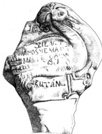
5d. Őrdarut ábrázoló figurális síremlék (PL, 1980). A síremléknek az utóbbi évtizedekben nyoma veszett