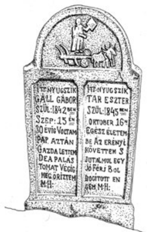
2d. Gaál Gábor és felesége sírköve. Az elhalálózás 20. századi évszámái végül a melléje emelt modern obeliszkre kerültek (SzJ, 2014)