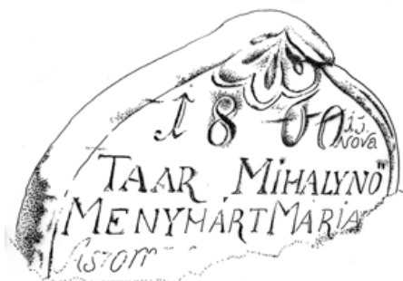
1c. Taar Mihálnő elsüllyedt 1860-as sírköve (PL, 1980)