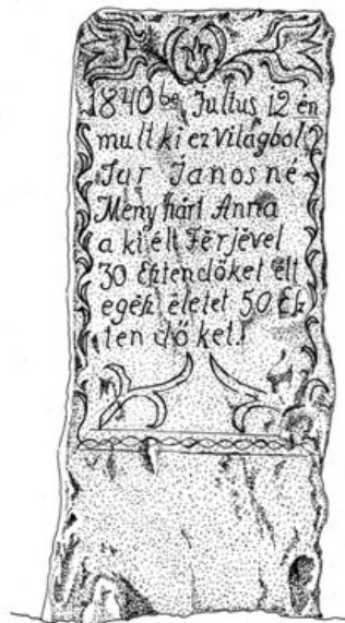
1b. Újraállított sírkő (Szeles József rajza – SzJ, 2014)