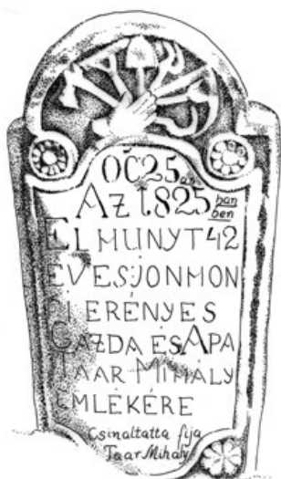
4a. Taar Mihály jon honfi síremléke – hátoldalán lévő felirata: 1852 – Készítette Menyhart Károly (PL, 1980)