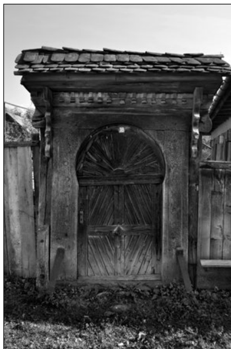
8. Patkóíves kapu 1931-ből Márkodon (18. sz.)