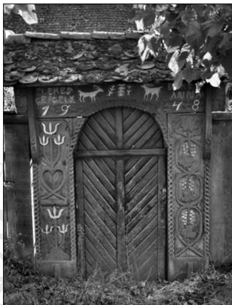
12. Kajcsa Jakab által 1948-ban faragott kapu Nyárádköszvényesen (74. sz.)