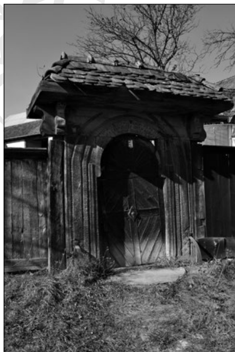
7. Kapu 1929-ből Márkodon (117. sz.)