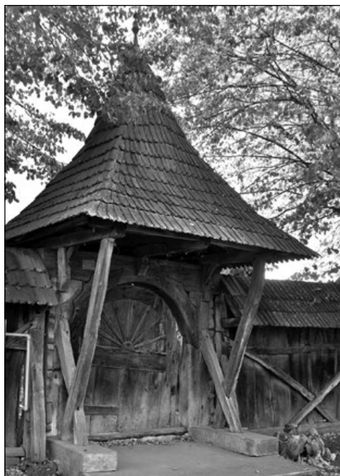
2. A nyárádszentlászlói unitárius templom cinteremkapuja