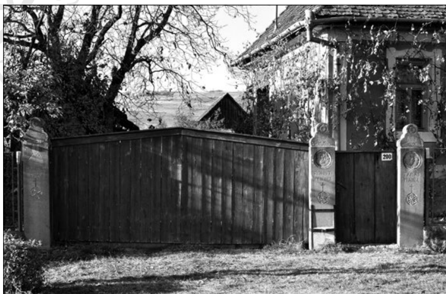
14. Faragott kőoszlopos kiskapu 1941-ből Nyárádköszvényesen (200. sz.)