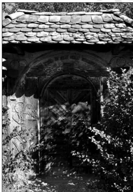
5. Oroszlános kapu 1893-ból Nyárádszentlászlón