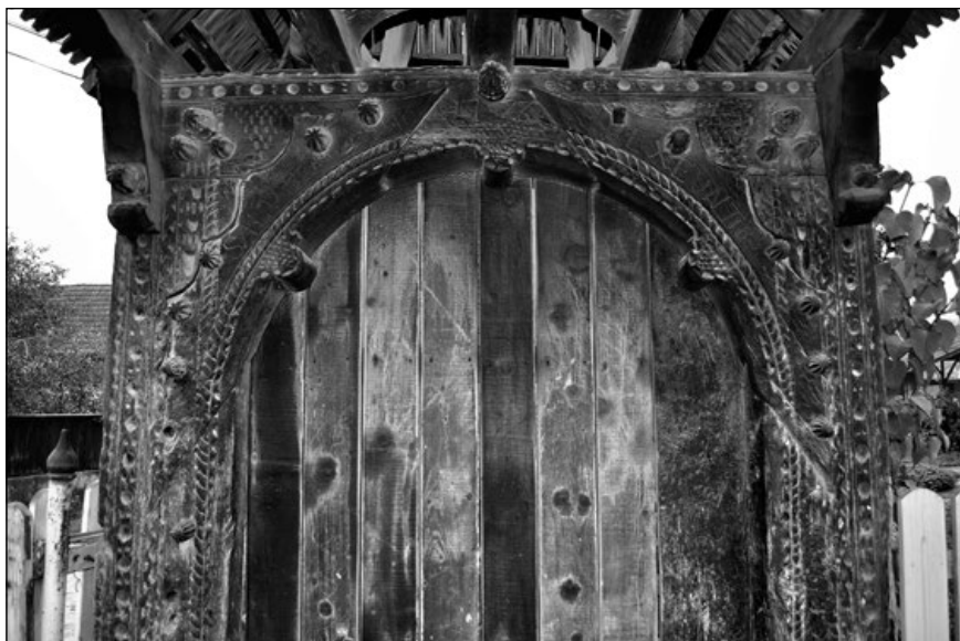
19. A nyáradandrásfalvi református cinterem régi kapuja 1723-ból