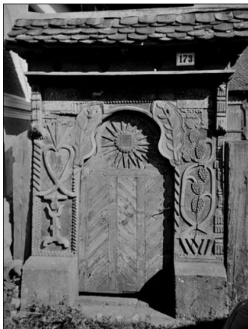
10. Kajcsa Jakab saját maga számára 1925-ben faragott egykori kapuja Nyárádköszvényesen (173. sz.)