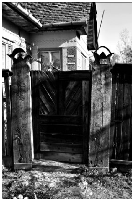
3. Tulipán formájú kapuoszlop Májában (27. sz.)