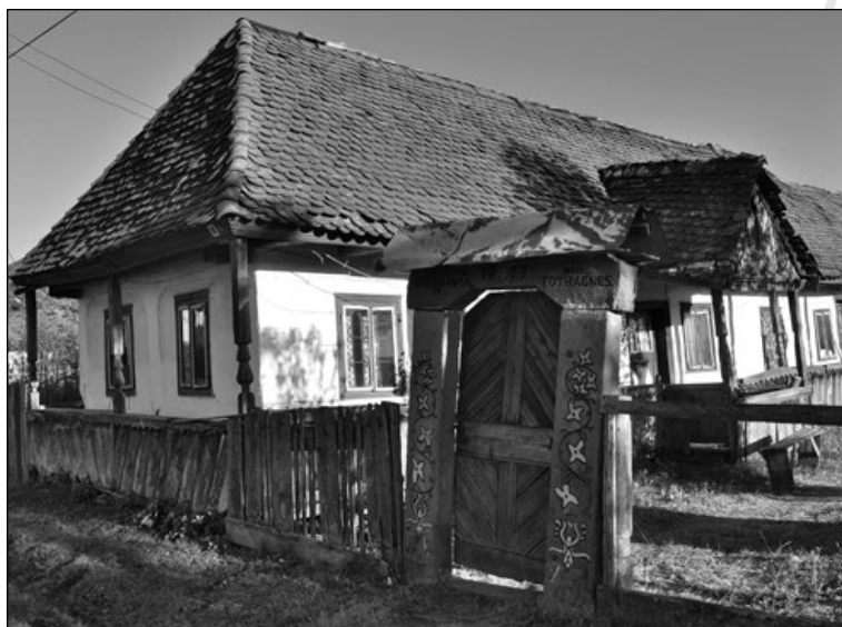
16. Kőoszlopos kiskapu Székelyhodoson 1923-ból (10. sz.)