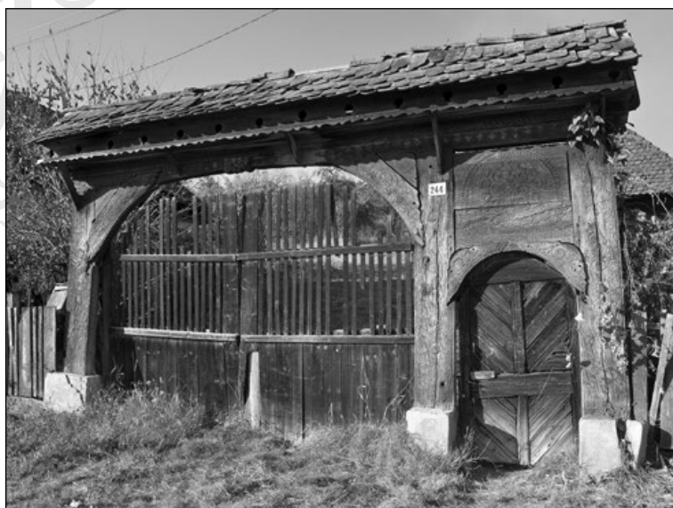
1. 1855-ben állított székelykapu Nyárádköszvényesen (244. sz.)