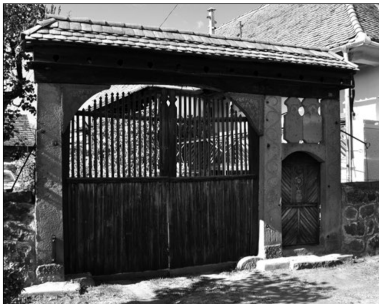
15. Faragott kőoszlopos kötött kapu 1903-ból Nyárádköszvényesen (265. sz.)