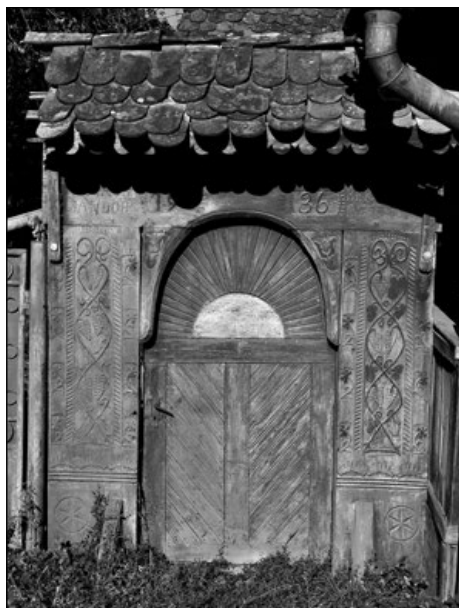
13. Szőlőindás kapu 1936-ból Jobbágytelkén (16. sz.)