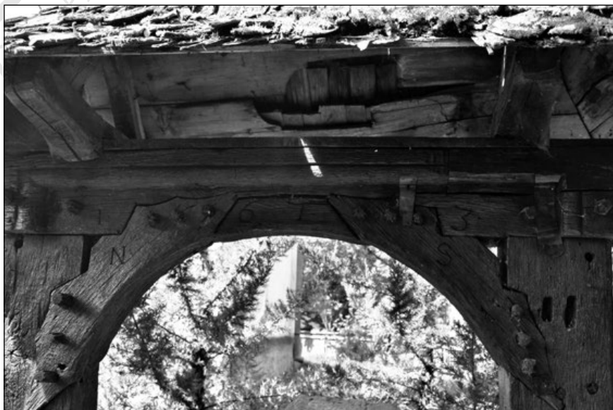
18. A nyárádszentmártoni unitárius cinterem régi kapuja 1673-ból