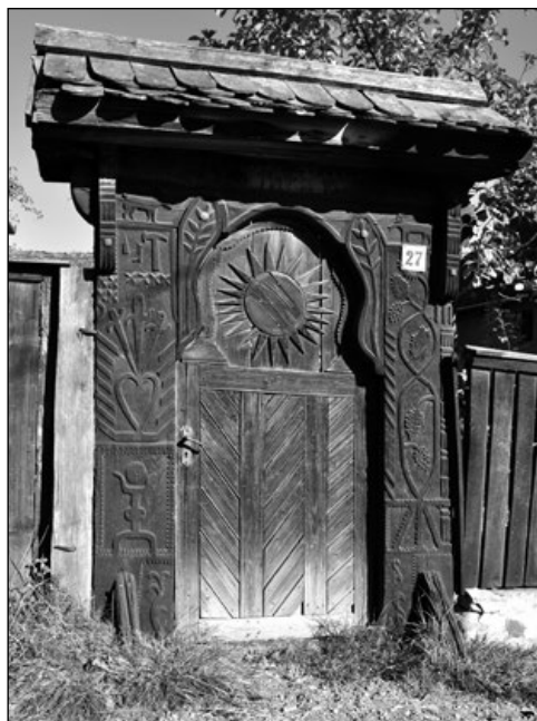
9. Kajcsa Jakab által 1925-ben faragott mesterjegyes kapu Nyárádköszvényesen (27. sz.)