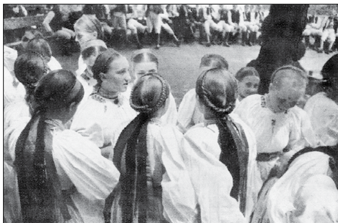
7. A szászfehéregyházi Kronenfest a két világháború között