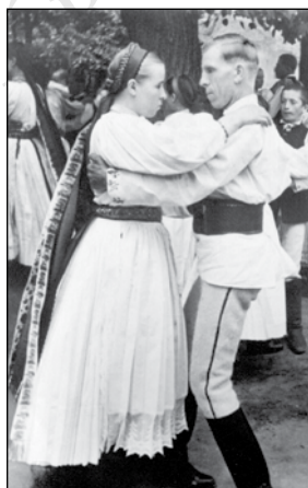
6. Táncoló pár a szászfehéregyházi Kronenfesten, a két világháború között