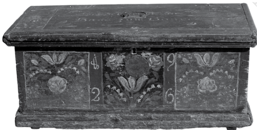
2. Szomszédságláda 1926-ból (2005)