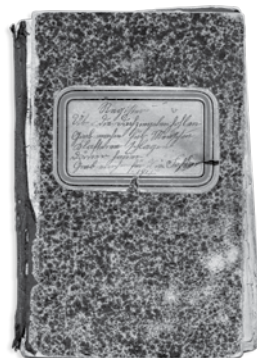
3–5. A szászfehéregyházi szomszédságok archívumából, jelvény 1879-ből, jegyzőkönyvek bejegyzései (1764, 1915) (2005)