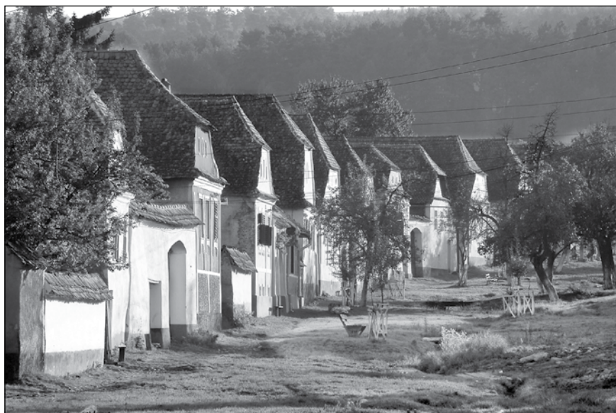
1. Házsor a Fő utcán. A szászfehéregyházi „Gässchen” szomszédság (2005)