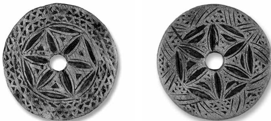
8–9. 19. századi orsók mint szerelmi ajándékok, melyeket a legények ajándékoztak a lányoknak „Fosnicht” alkalmával (2005)