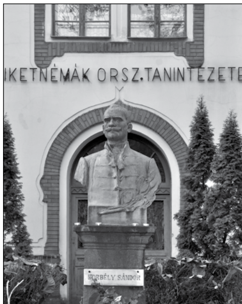
3. Borbély Sándor mellszobra a váci siketnéma-intézet kertjében