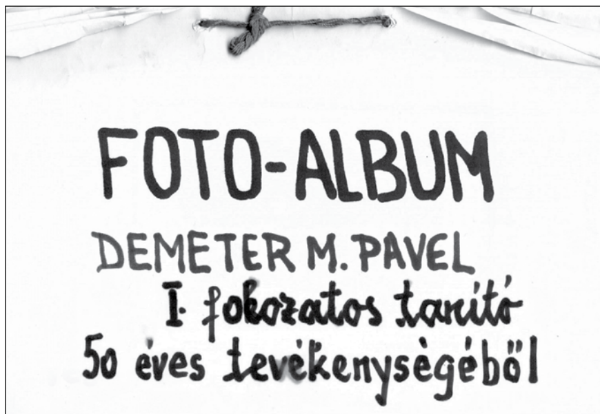
3–10. Szemelvények Demeter Pál fotóalbumából