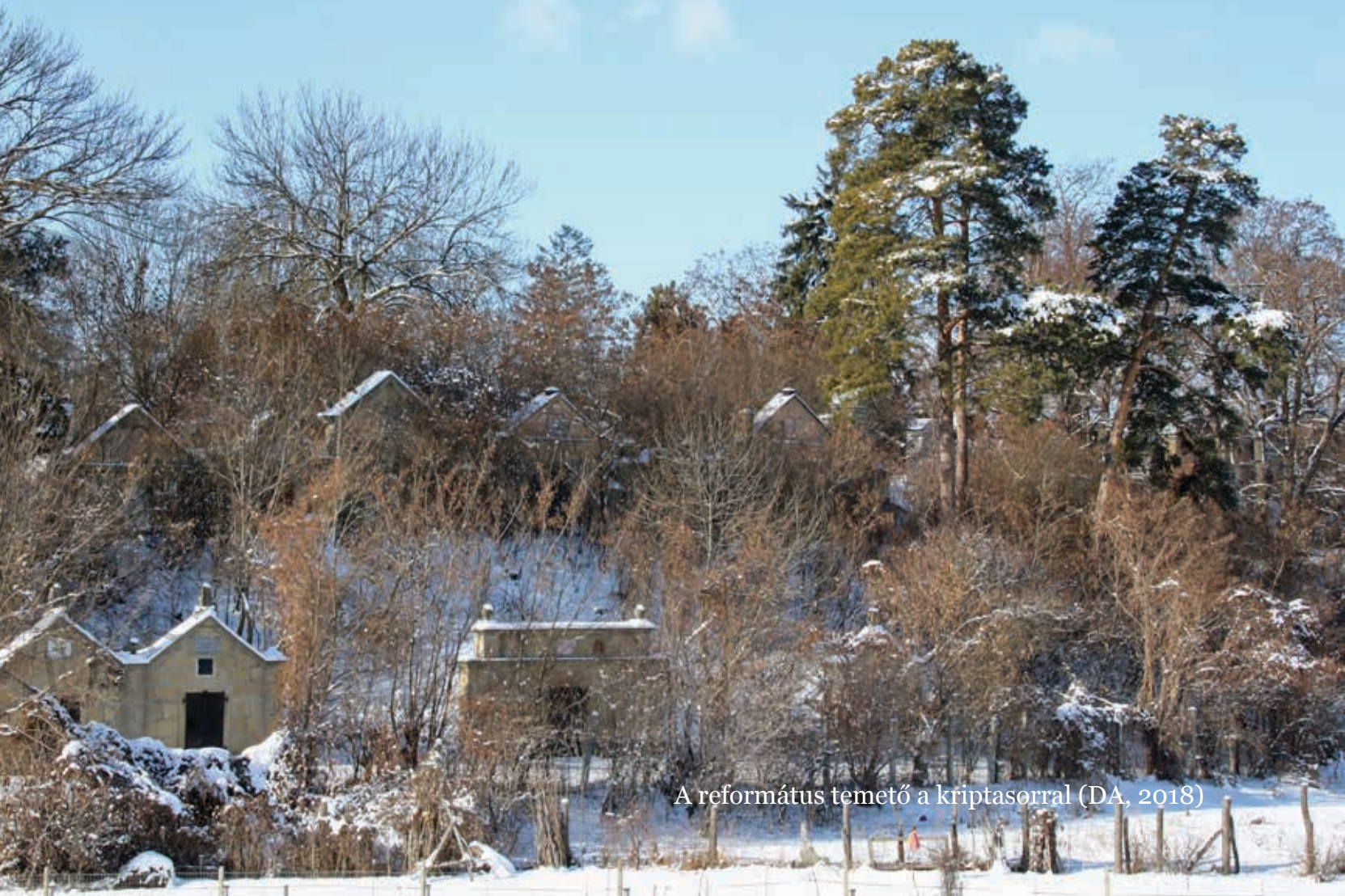
A református temető a kriptasorral (DA, 2018)