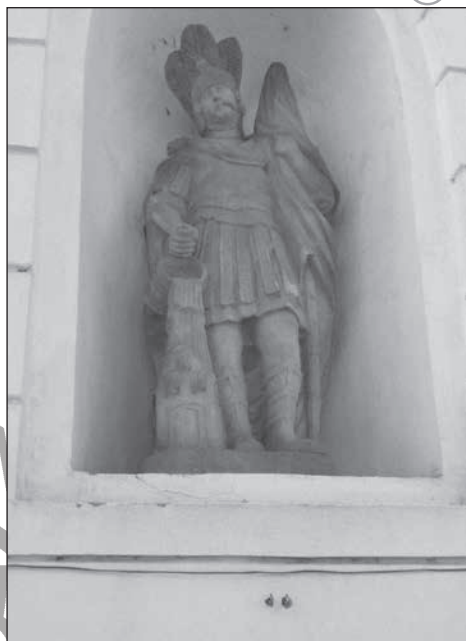
7. Veszprém, Flórián szobor, 1788.