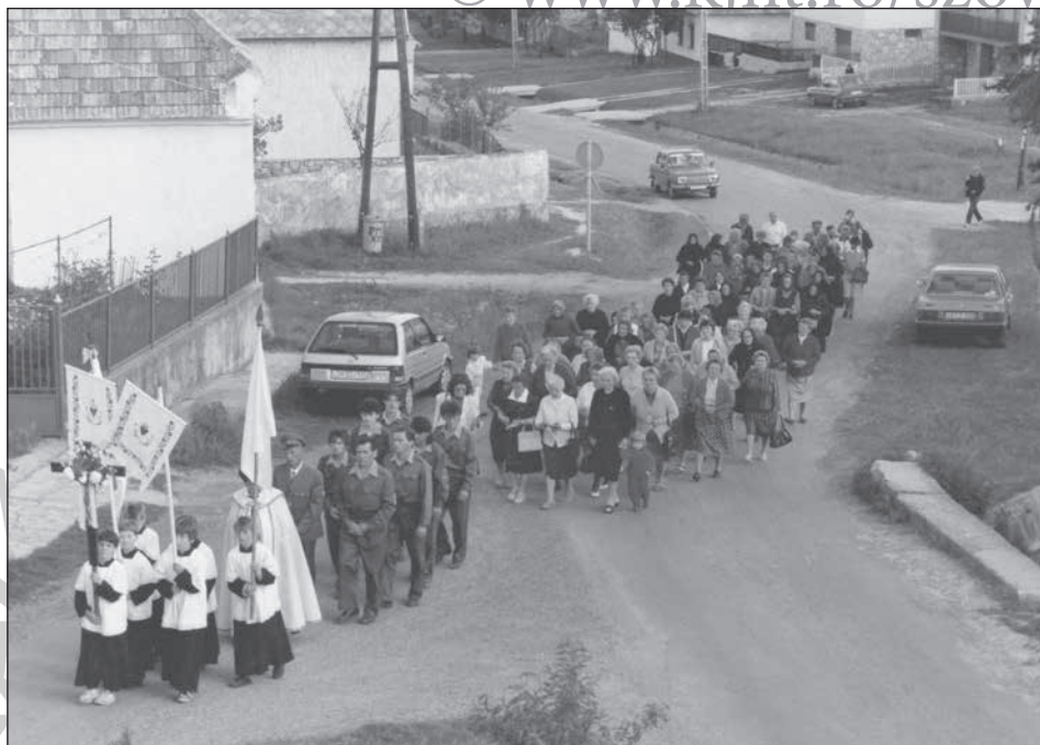
18. Magyarpolány, Flórián ünnepe, 1993.