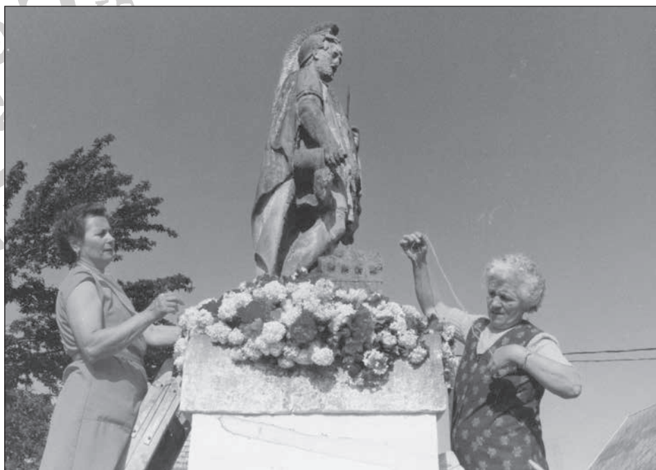
15–16 Magyarpolány, Flórián ünnep, 1993.