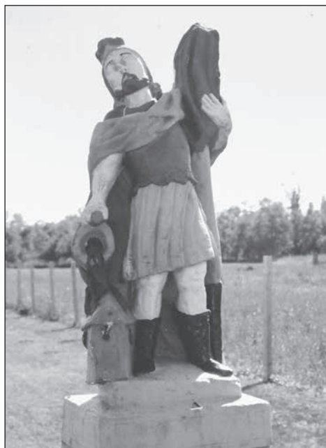
5. Zalaszegvár, Flórián szobor, 19. sz.