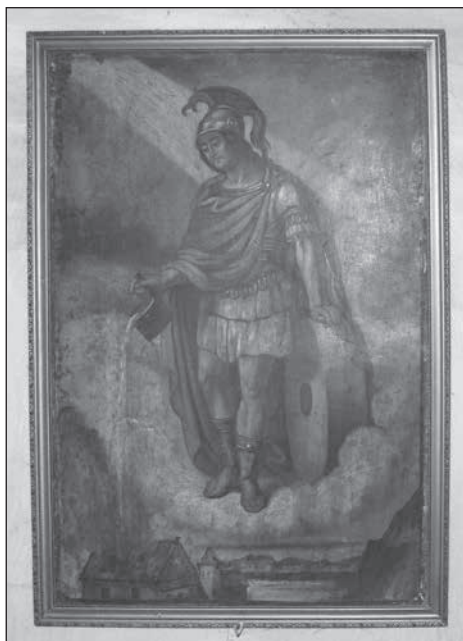
12. Nyirád, Flórián kápolna oltárképe, 1857.