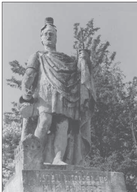
2. Magyarpolány, Flórián szobor, 1874.