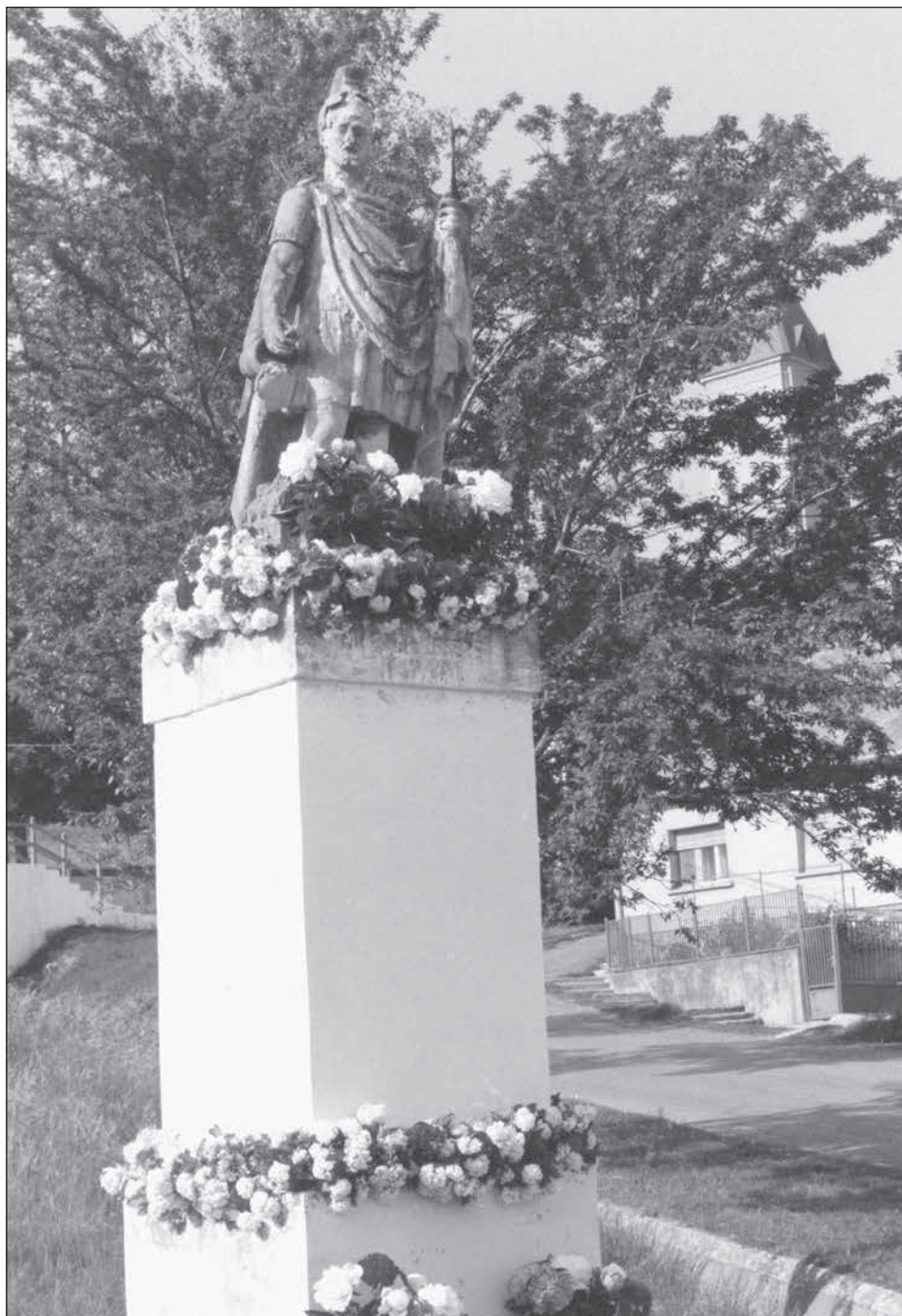
17. Magyarpolány, Flórián ünnep, 1993.