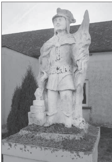
4. Köveskál, Flórián szobor, 2006.