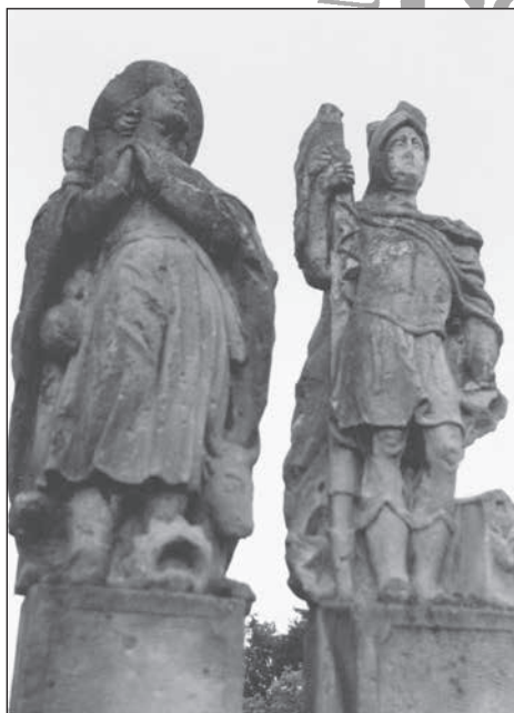
6. Zalaerdőd, Flórián és Vendel szobra, 19. sz.