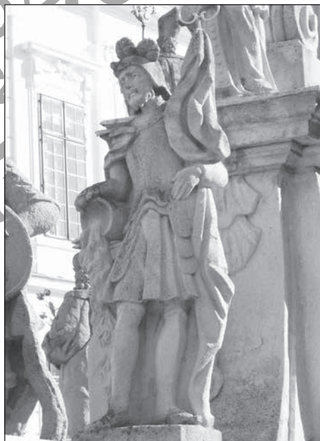
9. Veszprém, Szentháromság oszlop Flóriánnal, 18. sz.