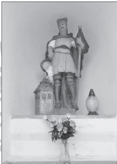
1. Barnag, Flórián szobor, 1803.

A fényképeket dr. Sonnevend Imre erdőmérnöknek (1–12. és 14.) és Nagyvári Ildikó könyvtárosnak (13. és 15–18.) köszönöm!