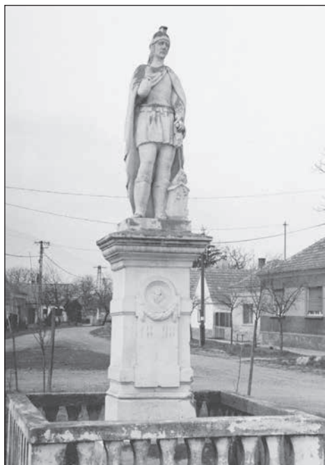
3. Somlójenő, Flórián szobor, 1904.