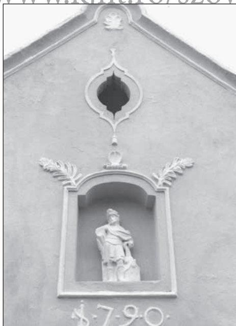
8. Devecser, Flórán szobra lakóház oromfülkéjében.