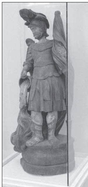
13. Veszprém LDM Flórián szobor, 18. sz.