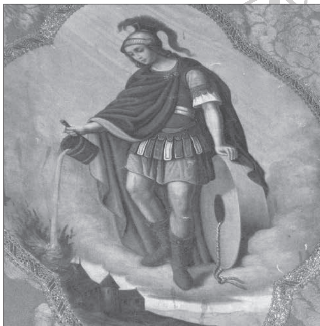
14. Örvényes, Flórián zászló, 19. sz.