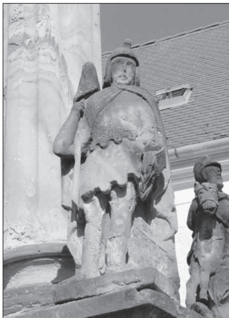
10. Diszel, Szentháromság oszlop Flóriánnal, 1890.