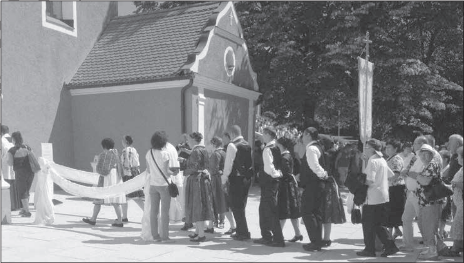
6. A gyöngyök felmarkolása a Szent Kapun való belépés előtt. Nagyboldogasszony napi búcsú, Máriagyúd. 2016. augusztus 14.