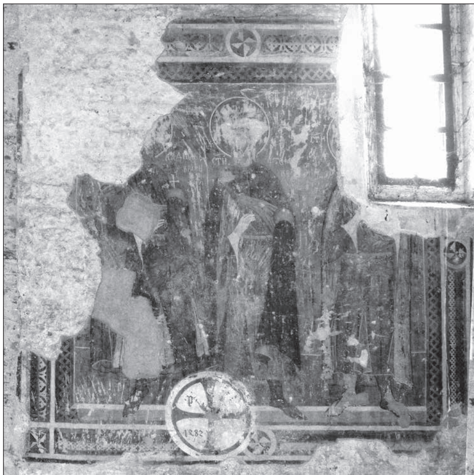
3. Kéménd