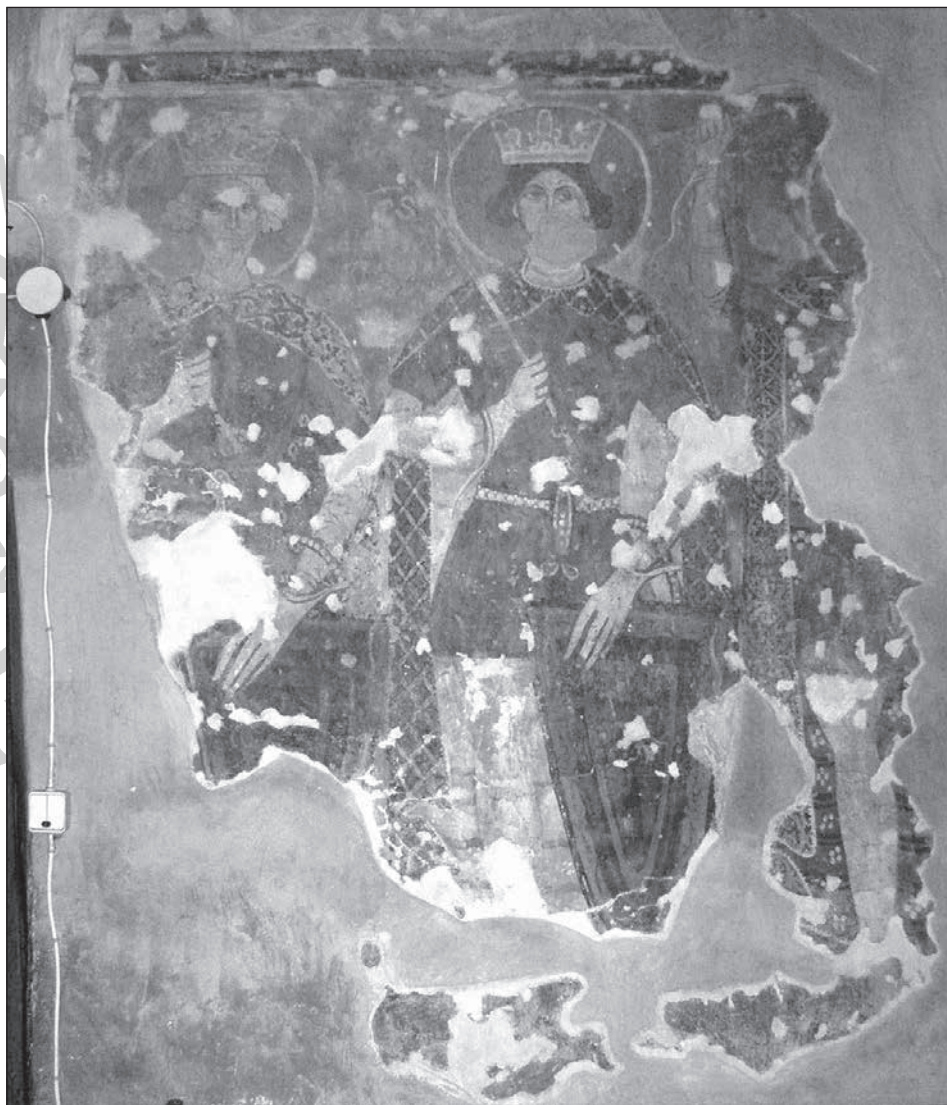
1. Kristyór

A magyar szent királyok középkori ábrázolásai egyben a férfiúi lét három jellemző életkorát is megszemélyesítették, az idős és bölcs: István, az életre készülő ifjú: Imre, László pedig az ereje teljében lévő lovag eszményi megidézője.