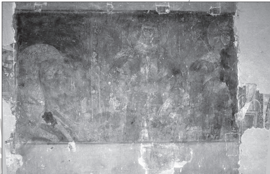
2. Ribice