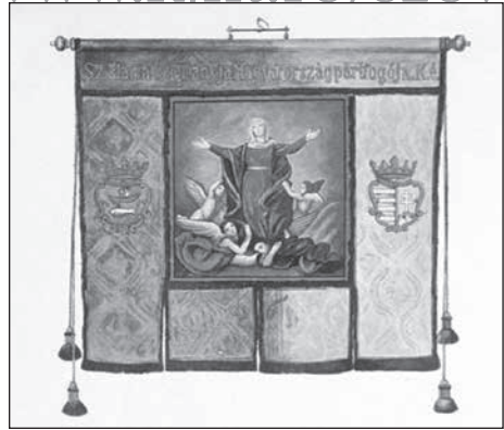
2a-b. Céhzászló (mindkét oldalán festett textil zászló)