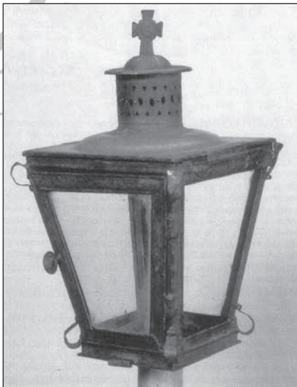
3. NM 50.17.47

A zászló jelenleg Keszthelyen a Balatoni Múzeum állandó kiállításában van kölcsön!