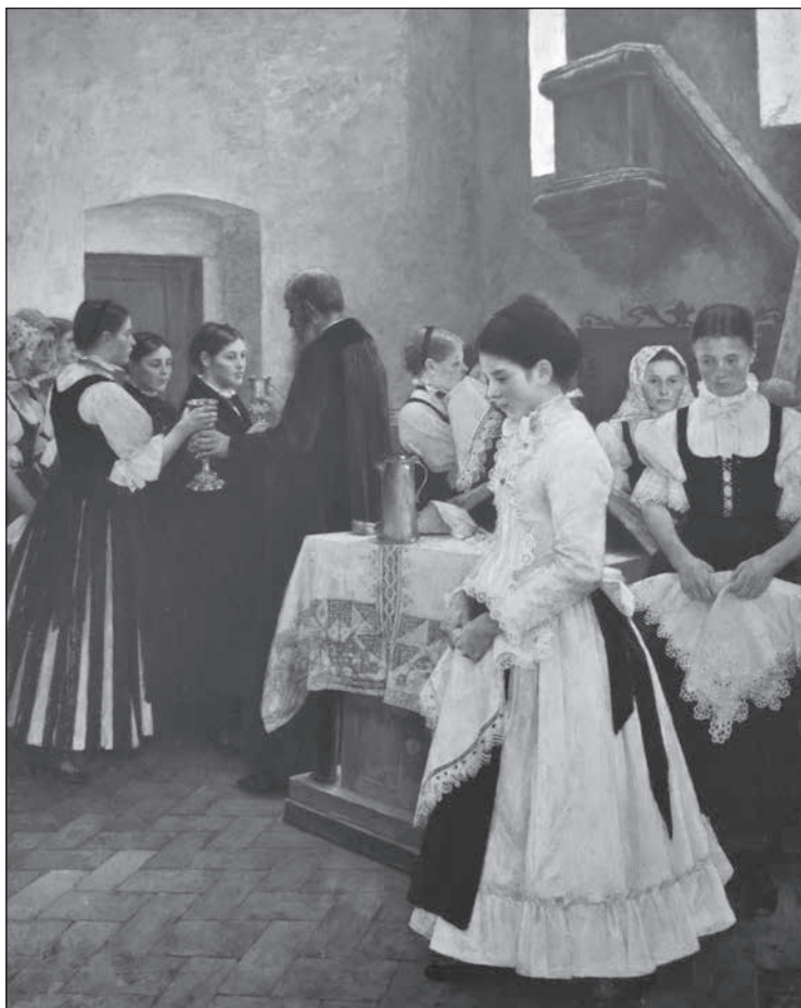
1. Csók István: Úrvacsora. Magyar Nemzeti Galéria