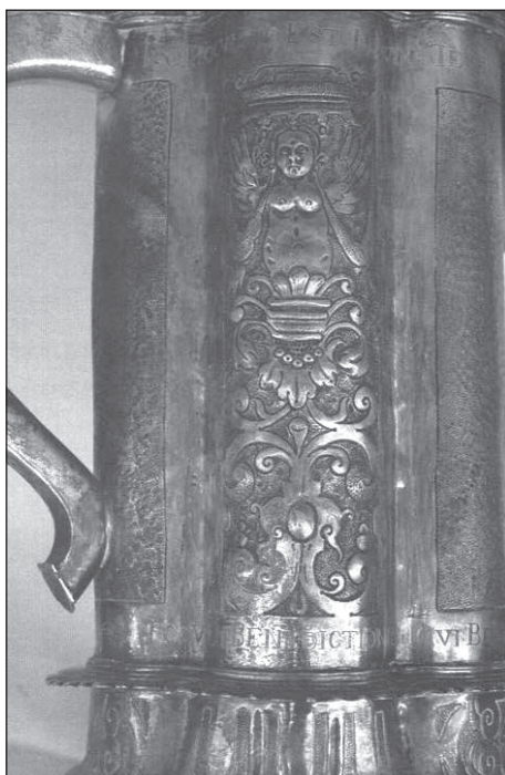
4a-b. Tolcsvai kanna, 1637