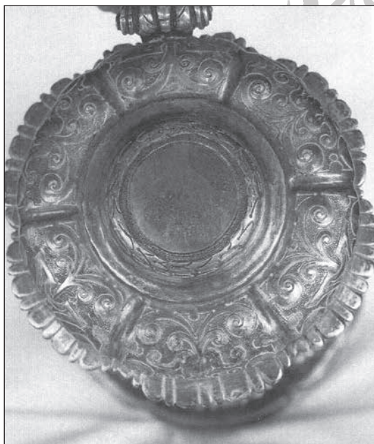
4c-f. Tolcsvai kanna, 1637