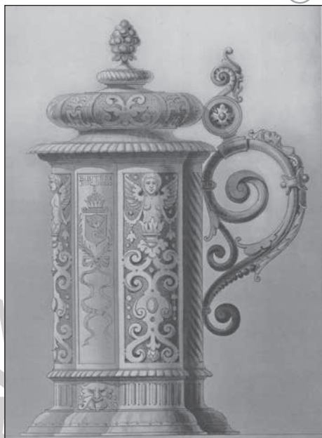
2. Ónodi kanna