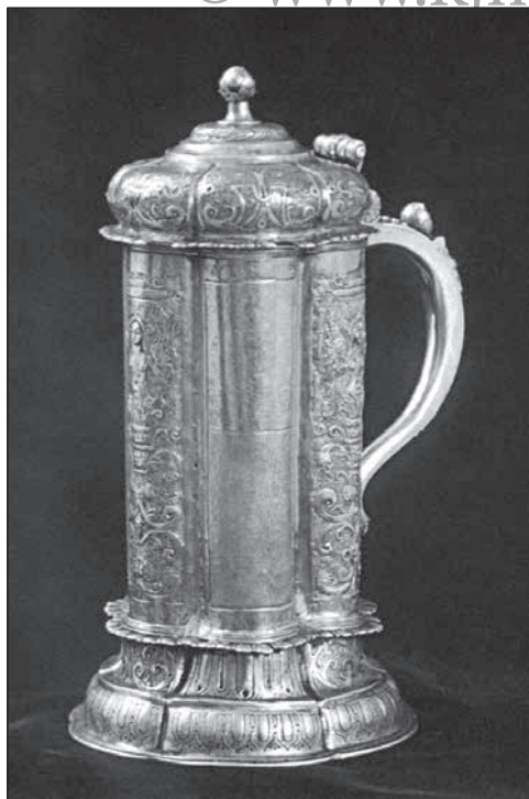
5. Sátoraljújhelyi kanna