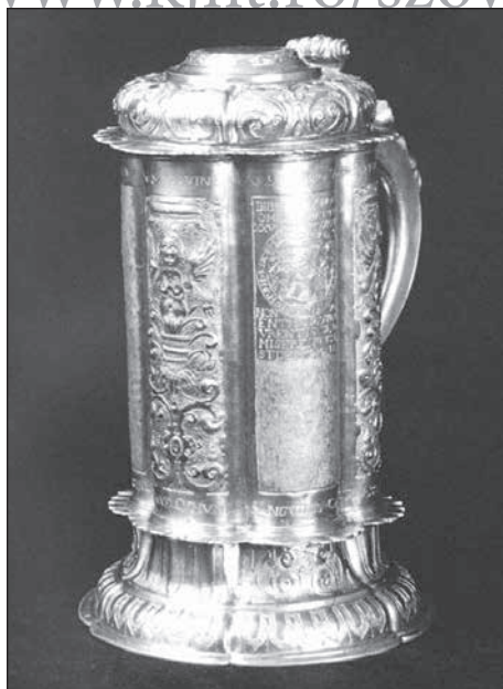
3. Mádi kanna