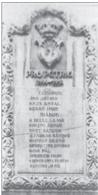
4. A Református Kollégium első világháborús hőseinek emléktáblája (1940. okt. 31.)