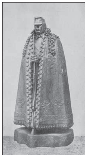
3. A Kárpátok Őre-szobor