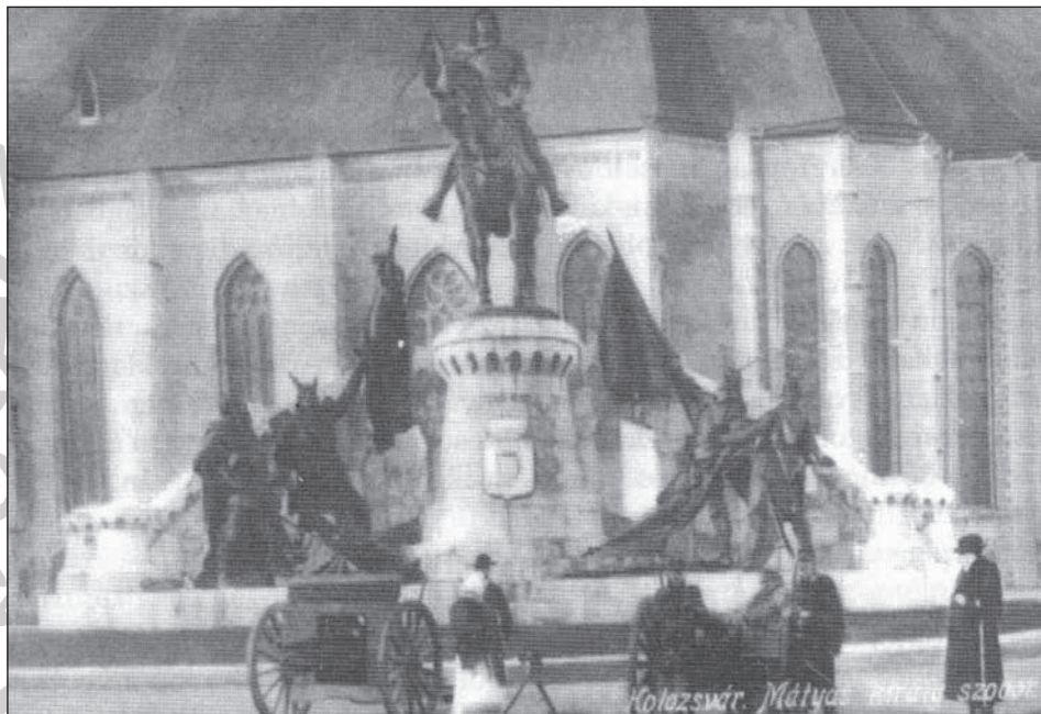
1. A Mátyás-szobor előtt közszemlére kitett hadzsákmány orosz és szerb ágyúk (1915. jan. 4.)