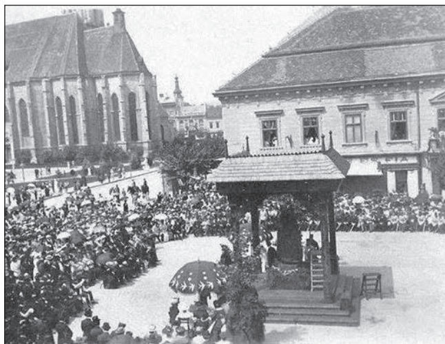
2. A Kárpátok Őre avatása (1915. aug. 18.)