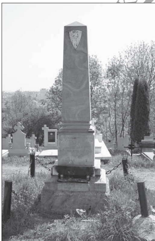
5. Első világháborús emlékmű a Kalandos temetőben (1943. jún. 27.)