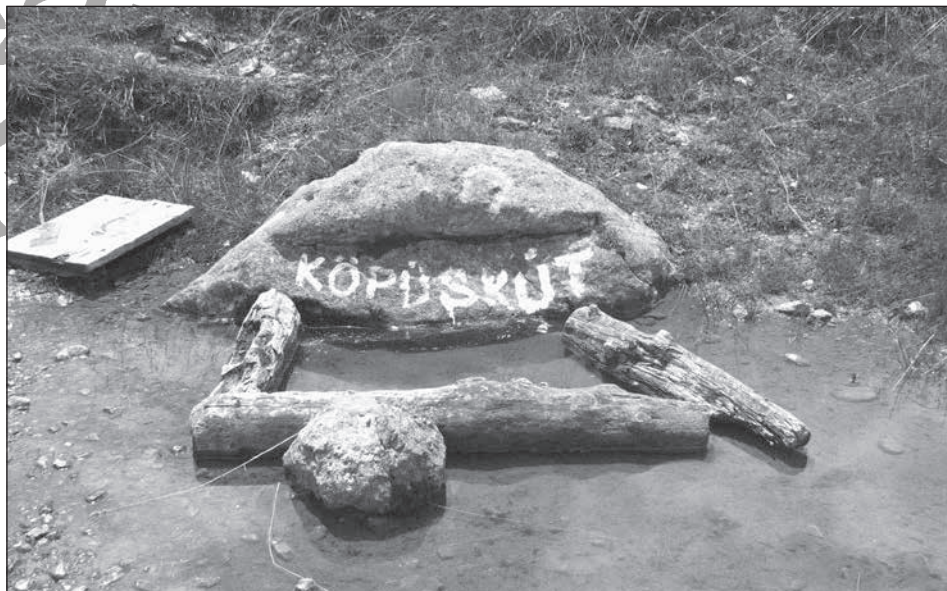
6. A Küpus-kút és Szent László lovának patkónyoma a Pogányhavas oldalában