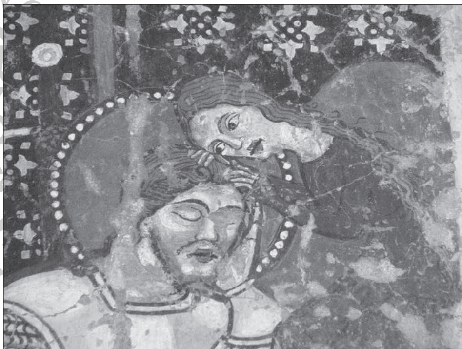
1. A pihenés jelenete a Szent László-legenda székelyderzsi falképciklusában (Magyar Zoltán fotója, 2010)