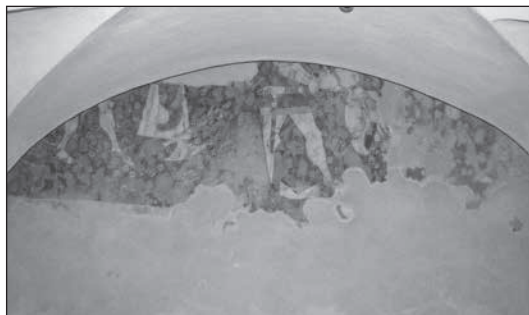
3. A birkózás és a lefejezés jelenetének fragmentumai a Szent László-legenda csíkmenasági falképciklusából (Magyar Zoltán fotója, 2017)