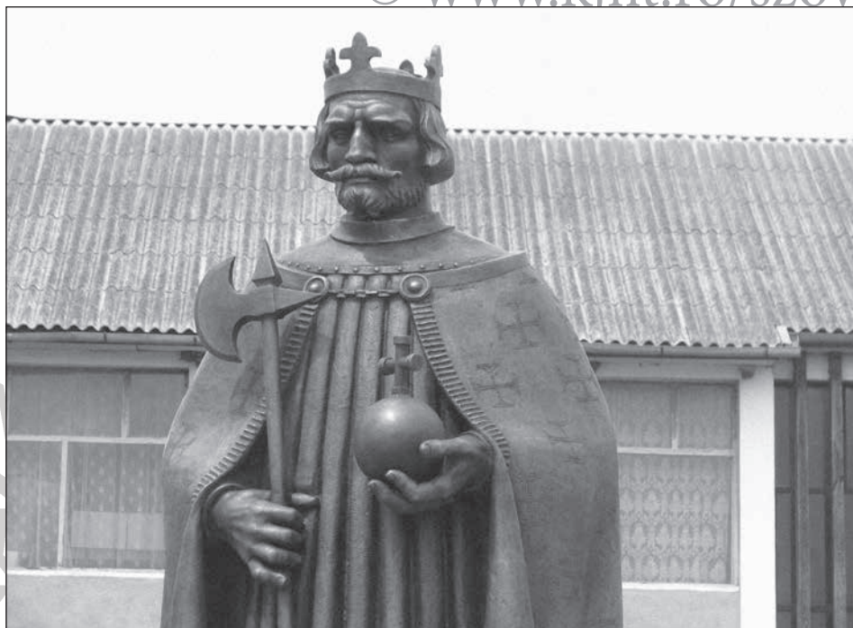
8. Szent László szobra Szépvíz központjában (Magyar Zoltán fotója, 2009)