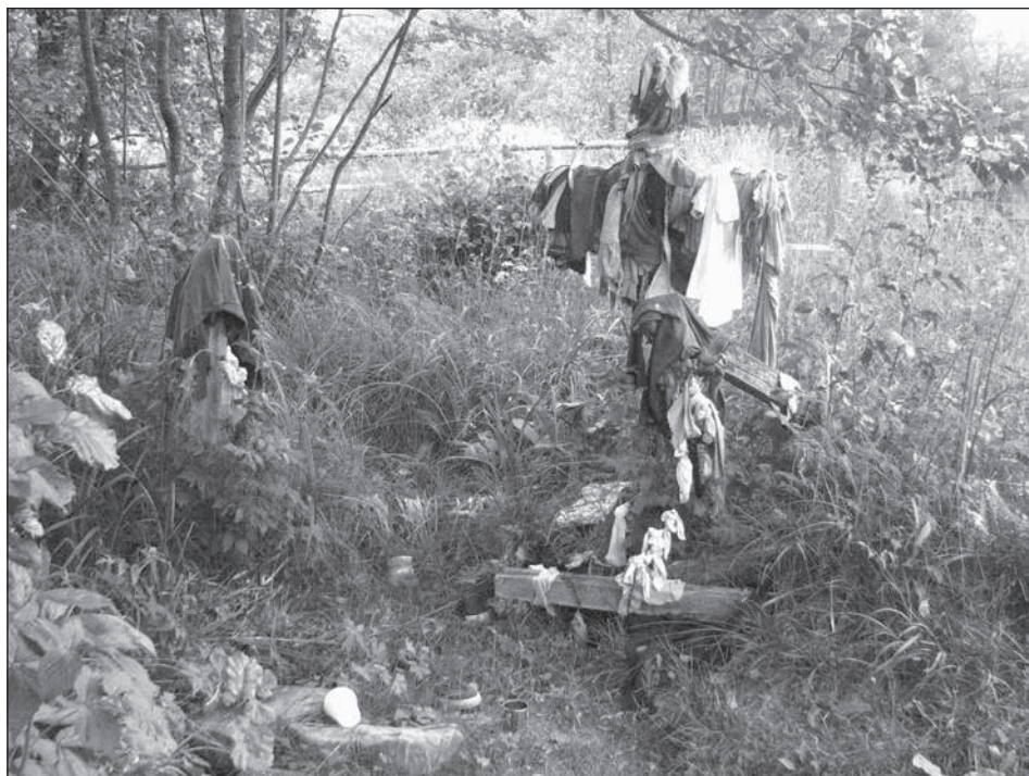
2. Fákra aggatott fogadalmi rongyok az Oroszhegy határában lévő Urusos-kútnál