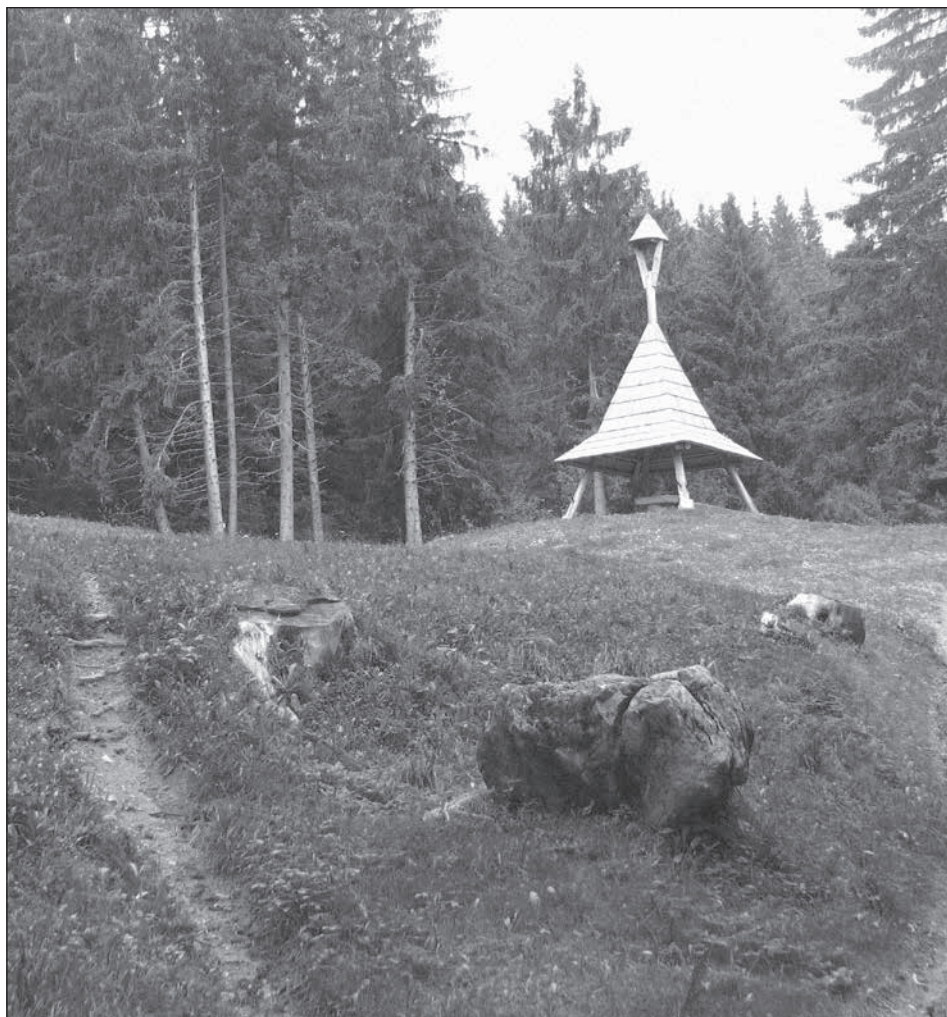
7. A Szent László köve a pogányhavasi Szent László-kápolna közelében, a régi országút mellett