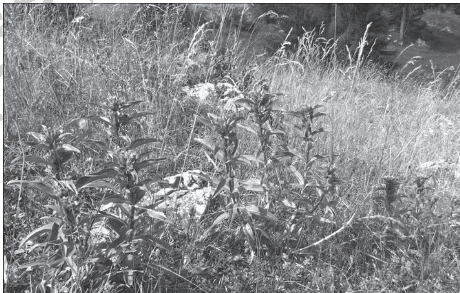
9. A Szent László-tárnics a Csíki-havasokban (Csörgő Anna Mária fotója, 2011)