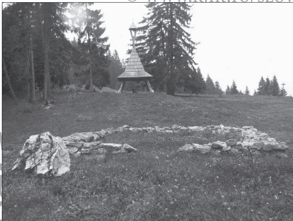
5. A Szent László-kápolna alapfalai a Kicsi-Pogányhavas tetején (Magyar Zoltán fotója, 2018)