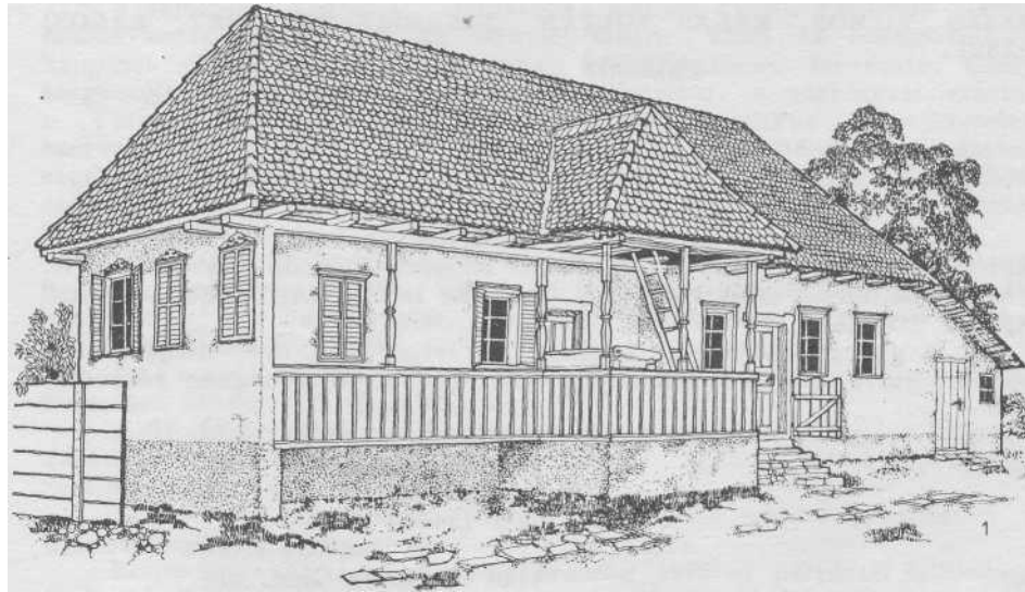
Nyárádmájai parasztház. Épült 1932-ben. Marosszék