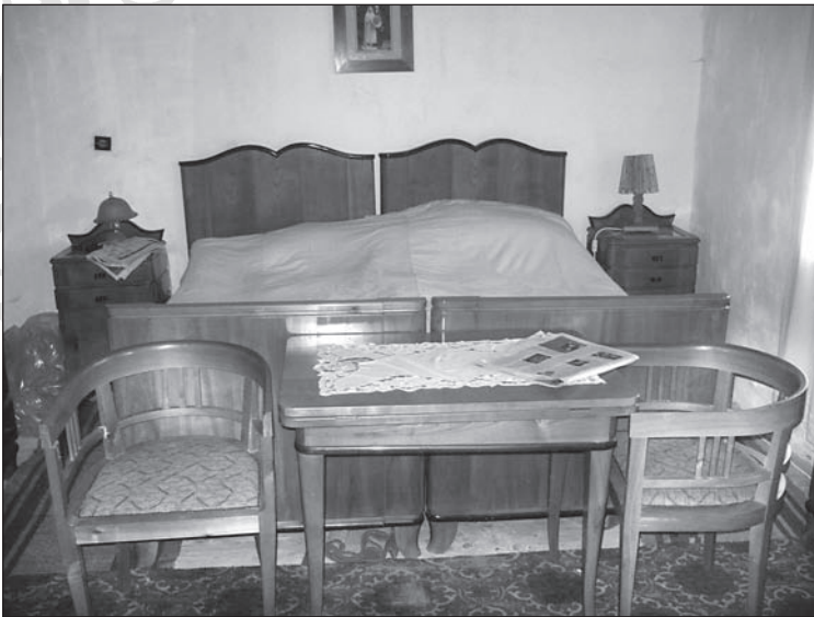
19. kép. 1930-as években készült bútorgarnitúra, a tisztaszobaként berendezett lakótérben. A ház jelenleg hétvégi házként funkcionál, de a helyiséget akkor sem használják, ha a család a településen van