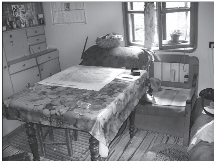
13. kép. A párhuzamos szobaberendezés analógiája. Ablak alatt kanapé a ruhák tárolására, egy 2. csoporthoz tartozó család konyhájában