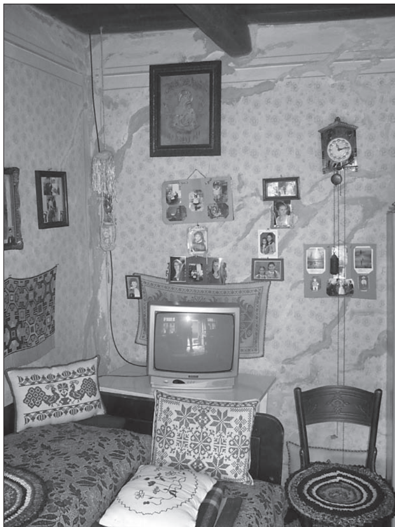
17. kép. Egy háromsztrató ház középso helyi ségében kialakított lakótérben található televízió