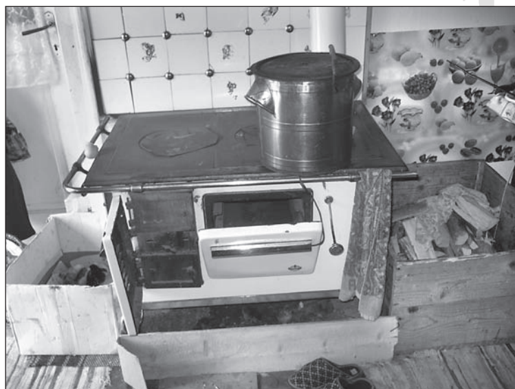
14. kép. Lemezkályha egy 2. csoporthoz tartozó család konyhájában