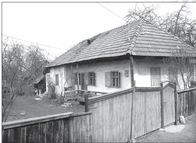
2. kép. Háromosztatú tornácos lakóház Páván