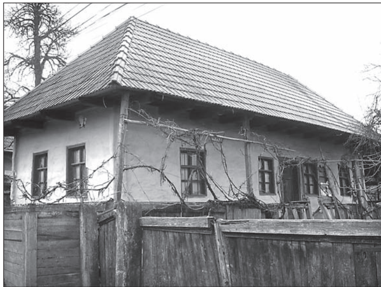
1. kép. Háromosztatú tornácos lakóház Zabolán