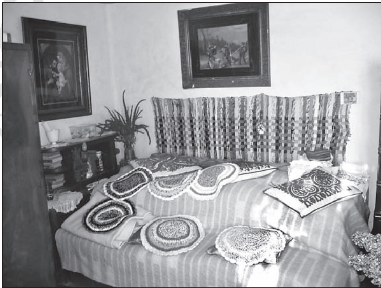
8. kép. „Vetett ágy”, a feleség által 2010-ben szőtt szőnyegekkel, hímzett párnákkal egy pávai tanító család szobájában