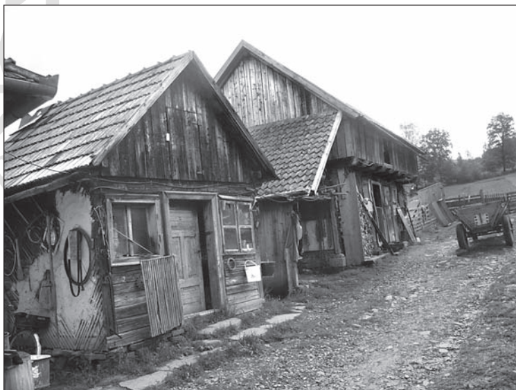
12. kép. Egy 2. csoporthoz tartozó család gazdasági épületei