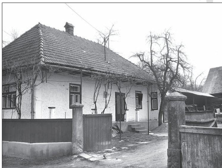
6. kép. Egy 1908–1910 körül épült háromsztatú lakóház, egy „helyi vállalkozó” család portáján