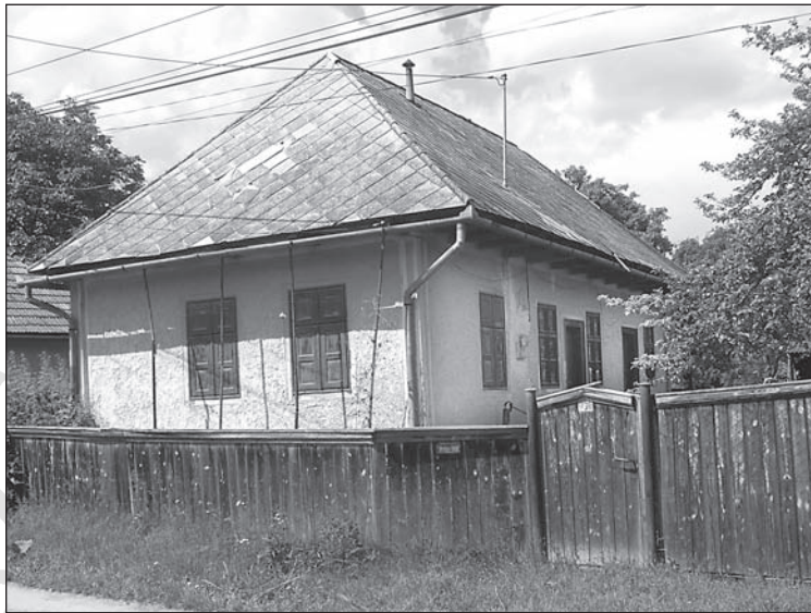
3. kép. Háromosztatú lakóház Páván