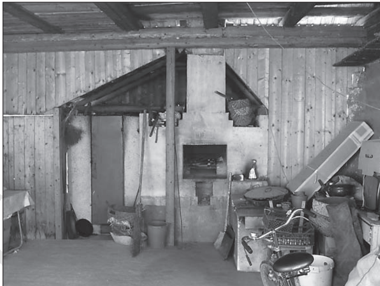
15. kép. A „helyi vállalkozó” család portáján, az 1990-es években épült kemence, pityókafőző üst és sajtűstölő