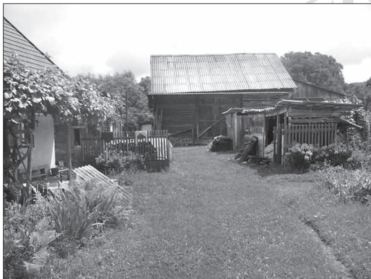
21. kép. Az „L” alaprajzú épülethez tartozó gazdasági épületek