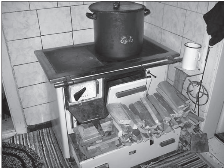
11. kép. Lemezkályha egy tanító család konyhájában