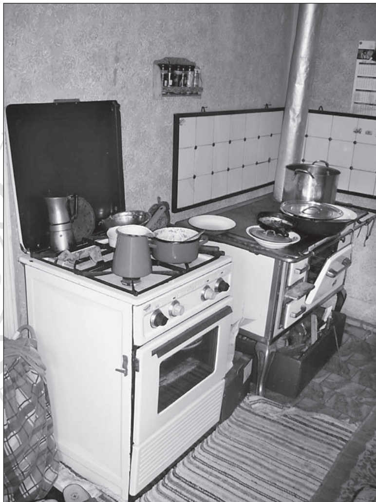
22. kép. A 2. életmodellhez tartozó lakásbelső. Egy helyiségben van jelen a lemezkályha és a gáztűzhely