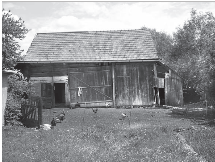
5. kép. Egy „helyi vállalkozó” csoportba sorolt család csűrpajtája