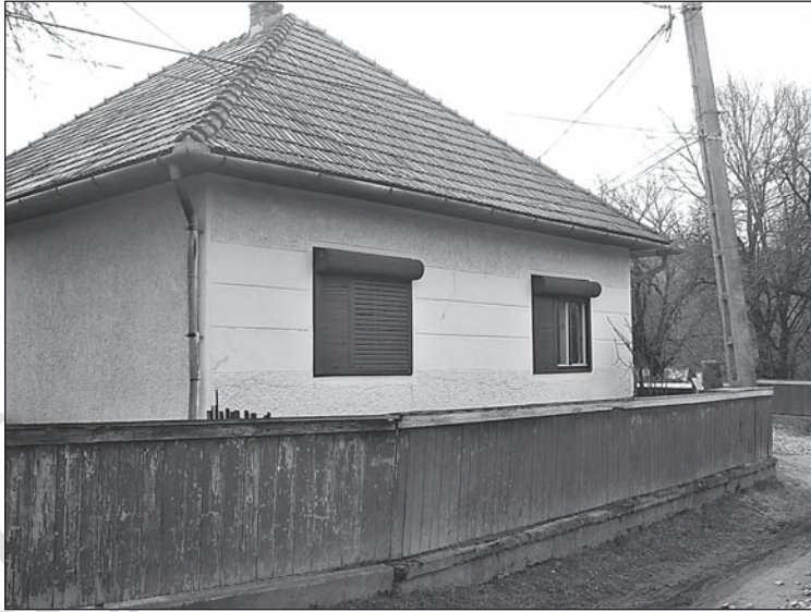
7. kép. Felújítás alatt álló kockaház, egy „helyi vállalkozó” család portáján