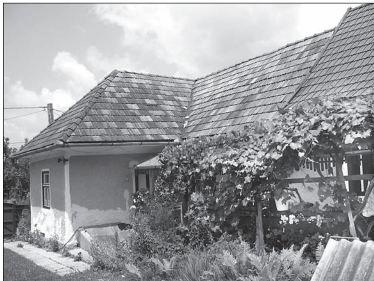
20. kép. „L” alaprajzú épület