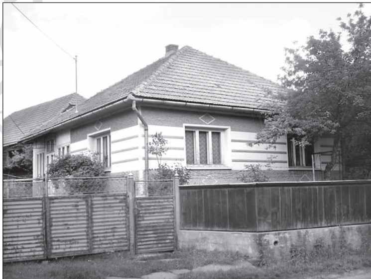
4. kép. Korábban valószínűleg sarokereszű épület, átalakítás után