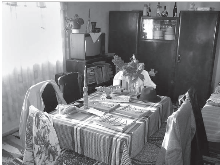
9. kép. Utcára néző, mindennapi használaton kívüli szoba egy tanító családnál. Az asztalon a neofolklorizmus jegyében készült faragások