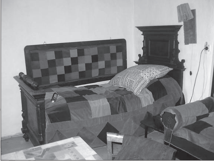
18. kép. A 3. életmodellhez tartozó enteriőrben található öröklött ágy. A ház jelenleg hétvégi házként funkcionál