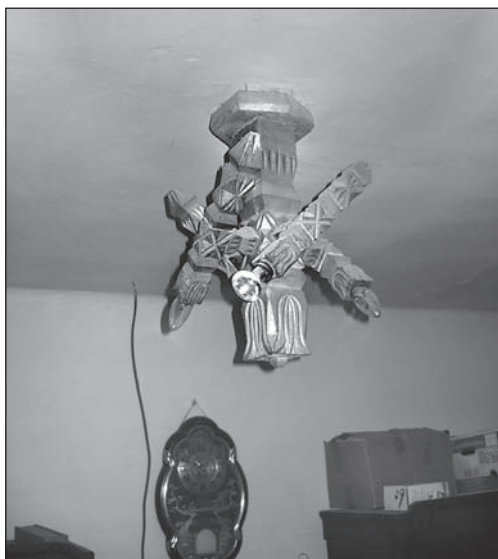
10. kép. Lámpa egy tanító család lakásában