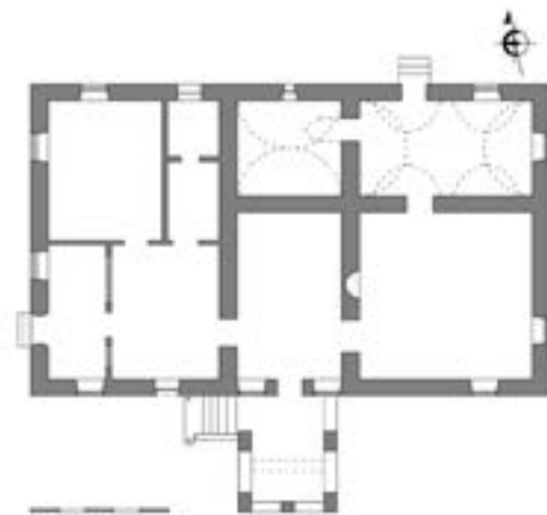
1. A cófalvi Veress-kúria alaprajza

A későklasszicista tömegű, homlokzatán gazdag empire díszítést viselő székelytamásfalvi Thury-Bányai-kúria annak köszönheti megmenekülését, hogy a '70-es évek derekán művelődési otthonná alakították. Igaz, drasztikus beavatkozások