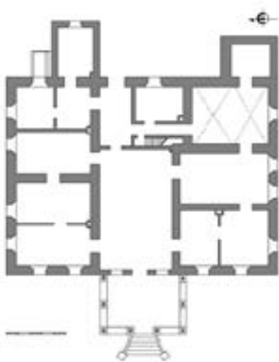
2. A zágoni Mikes-Szentkereszty-kúria alaprajza

árán, hiszen két reprezentatív termének egybenyitásával alakították ki a színpadot és nézőteret, az egykori gerendamennyezet és boltozat helyett a kornak megfelelően vasbeton födémet készítettek. A '90-es években a Bányai család leszármazottai visszaigényelték az épületet, majd a Zabolai Önkormányzat vásárolta meg és ma is művelődési házként működik, sajnos elég rossz állapotban várja, hogy felújítsák.