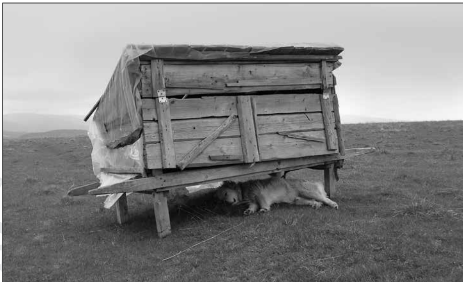
12. kép. Verebes a 21. században (2010. április 25.)

egy nagyobb helyiségből áll, itt történik a főzés és a tejfeldolgozás, 106 de ez a tér szolgál az esztana személyzetének szálláshelyéül is. Ezt a helyiséget kiegészíti egy attól elkülönített kisebb kamra, ahol az elkészült sajtot és ordát tárolják. A 2011-es nyári idény alatt is használt esztanaépület 2003-ban készült, öt falubeli juhtartó gazda közös munkájával. A szétszedhető, szállítható épülethez a szükséges faanyagot a csikmadarasi közbirtokosság biztosította.