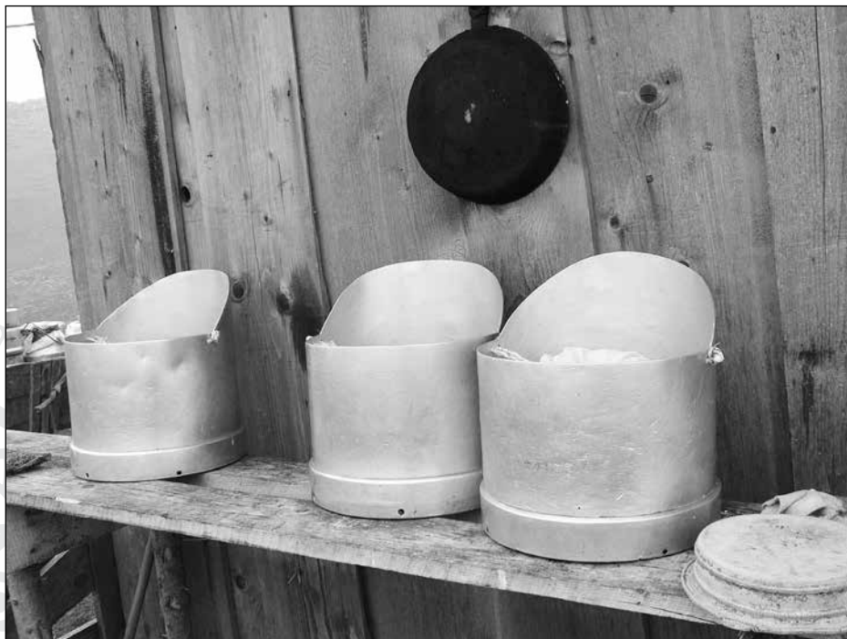
10. kép. Tejesbödönből kialakított fejővedrek (2011. szeptember 2.)