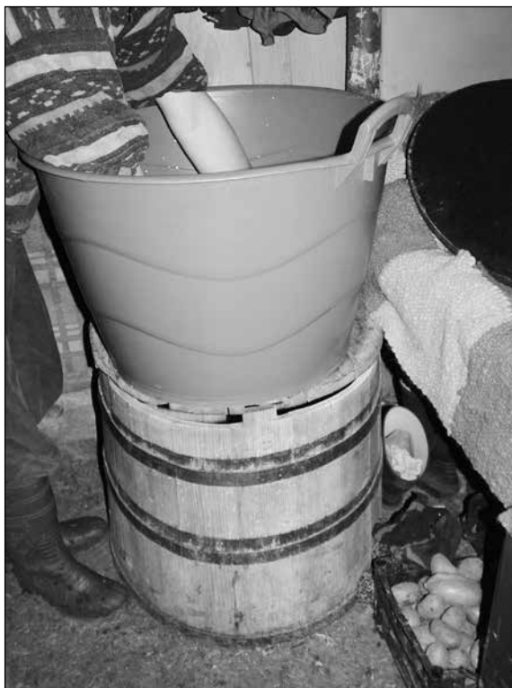
15. kép. Tejoltó kádak (2011. szeptember 2.)

A tárgyak között találunk olyan eszközt, amely kézműves tárgyként és gyári terméként egyaránt jelen van. A juhászok fából és műanyagból készült tejoltó kádat is használnak. (15. kép) A hagyományos típusnak a használata a dongaedényhez való ragaszkodással magyarázható, a műanyagból készült darabot pedig a tisztíthatóság és könnyebb használat miatt veszik igénybe. Az ilyen típusú edényeknek a használatát a kifejt tej mennyiségéhez is igazítják, hiszen nagyobb juhnyáj esetén, többnyire a nyári időszakban inkább a fából készült tejoltó kádat használják. Ősszel, a tejlhozam csökkenésével áttérnek a műanyag edény használatára. 118