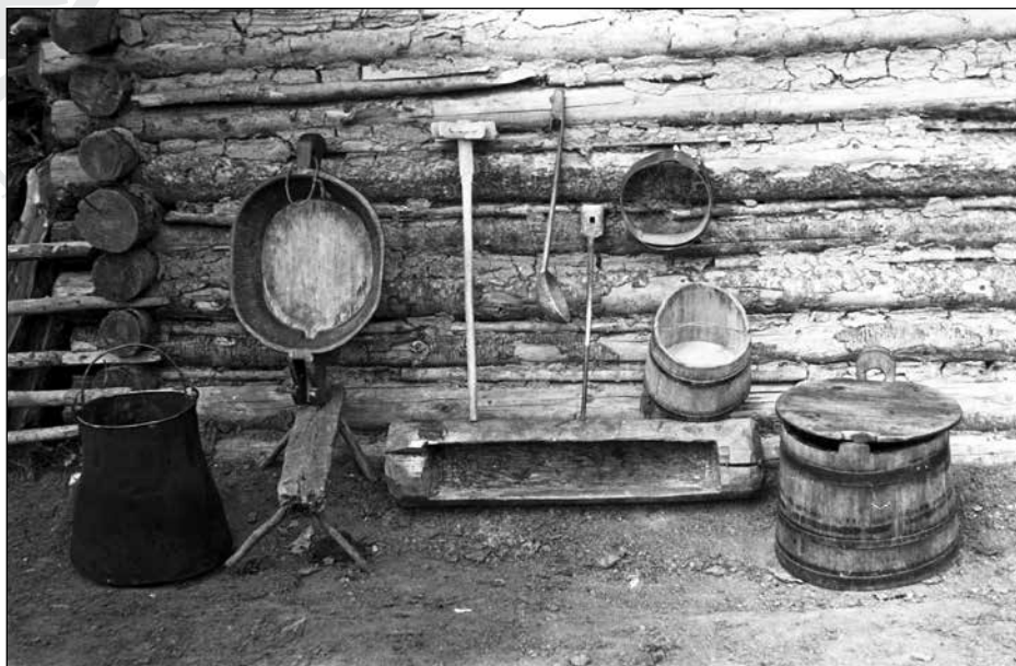
13. kép. A tejfeldolgozás eszközei (1962)

Vámszer Géza 1962-ben, a csíki juhászatról írt tanulmányában (a kutatást 1940-ben végezte) több csíki esztana alaprajzát és azoknak berendezését is szemlélte. Az ebből az időszakból származó esztanaépületek egy helyiségből álltak és a legszükségesebb berendezési eszközöknek adtak helyet. (13. kép) A mai esztenákhoz viszonyítva a legszembetűnőbb különbség a fekhellyel és tűzhellyel kapcsolatos, korábban ugyanis alacsony fekhelyként ún. piricset , tűzhelyként pedig a szoba egyik sarkában kialakított nyílt tűzhelyet használtak. (Vámszer 1962.) A fűtésre és főzésre alkalmas tűzhely fölé üsttartó kollátot helyeztek (K. Kovács 1969: 10).