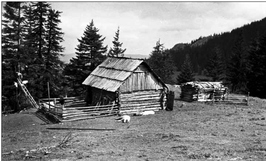
11. kép. Esztenaépület (Kurmatura-havas) (1962)

Kothencz Kelemen a sztinát a pásztorszállás központi építményének tartja, amely épületet jelent, azonban a kifejezés a mindennapi szóhasználatban nemcsak ezt a központi épületet, hanem a hozzá kapcsolódó építményeket és karámot, illetve a juhtartó telephelyet is magába foglalja (Kothencz 2007: 27).