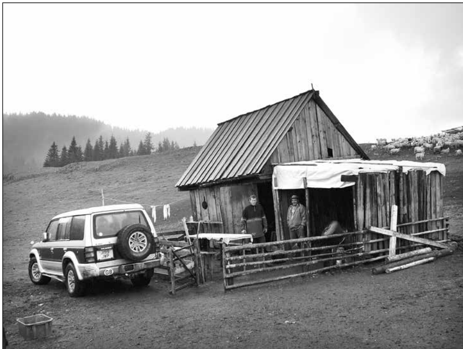
9. kép. Esztenaépület (2011. szeptember 2.)

A csikmadarasi juhászok nyári szálláshelyére ellátogatva az eszköztár sokszínűségével szembesültem. A szakirodalomból ismert hagyományos paraszti juhtartás eszköztárához viszonyítva a terepen talált eszközök sokkal árnyaltabb képet adnak napjaink juhászainak havasi életéről. Az esztena tárgyi felszereltsége tanúskodik a juhásztorok tevékenységének jellegéről, ugyanakkor megvilágítja azt is, hogy fogyasztói társadalmunkban, egy hagyományos állattartással foglalkozó réteg eszköztára milyen változásokat mutat. Az eszközök számbavételén és funkcionális leírásán túl elsősorban az egyén és tárgy kapcsolatára terjedt ki figyelmem, mindezt az esztenán megfigyeltek alapján, illetve a tárgyak használóinak eszközökre irányuló személyes elbeszéléseit vizsgálva látom megvalósíthatónak.