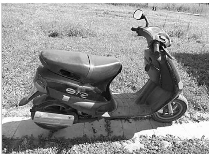
2. kép. A Piaggio ZIP

Legtovább, mai napig is azzal a Piaggio ZIP robogó/scooterrel való titokzatos lelki „viszonyom” készlet töprengésre, ami 2007 óta mai napig a tulajdonom – igaz, csak tíz éven keresztül szolgált becsülettel a marosvásárhelyi nagyvárosi forgalomban, mert 2017, a marosvásárhelyi szülői ház eladása óta leginkább Csíkban garázslakó.