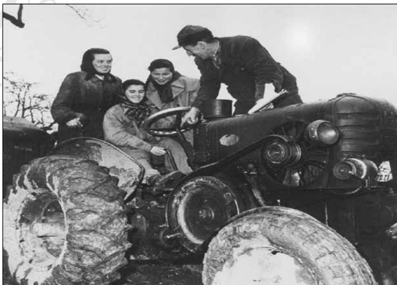
10. kép. Valamikor a szocialista korszak kezdetén, vidéken: érdeklődő lányok ismerkednek a traktorral. Jó ok van azt feltételezni, hogy ez egy, a női traktoristák toborzásához használt propaganda-kép.

1948-ban már az új hatalom diktálta propaganda és agitáció egyik főszereplője volt a traktor – és „lovasa”, a traktorista.