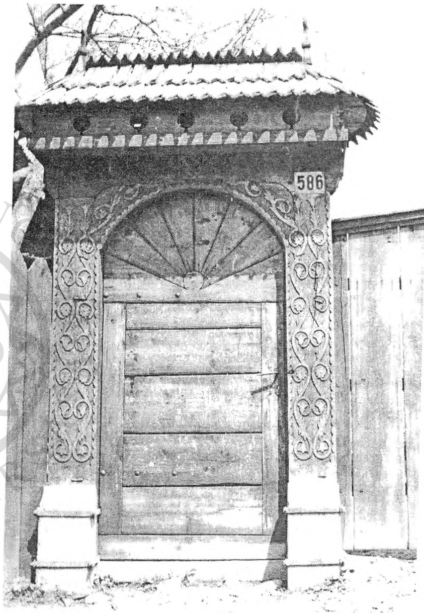
Szováta zsindeyes, katolikus keresztés, faragottdíszű kiskapu, 1970-es felvétel