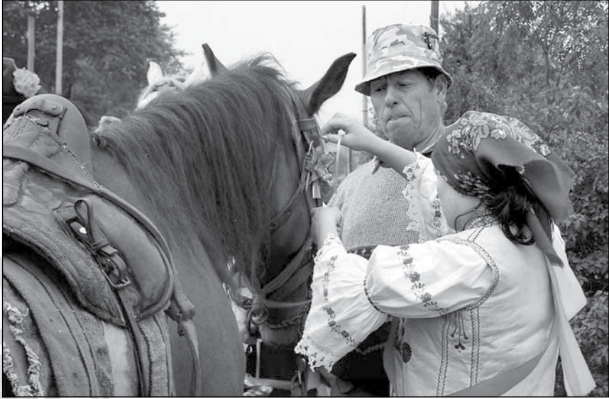
3. A csőzlány szalaggal díszíti a csőzlegény lovát. Gyimesközeplok, 2005