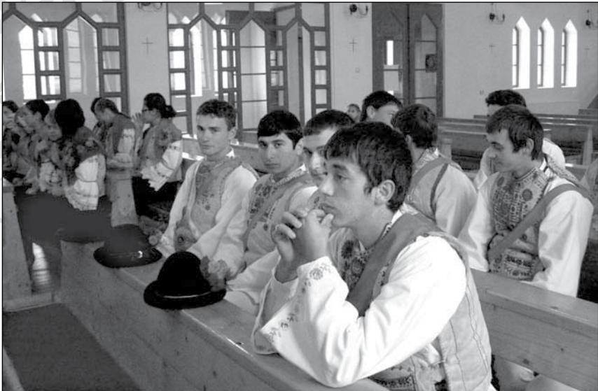
4. Csőzsmise a hidegségi plébániatemplomban (2007)