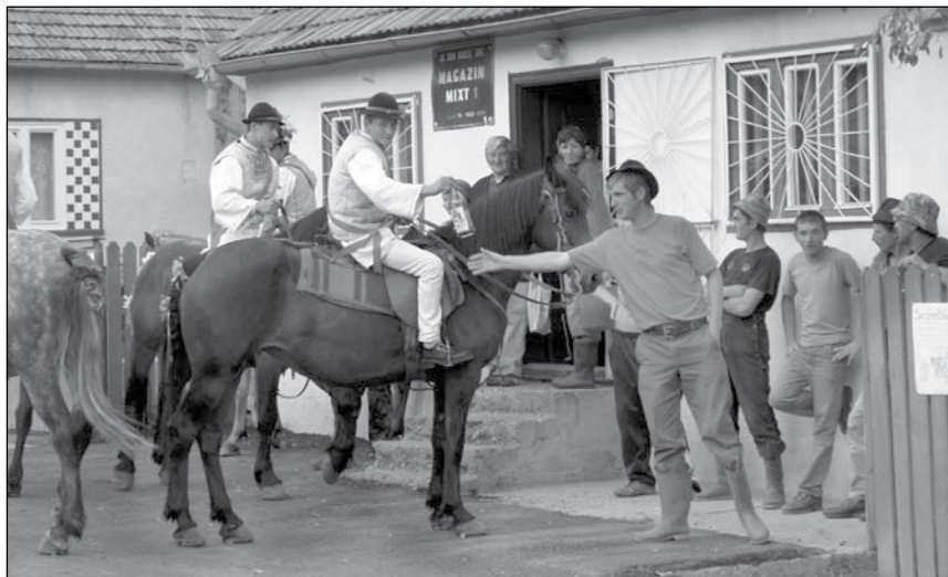
8-9. A csőszök megtisztelik – borral kínálják – és az esti bálba hívogatják a szüreti felvonulást néző ismerősöket. Hidegség, 2007