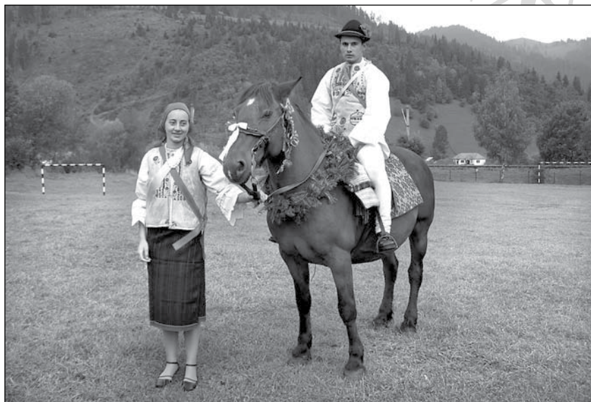
2. Csőszbíró és csőszbíróné a 2005-ös gyimesközéploki szüreti felvonuláskor