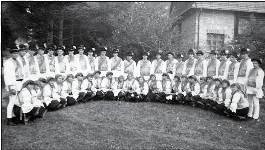
12. Csőszlegények és -leányok koszorúja. Gyimesközplok, 1980-as évek vége