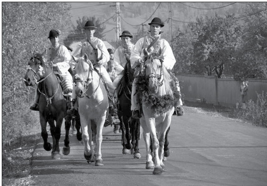
5. Szüreti felvonulás, elöl a csőszbíró vezeti a menetet. Hidegség, 2007