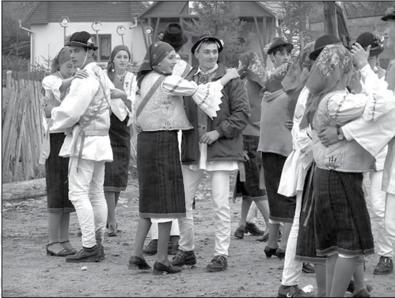
7. A gyimesközéploki csőszök tánca a hidegségi vendéglő előtt (2005)