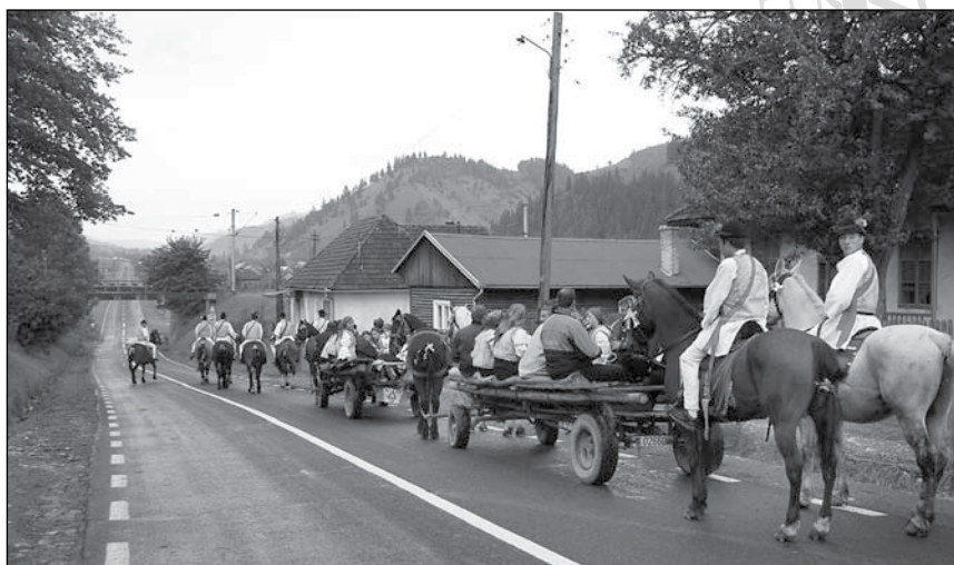
6. A szüreti felvonulás rendezett sorai a gyimesközéploki műúton (2005)