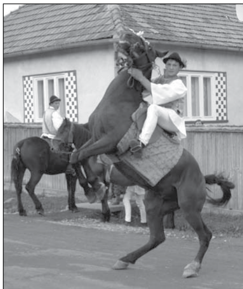
10. „Eregetés“, a ló ugratása virtusból (a fényképezést külön kérte a csőszlegény). Hidegség, 2007