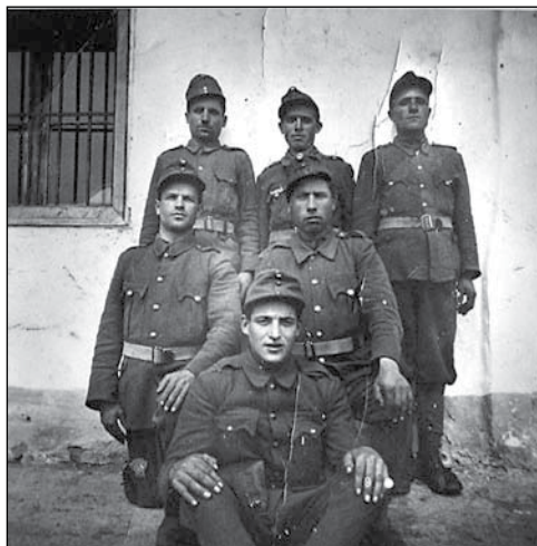
1. Gyimesi legények a katonaságnál