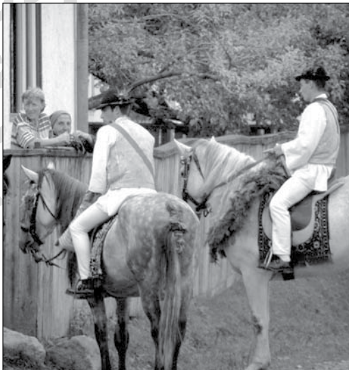
8-9. A csőszök megtisztelik – borral kínálják – és az esti bálba hívogatják a szüreti felvonulást néző ismerősöket. Hidegség, 2007