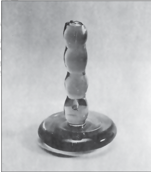
2. Üveg vasaló