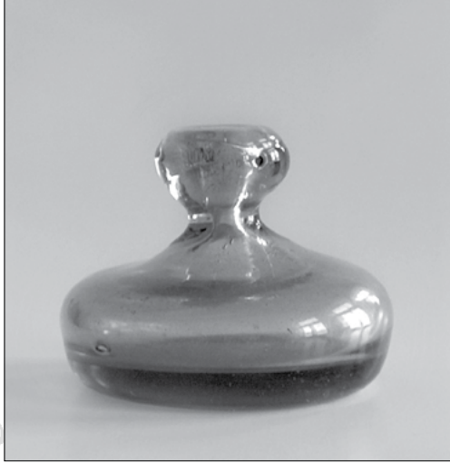
1. Vászonsimító