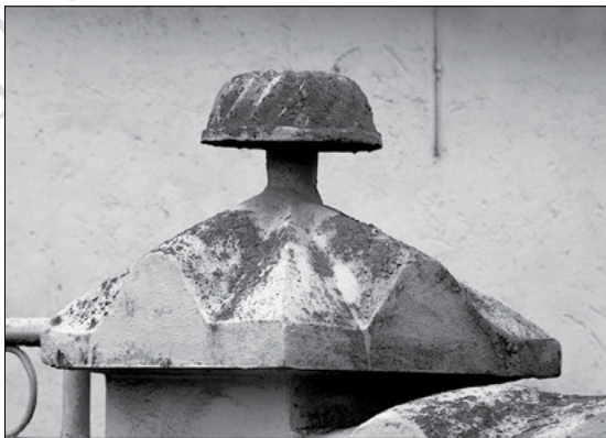
10. Kuglóf formájú kapudísz