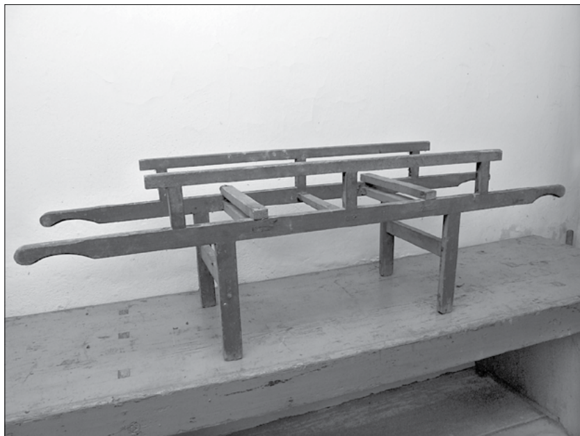
11. Gyerekméretű Szent Mihály lova