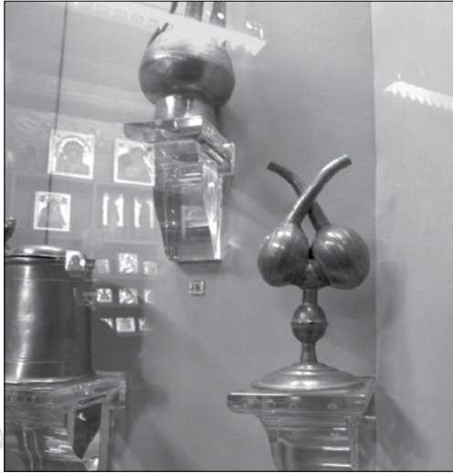
5. Fémedény