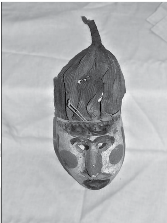
9. Boricás maszk