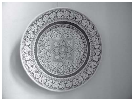
1–3. Józsa László korondi keramikus falitányérjai