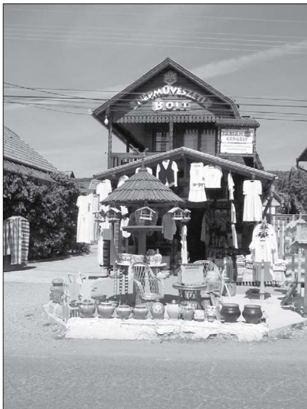
5. Korondi népművészeti bolt ajánlata