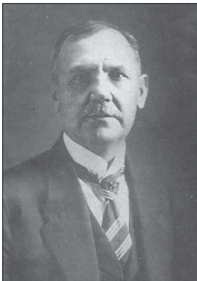
2. Csutak Vilmos 1878 – 1936