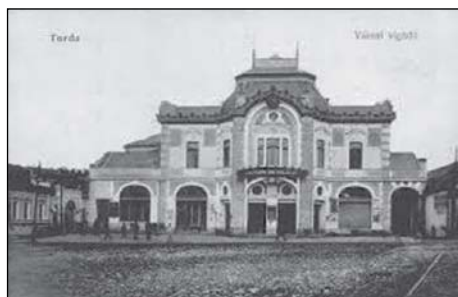
1. A kiállítás helyszíne: a Vigadó