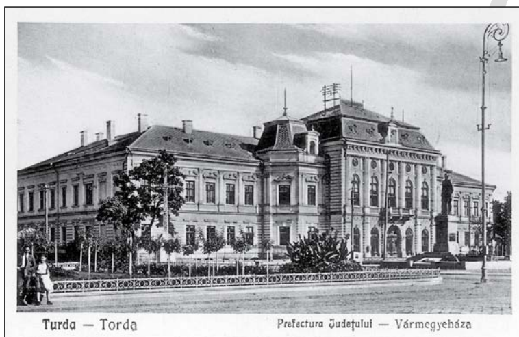
2. A kiállítás helyszíne: a megyeház