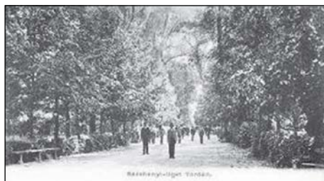
3. A kiállítás helyszíne: a Széchenyi liget