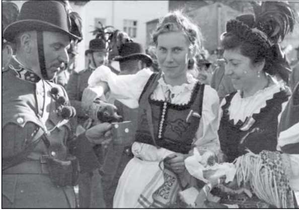
3. Székelyruhába öltözött lányok a magyar bevonuláskor, Sepsiszentgyörgy, 1940. Székely Nemzeti Múzeum fototékája, JA18-9-2. Ismeretlen fotós.