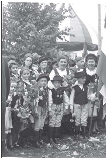
4. Székelyruhába öltözött tömeg a magyar bevonuláskor, Sepsiszentgyörgy, 1940. Székely Nemzeti Múzeum fototékája, JA20-1-1. Ismeretlen fotós.