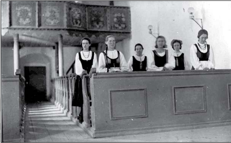
1. Székelyruhába öltözött lányok a zabolai református templomban. F. 281. 1935.