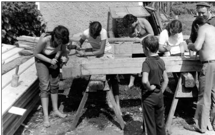
5. Székelykapu-faragás az 1983-as augusztusi faragótáborban