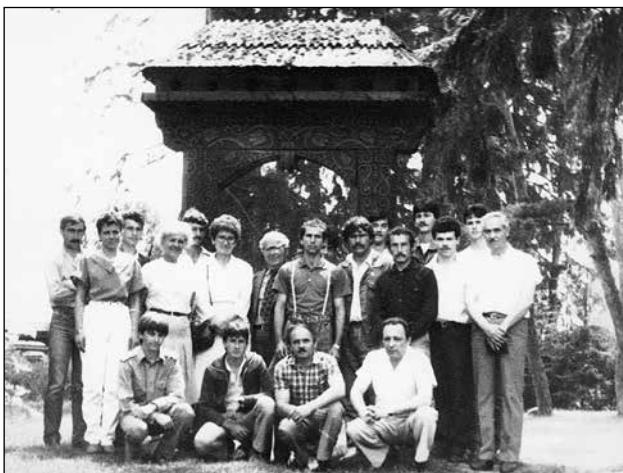
2. A népi művészeti iskola 1986–1988-as végzős növendékei