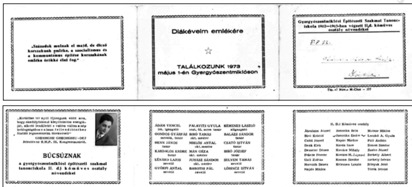
2. Kicsengetési kártya, Gyergyószentmiklósi Építészeti Szakmai Tanonciskola, 1963