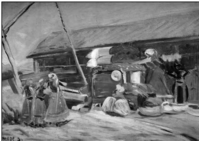
7. Dóczyiné Berde Amál: Rakják a kelengyét.