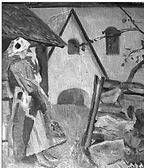
8. Dóczyiné Berde Amál: Kalotaszegi leány, 1930-as évek, 61,5 × 76,5 cm, magántulajdon.