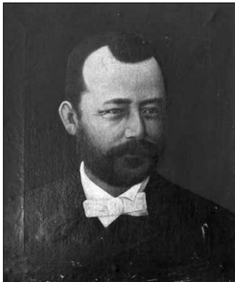
1. Dr. Bartók György (1882–1970) A kép kb. 1886–1892 között készült Nagyenyeden, rabmunka.