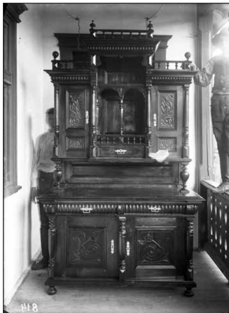
2. kép. Fullner Károly kovásznai asztalos által készített szekrény. Roediger Lajos felvétele, 1920 körül. Székely Nemzeti Múzeum fotótára, Neg-50-76-os jelzet.