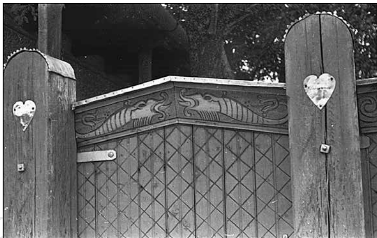
8. kép. Sárkánykígyós kapu. Moldovan Nicolae felvétele, 1980-as évek. Székely Nemzeti Múzeum fotótára, A-93-1-es jelzet.