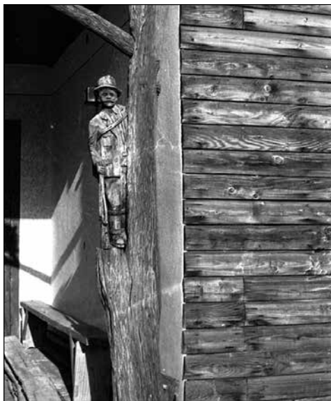
13. kép. Varga György házának bejárata. 1980-as évek. A-136-7-es jelzet.