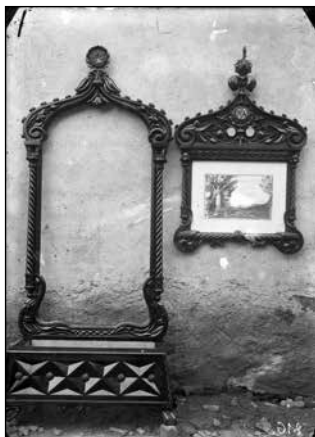
1. kép. Némethi Árpád asztalos képkeretei. Roediger Lajos felvétele, 1920 körül. Székely Nemzeti Múzeum fotótára, Neg-21-14-es jelzet.