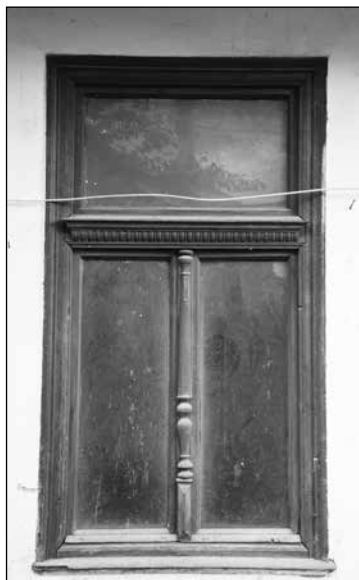
5. kép. Esztergált ablak Kovászna, Vajnafalva városrészén. Szőcsné Gazda Enikő felvétele, 2020.