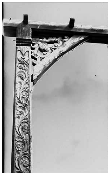
4. kép. Bevonulási díszkapu a város szélén, eredeti helyén. Gazda Klára felvétele, 1970 körül. Székely Nemzeti Múzeum fotótára, A-35-4-es jelzet.