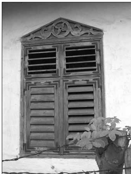
6. kép. Rátétdíszes ablak a Mész utcában. Szőcsné Gazda Enikő felvétele, 2007.