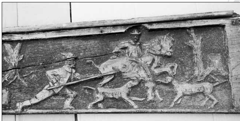
14–15. kép: Varga György kapuja. A faragványok a Székely Nemzeti Múzeum tulajdonában vannak, N. 334-es leltárszám alatt.