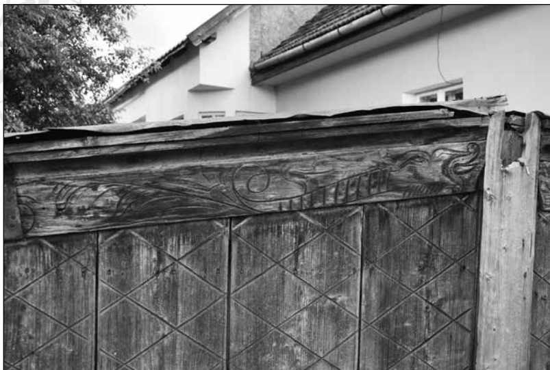
9. kép. Sárkánykígyós kapu maradványai. Szócsné Gazda Enikő felvétele, 2020.