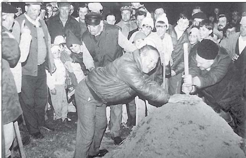
5. Megcsapás a határhompon (Nyárádszereda, 1991)