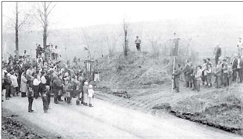
4. Két határkerülő menet találkozása (Nyárádremete–Köszvényes, 1991)