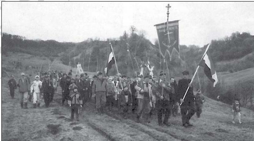
1. Húsvéti határkerülés (Nyáradremete, 1999)

1900 Húsvéti szokások. Erdély Népei III. 17–23.