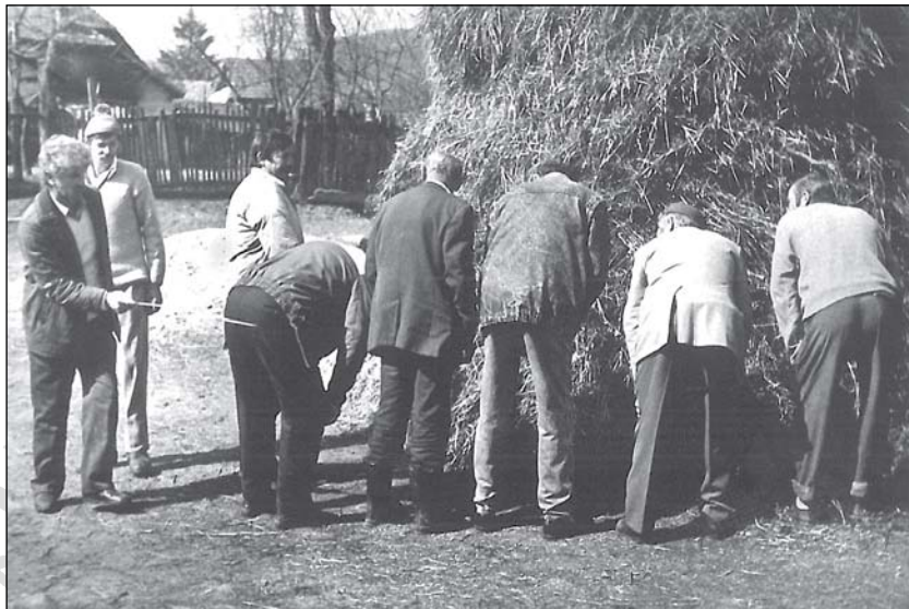
8. A végén mindenkinek kijár a botból... (Rigmány, 1995)