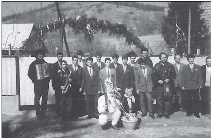
2. Húsvéti öntöző menet indulás előtt. Középen guggolva az álarcos húsvéti bolond (kardos, kókós) és felesége (Szentháromság, 1999)