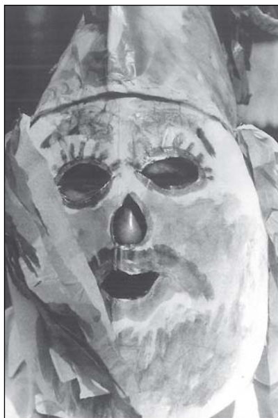
7. A húsvéti bolond (hamubotos) álarca