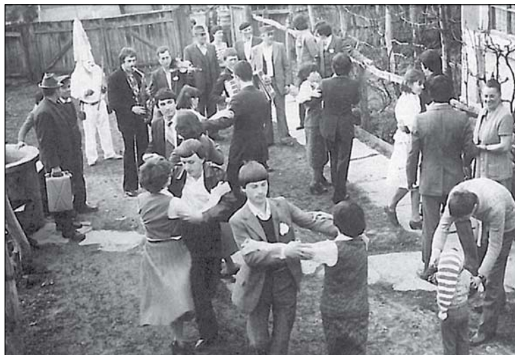
6. Ünnepi közösség és szórakozás húsvétkor (Szentháromság, 1983)