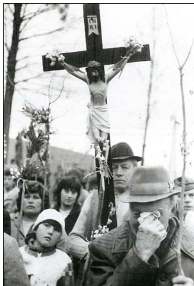
3. „Feltámadt Krisztus e napon” (Nyárádremete 1991)