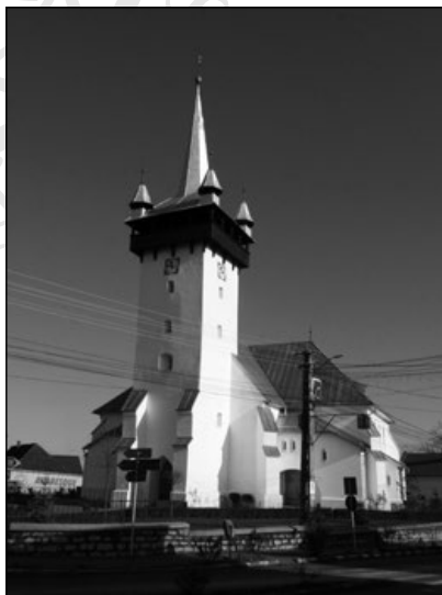
2. A krasznai református templom