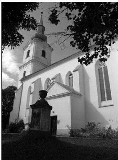
3. A szilágynagyfalusi református templom