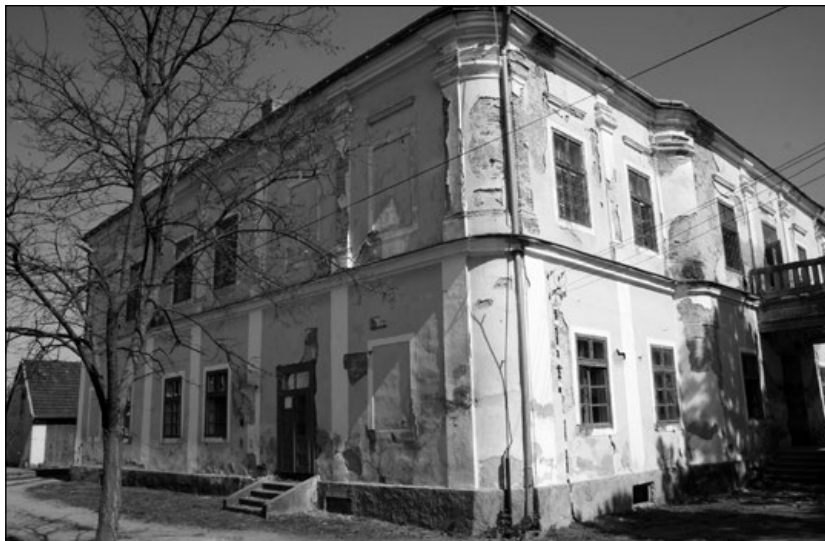
4. A szilágynagyfalusi Bánffy-kastély