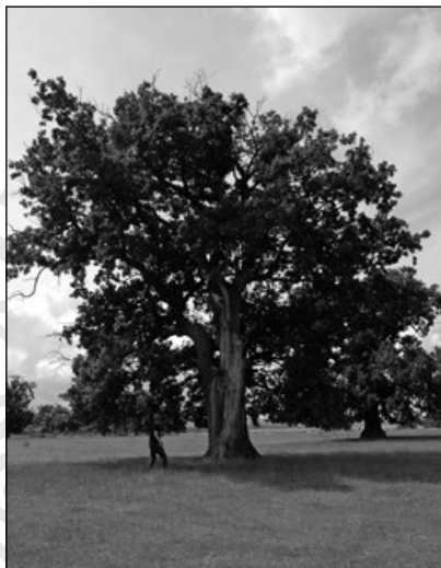
1. Tölgyfás legelő Szilágynagyfalu mellett a Lápisi erdőnél