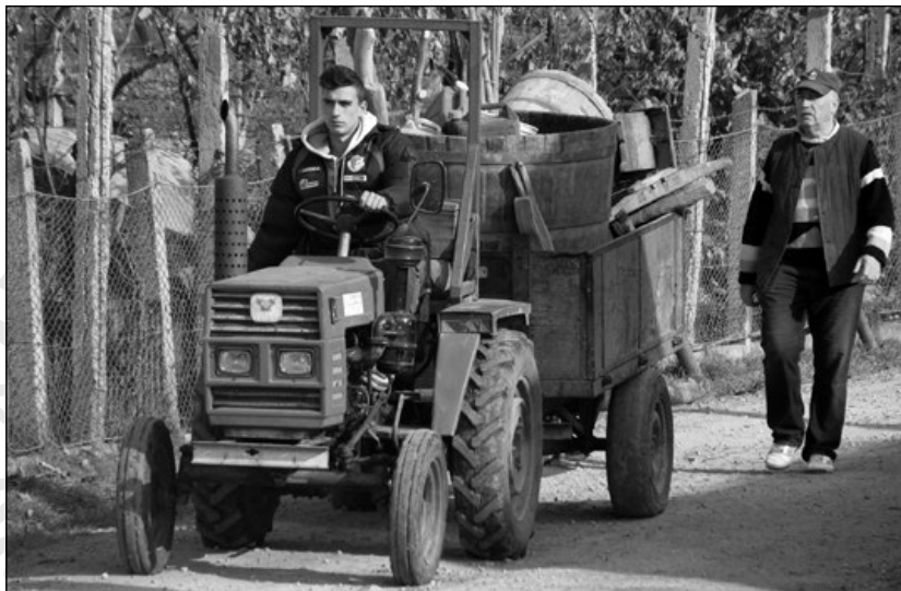
6. Hazaköltözés a szőlőbeli házból (Lecsmér)