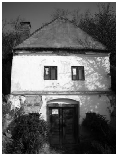
5. Eladó szőlőbeli ház (Lecsmér)