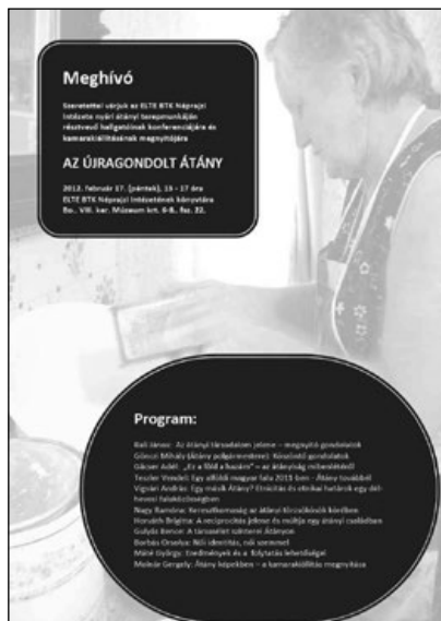
1. A 2012. február 17-i konferencia plakátja