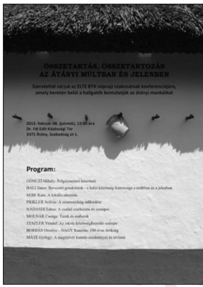
2. A 2013. február 8-i konferencia plakátja