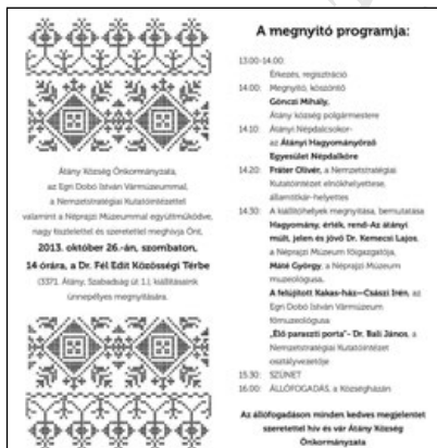
3-4. A kiállítóhelyek megnyitásának ünnepi műsora (2013. október 26.)