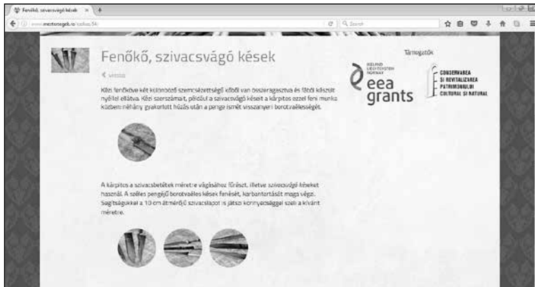
6. A szerszámkészlet kategóriáinak bemutatási rendje