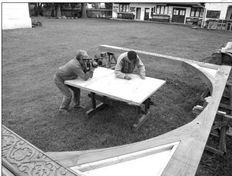
12. Werkfotó: a csernátони Haszmann-műhely hagyományos jelképei