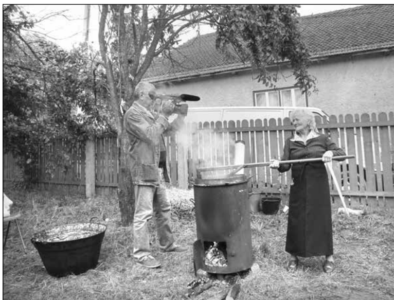
11. Werkfotó: a szilva felhasználása Feldobolyban