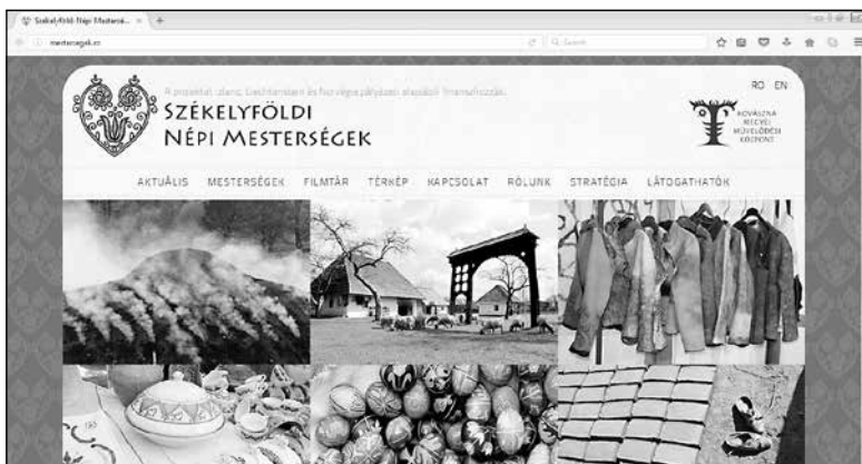
1. A Székelyföldi népi mesterségek projekt honlapja