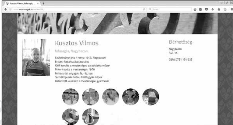
4. Fafaragó mester adatlapja