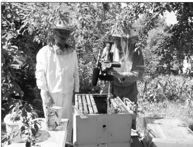
10. Werkfotó: a kálnoki méhészet