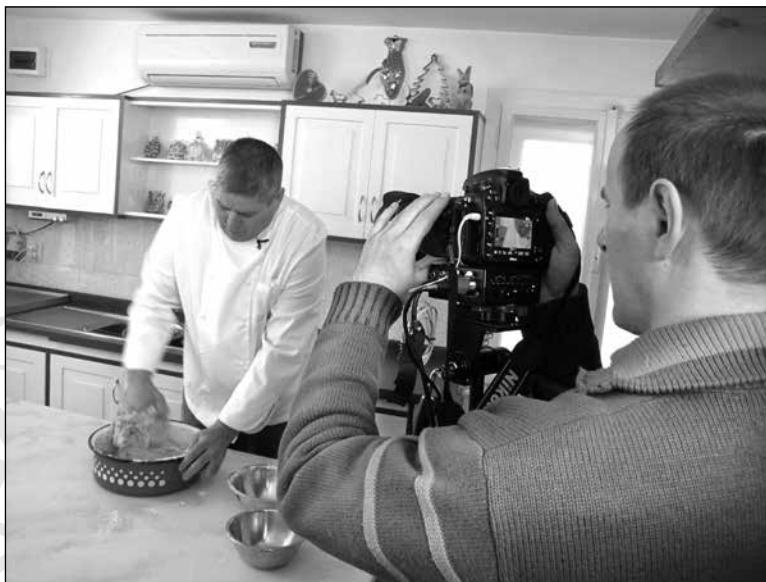
9. Werkfotó: a kézdivásárhelyi mézeskalácsosság