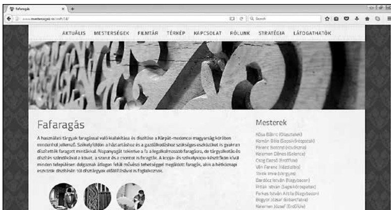
3. A fafaragás rövid leírása és az adatbázisba került mesterek listája