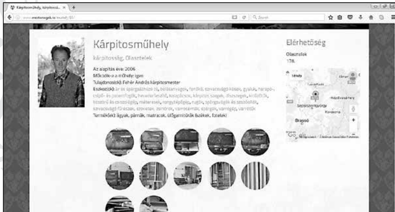
5. Kárpitosműhely mint virtuális múzeum