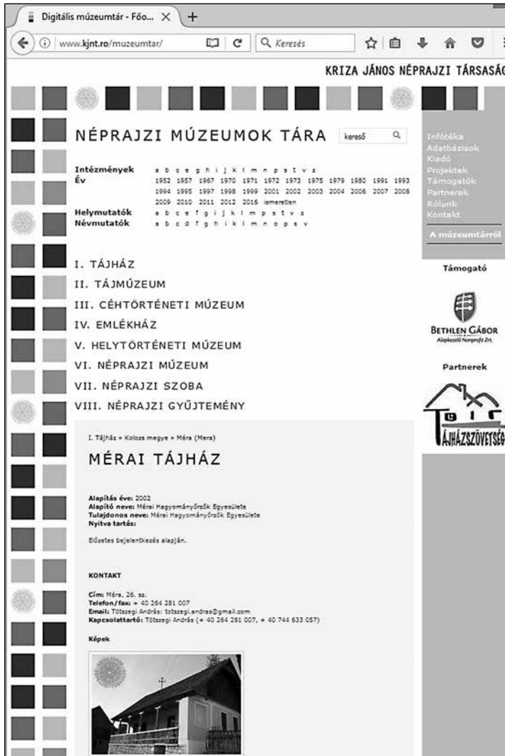
7. A Múzeumtár főoldala, egy véletlenszerű adatlappal