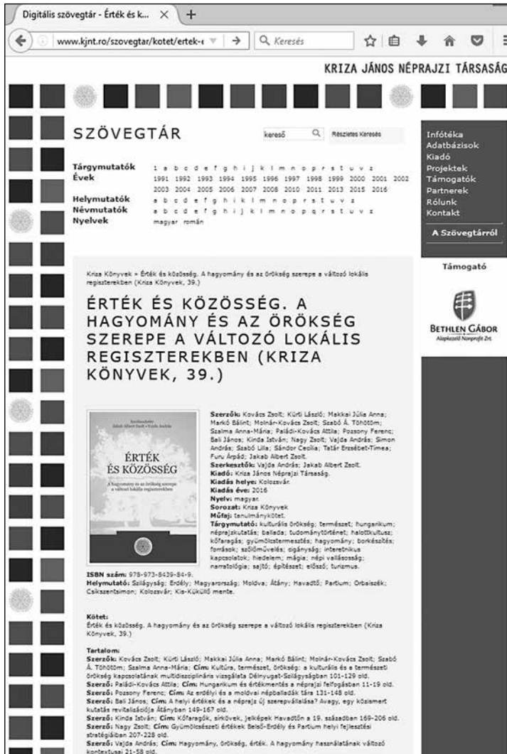
11. A Szövegtár egyik kötetének leírása