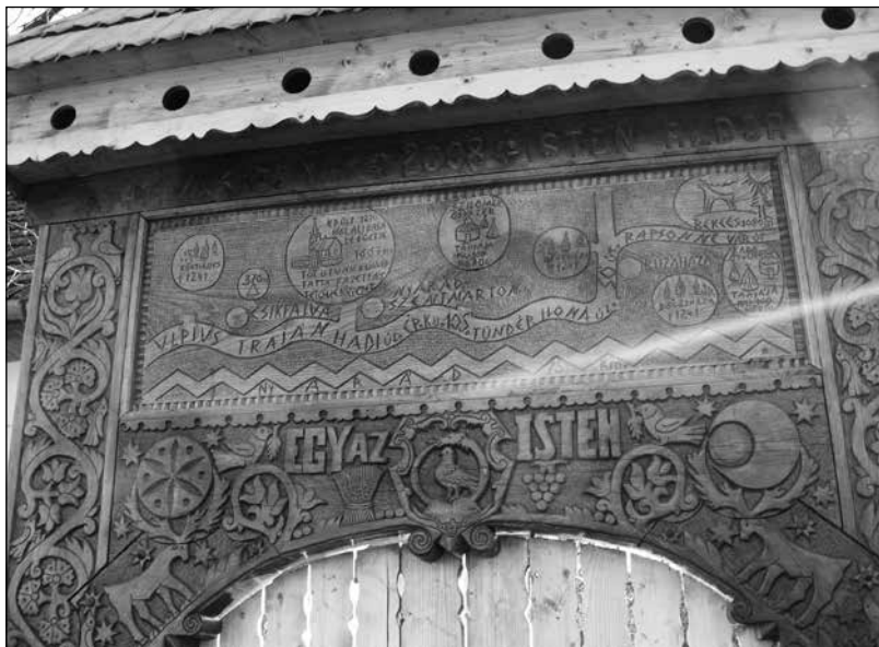
5. A nyárádszentmártoni papilak székelykapujának „örökségtérképe”