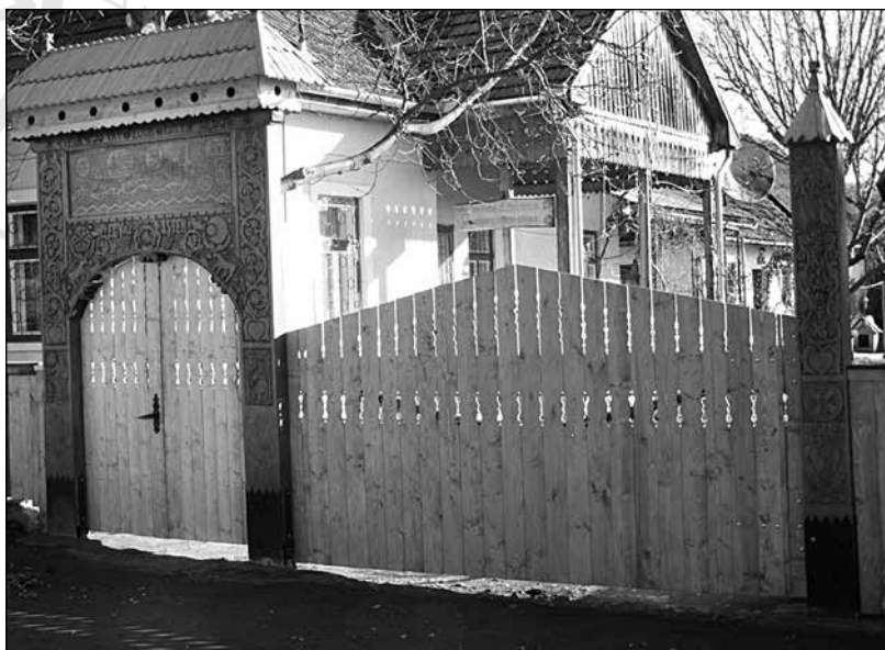
4. A nyárádszentmártoni papilak székelykapuja