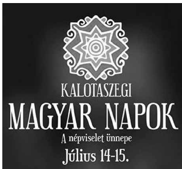
4. A Kalotaszegi Magyar Napok logója (2018)