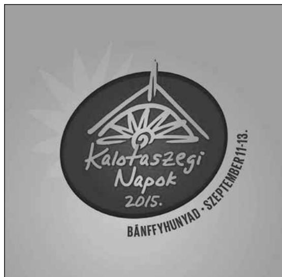
2. A Kalotaszegi Napok logója (2015)