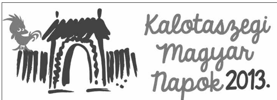
1. A Kalotaszegi Magyar Napok logója (2013)