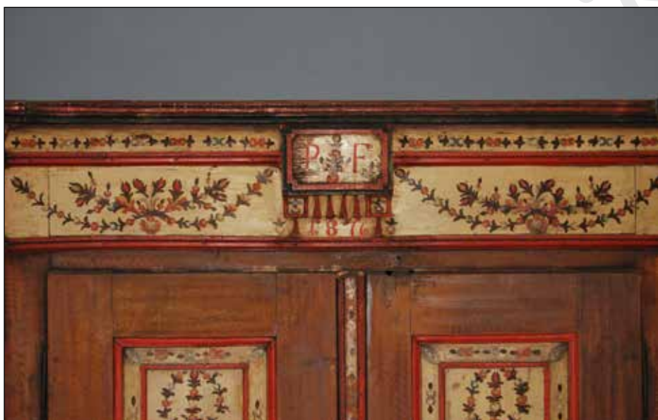
1–4. Állószekrény. Gyűjtő: K. Csilléry Klára. Néprajzi Múzeum, Bútor- és világítóeszközgyűjtemény, lelt. sz. 62.70.3.