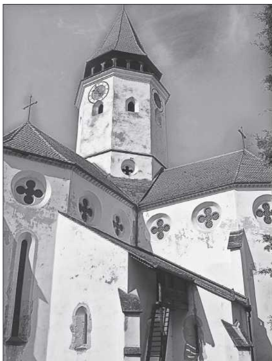
A prázsmári vártemplom