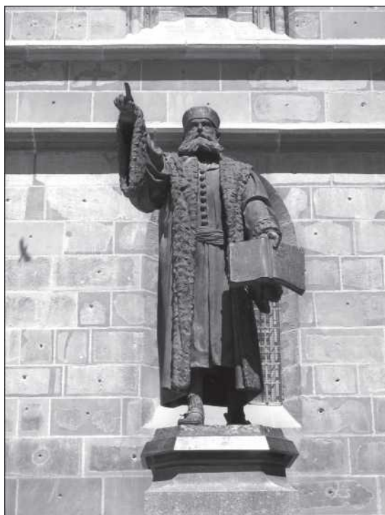
Johannes Honterus szobra Brassóban (Hampel Binder Aladár)