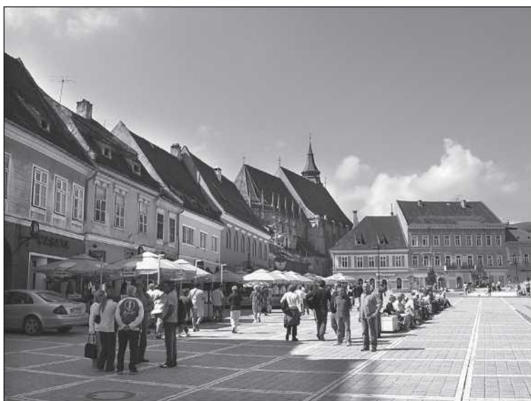
A brassói piactér a Fekete templommal