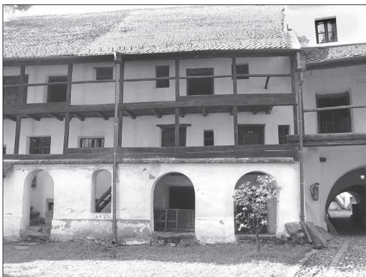
A prázsmári templomerőd családi kamrái