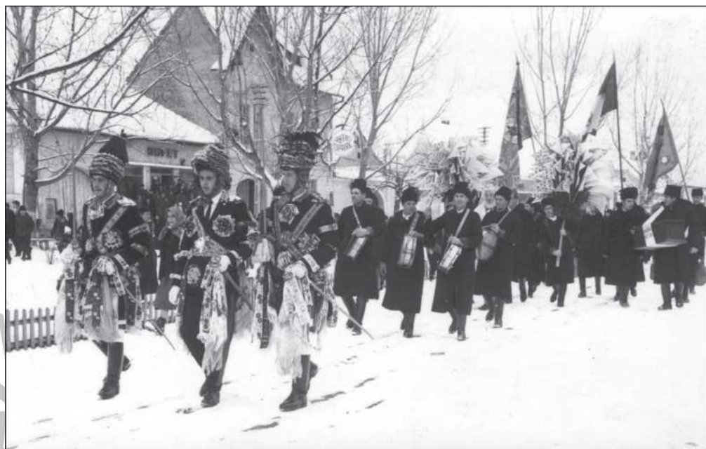
Szomszédságegyesület farsanguégi felvonulása Szászkezdén