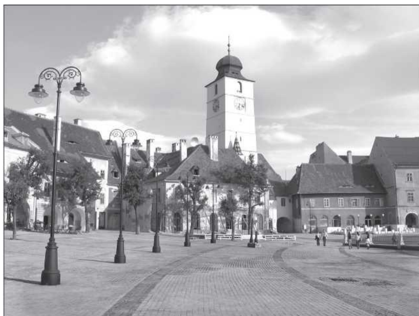
Nagyszebeni kispiac a városi tanács tornyával