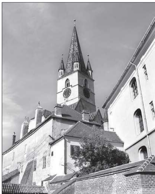
Nagyszebeni szász lutheránus katedrális