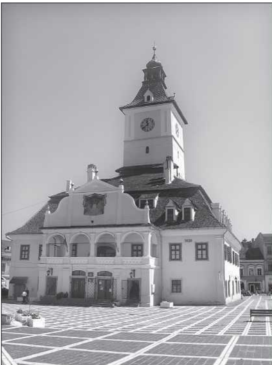
A brassói városháza