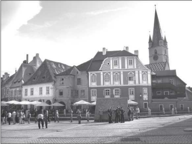
Nagyszebeni kispiac a szász templommal