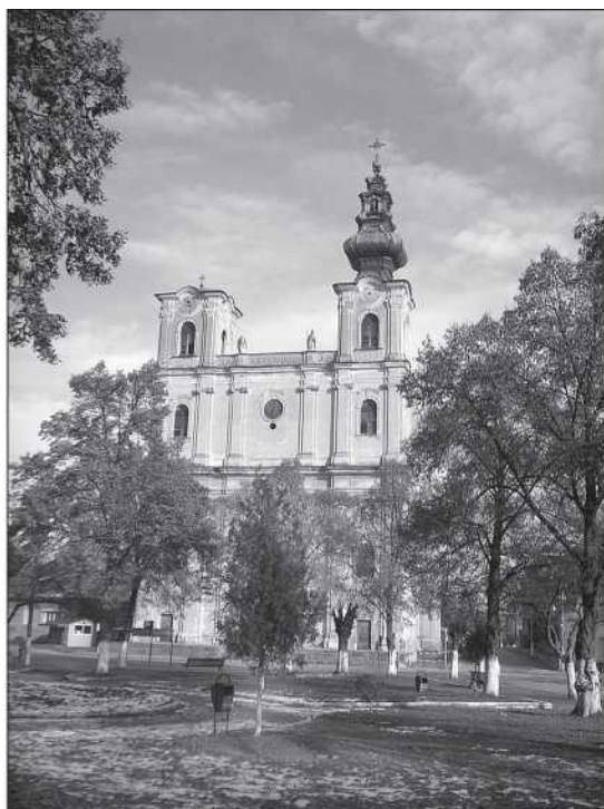
Erzsébetvárosi örmény katolikus templom (Miklós Zoltán)