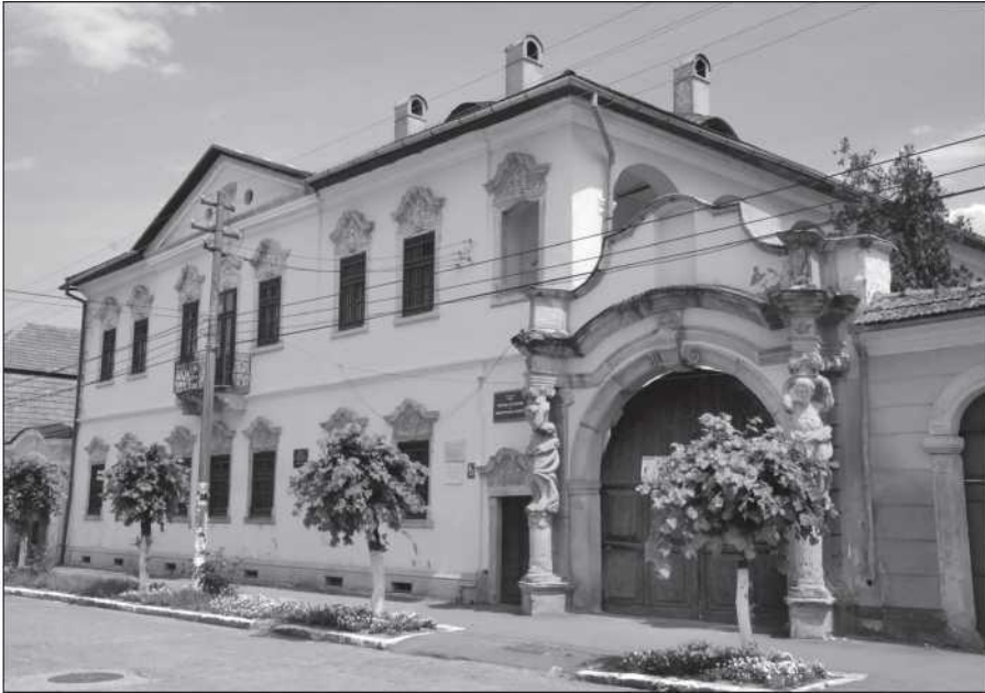
A szamosújvári múzeum