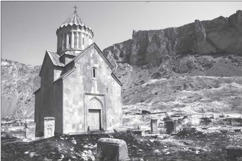
Areni kolostor Örményországban (Szilágyi Palkó Pál)