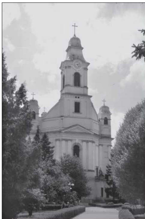
Örmény katedrális Szamosújváron