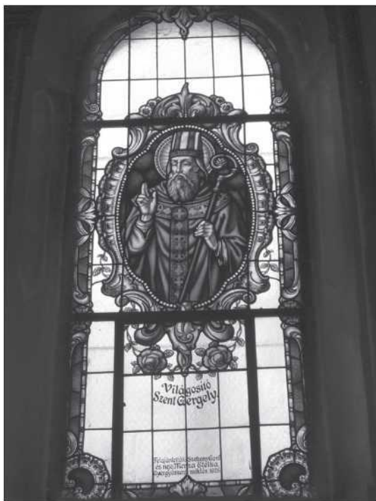
Világosító Szent Gergely képe a csíkszépvízi templom ablakán (Pál Katalin)