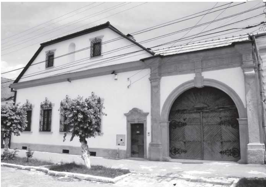
Örmény családi ház Szamosújváron