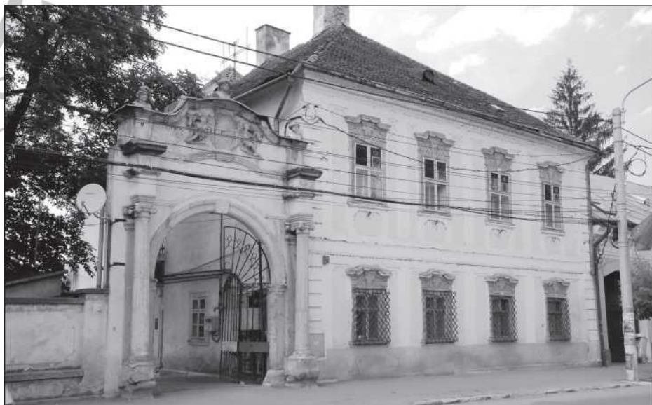
Örmény porta Szamosújváron