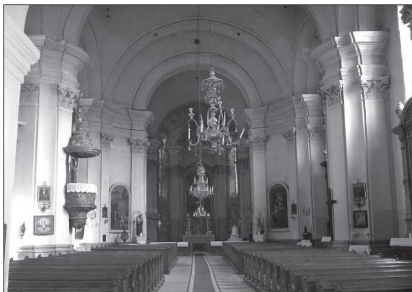
Az erzsébetvárosi örmény katolikus templom belseje (Miklós Zoltán)