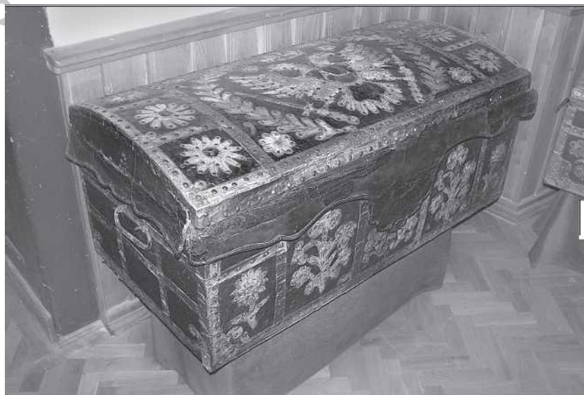
Gyergyószentmiklósi hozományos láda (Szőcs Levente)