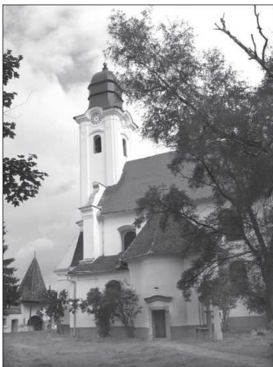
A gyergyószentmiklósi örmény katolikus templom