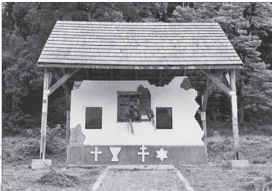
A síratófal Bözödújfalu fölött