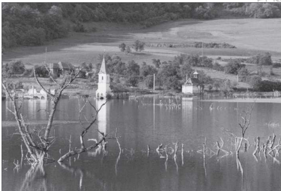
A bözödújfalusi templomok a tó vízében