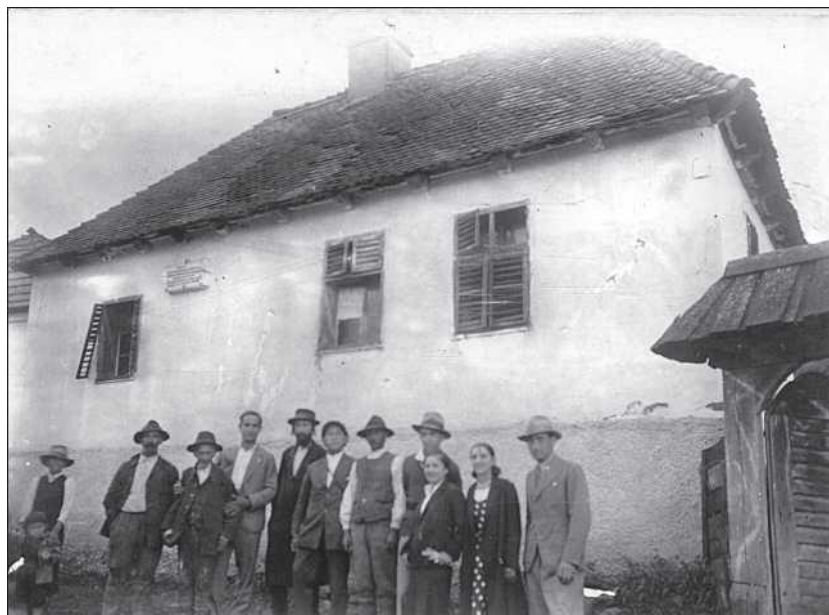
Bözödújfalusi székely zsidók a zsinagóga előtt (Kauftheil Ernő)