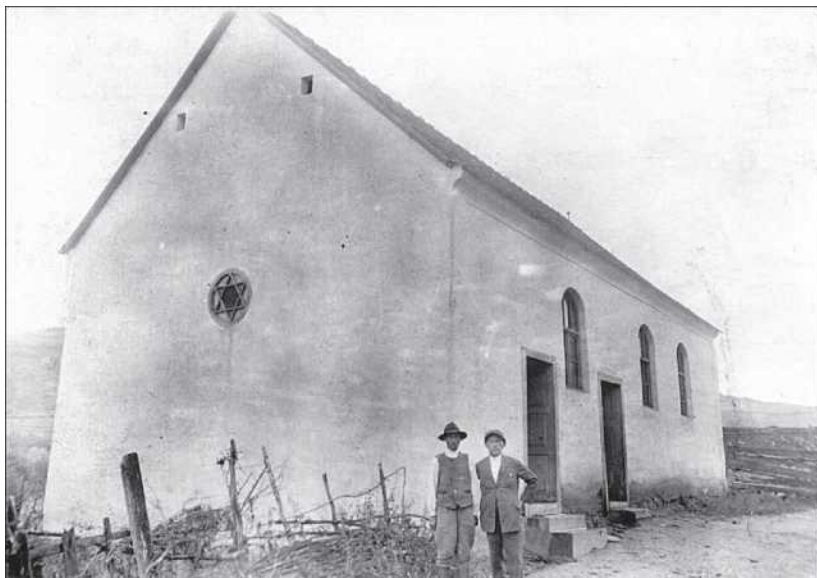
A bözödújfalusi zsinagóga a két világháború között (Kauftheil Ernő)