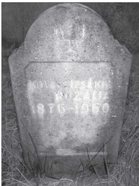
Székely zsidó sírköve a bözödújfalusi temetőben (Szócs Lajos)