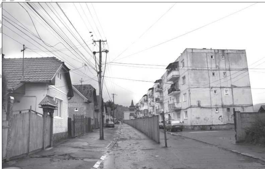
Az órkkői „berlini fal” a cigány és a magyar negyed között (Vörös Balázs)