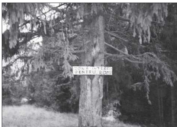
Mócvidéki tábla: Cigányoknak belépni tilos