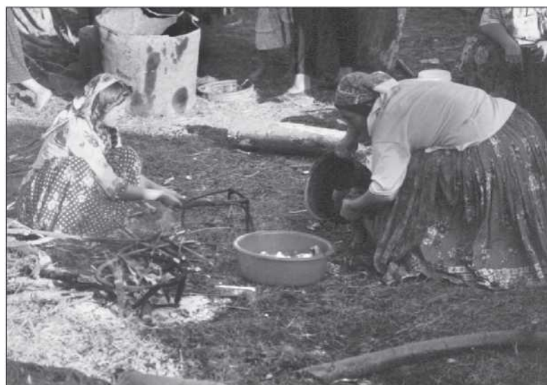
Készül az ebéd a borévi táborban