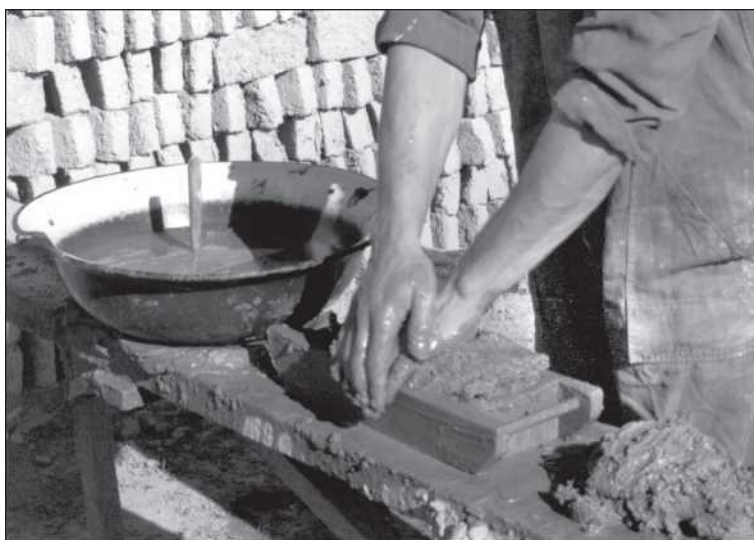
Tégldvetés Nagyborosnyón (Kozma Imre)