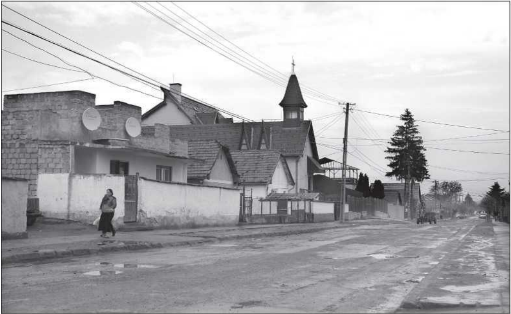
A cigányok őrkői temploma (Vörös Balázs)