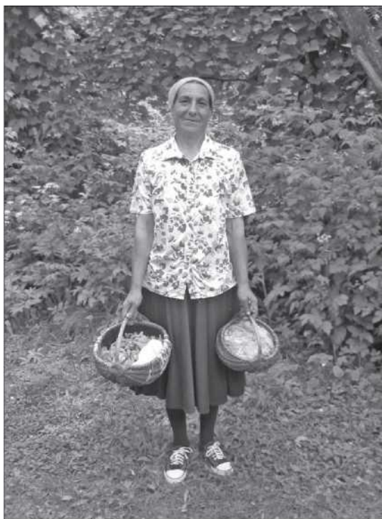
Gombát áruló cigány asszony Zabolán