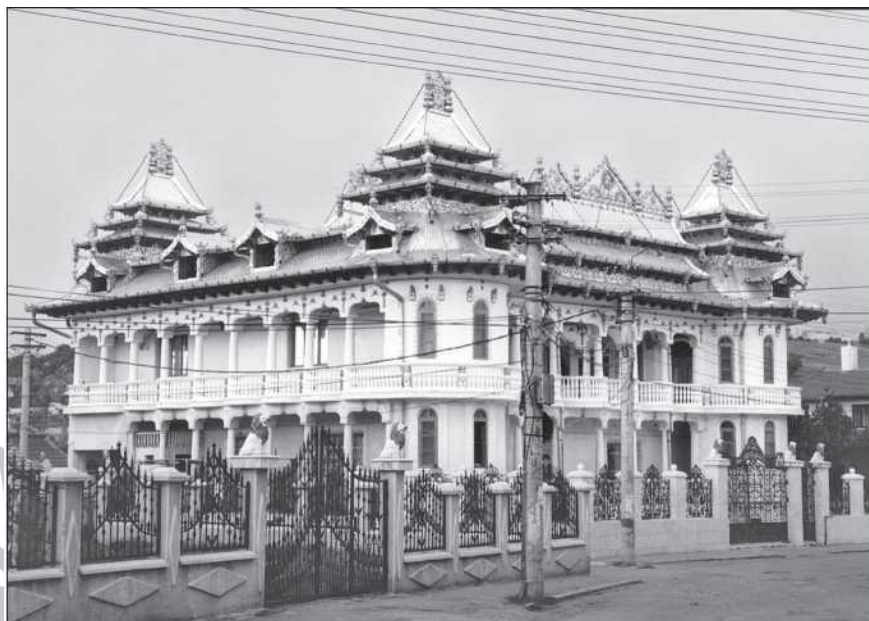
Az Ici-villa Tordán