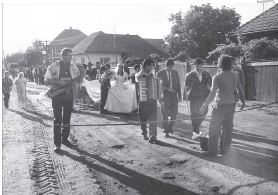
Cigány lakodalmas menet Zabolán