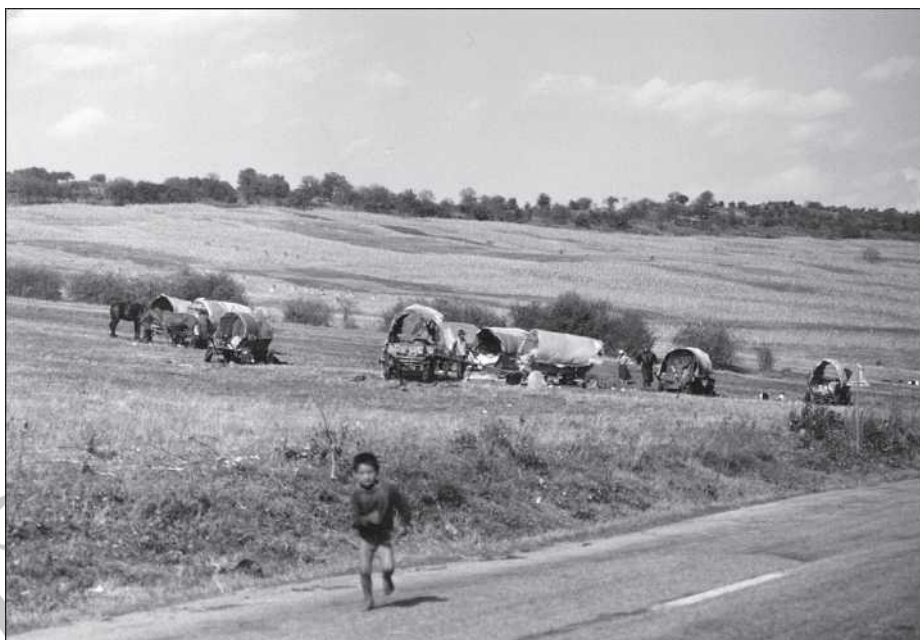
Székertábor a szilágysági Varsolc mellett