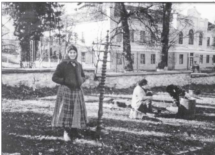
Kelderási cigányok Szentágotán