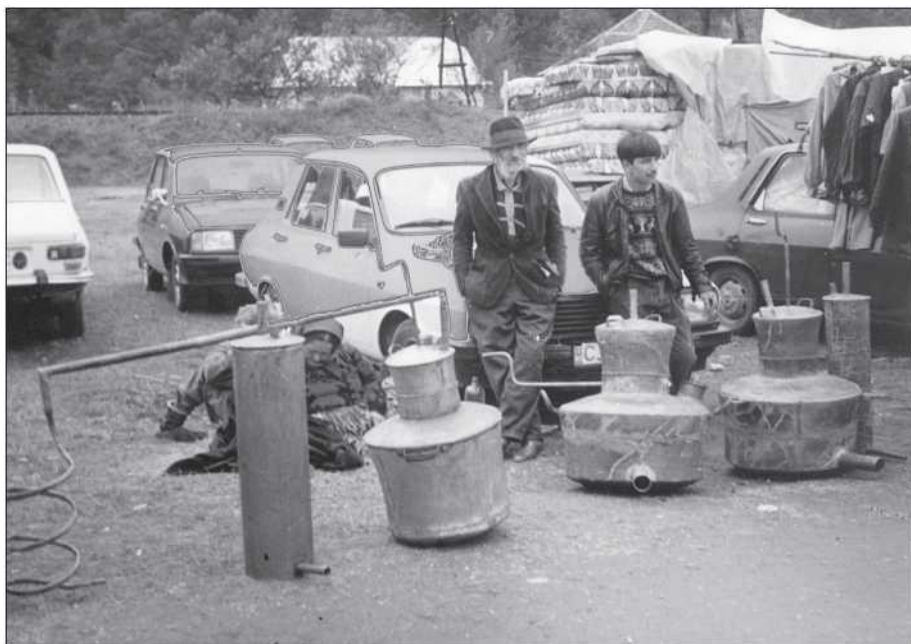
Kelderási cigányok rézedényeikkel Feketetón