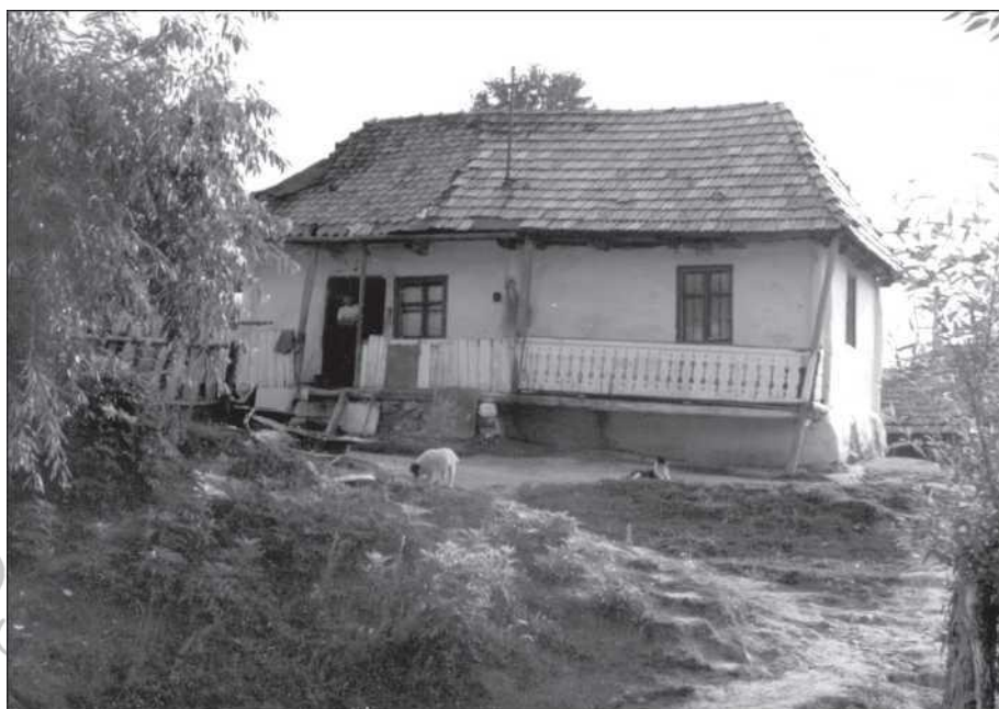
Magyar ajkú cigány háza Zabolán (Dimény Attila)