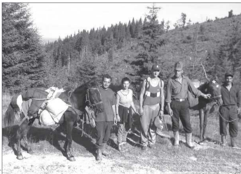
Áfonyaszedő cigány csoport a zabolai havasokban