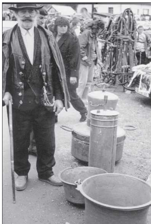
Kelderási cigányok Feketetón