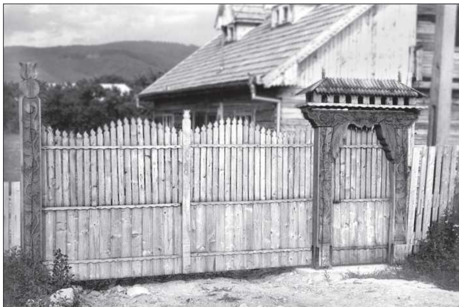
Székelykapu a cigányok épülő villája előtt Zabolán (Dimény Attila)