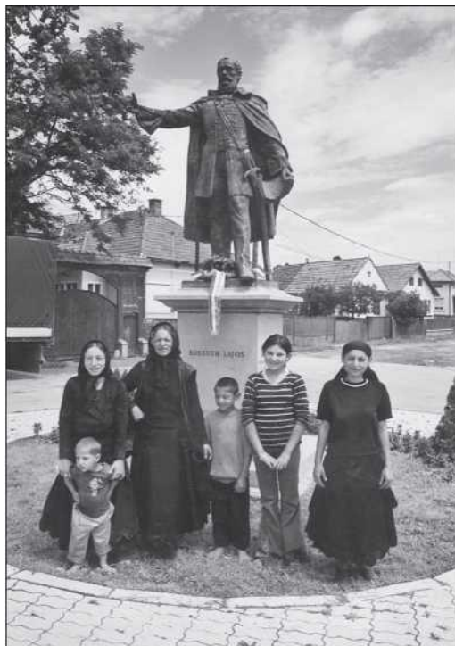
Özveggy gyergyócsomafalvi cigányasszony gyermekével a Kossuth szobor előtt