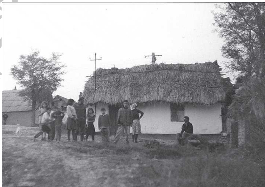
Bihari cigánytelep Hegyköztóteleken (Dimény Attila)