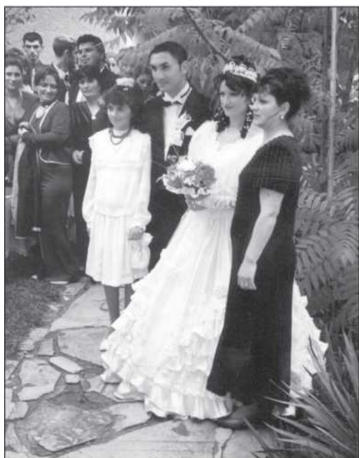
Cigány esküvő a kalotaszegi Meran