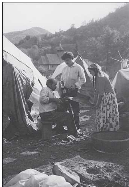
Férjét asszonya is segíti a borévi táborban