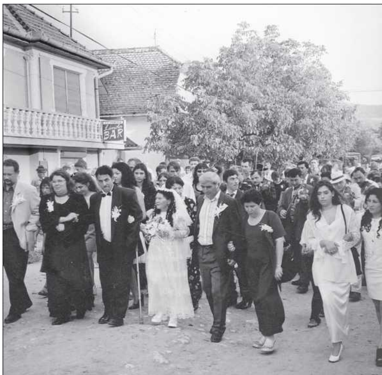
Cigány muzsikás esküvője Szászcsáváson