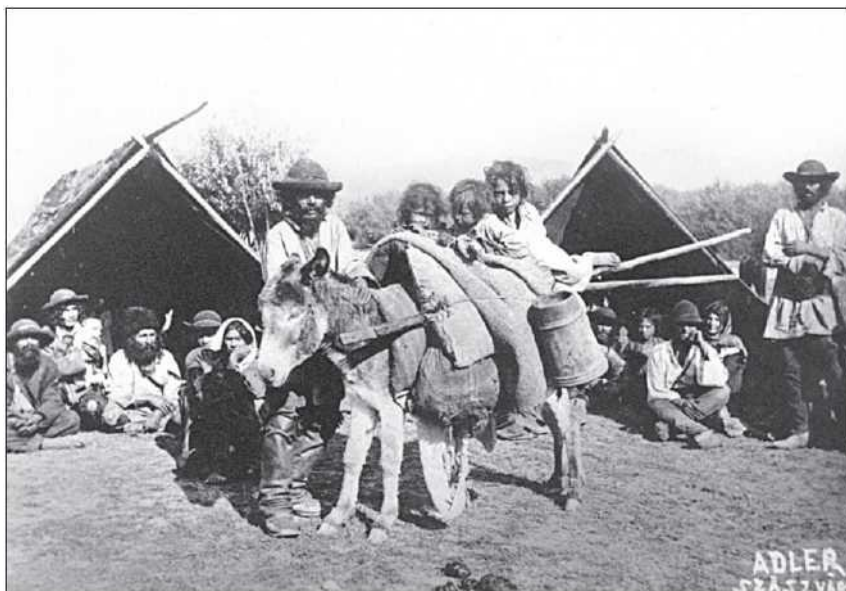
Sátorosok Dél-Erdélyben (Adler Artúr)