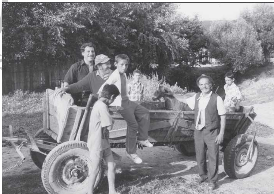
Magyar cigányok szekérrel Zabolán (Dimény Attila)