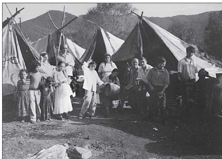
Galaci kelderási cigányok tábora Boréven