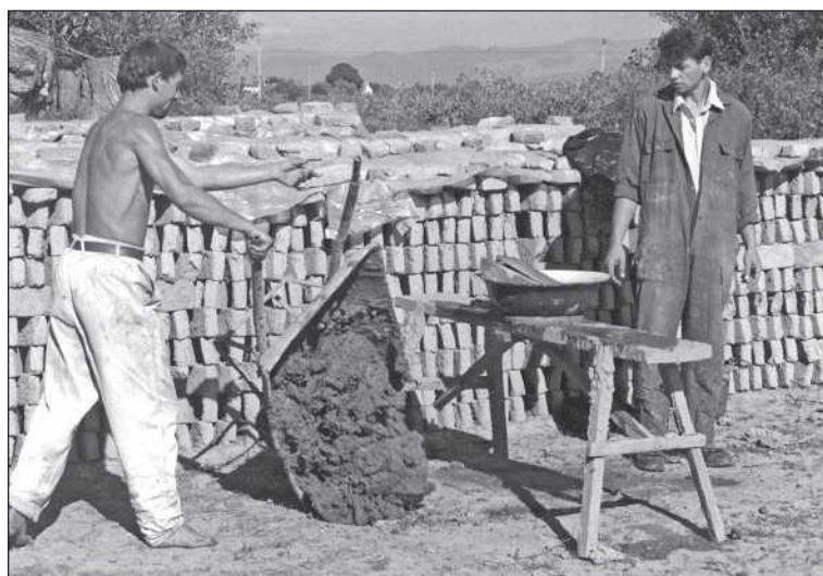
Téglavető cigányok Nagyborosnyón (Kozma Imre)