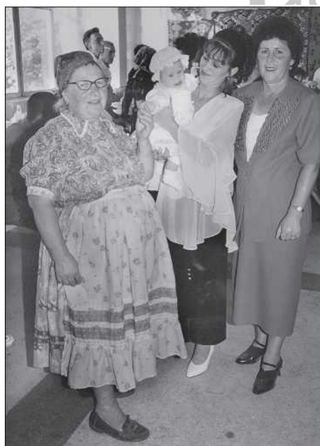
Magyar szakácsnő a mérai cigány lakodalomban