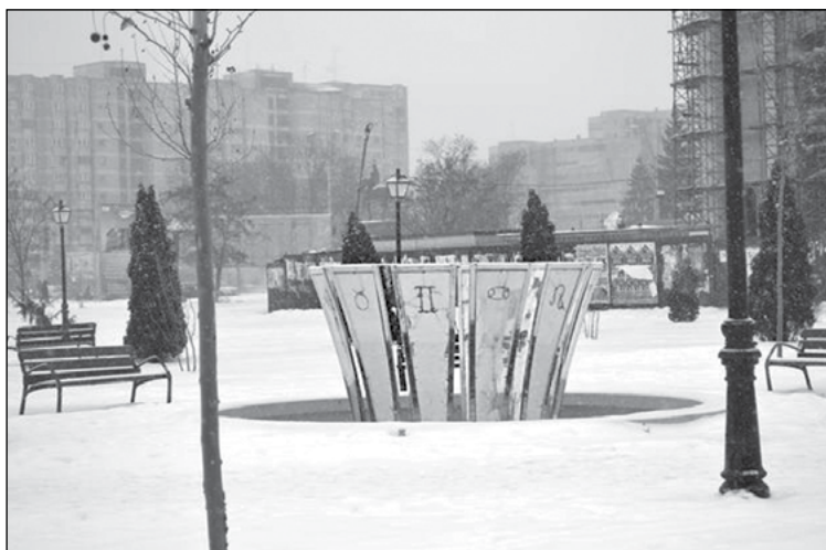
Csillagjegy ábrázolás Bákó központjában.

Geomancia. Keleti eredetű jóslás. Jelentése: geosz 'föld' + mantisz 'látnok'. Eredetileg a föld viselkedéséből levont következtetéseket jelentette. Jelentéssel rendelkezett a föld morajlása, ropogása, rázkódása, megrepedése. Ezek a jelek ritkán, szélsőséges helyzetben szólaltak meg. A káldeusok a viasz és az ólom öntését sorolták a geomanciahoz. Alapformája azonban az, amikor a földre, a homokba vagy papírlapra az ember – figyelmét kapcsolva és egy kérdésre összpontosítva – vonalakat vagy pontokat rajzol, 127 s ezek számát és elhelyezkedését értelmezi. A „pontozó művészet” a 15. századra alakult ki. Alapműve a Cremonai Gerardus által 1160 körül lefordított arab munka.