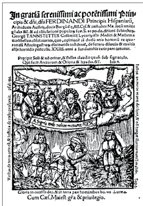
Isten felügyel teremtményeire. Georg Tannstetter horoszkóp illusztrációja, 1523

Az élettörténet általában az egyén megtett életútját, szelektív életpályáját, az életpálya epizódjait jeleníti meg. Van azonban egy másik, sajátos formája is, amely az életpálya egyén előtt álló szakaszát mondja el: a jövő történetét. Ebben az esetben az élettörténet referenciája, extenziója imaginárius jellegű. Megkonstruálásakor az egyén az életét a környezetében megfigyelt életpályákhoz igazítja, tapasztalati tőkéjét és szándékait, vágyait, adottságai és körülményei figyelembe vételével sematikus modellbe projektálja. Kiterjedését tekintve biografikus jövőképe vonatkozhat a közeljövőre, az élet egészére, esetleg az utóéletre.