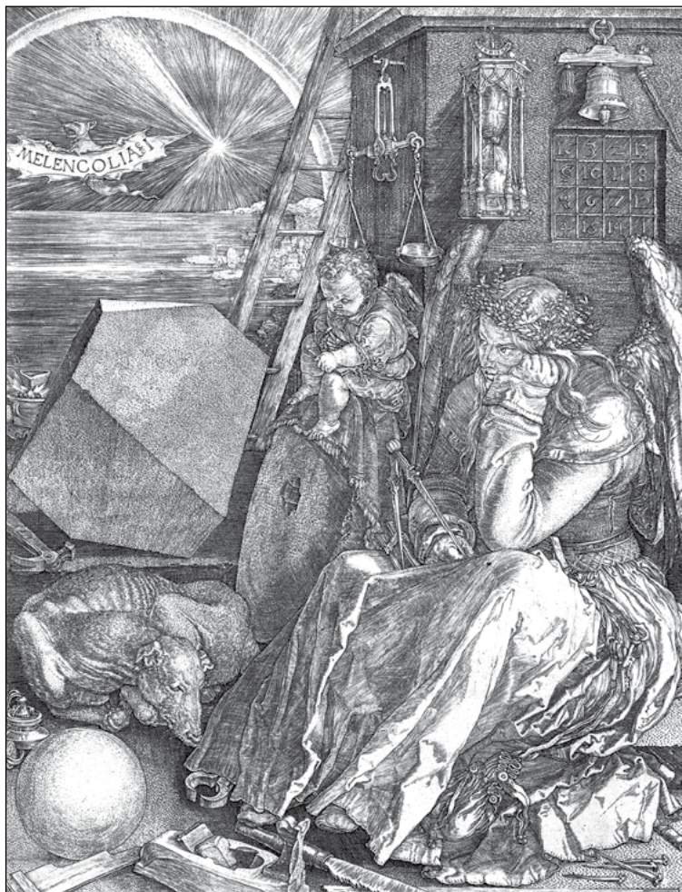
Albrecht Dürer: Melankólia I. 1514

személyiségtípusnak számító melankólia a középkor után, a reneszánsz, a barokk, a romantika korában a művészi alkotáshoz szükséges kiválasztottság (Arisztotelész), ihlet, lelkiállapot, érzékenység, receptivitás (Ficino) metaforájává változott át. 126