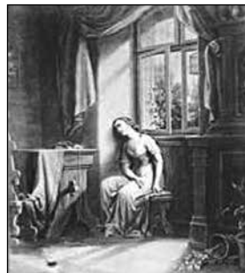
4. Orlai Petrics Soma: Szép Ilonka VII. A búsongás. (1858–1866 között)

2. Az Oltáregylet 1904. március 5-én, szombaton a városi Vigadó nagytermében gazdag műsorra hívta a város közönségét. Az est folyamán három élőkép került bemutatásra. A program második pontja volt a Feltámadás . Bornemisza Lujza, Czákó Ilona, Csipkés Erzsike, Tutsek Rózsika és Velits Ilonka úrhölgyek Jenny Henrik festő (?) művének jelenetét reprodukálták. A programban ötödik helyen a romantikus Liezen-Mayer Sándor Árpádházi Szent Erzsébet című festményét jelenítette meg Lovassy Viola, Polonyi Sándorné, Széplaky Ödönné úrhölgy és Lőrinczy Ákos. A művész több változatban festette meg a könyörületes szent asszonyt. Utólag nem tudni, a belső térben vagy pedig a téli tájban megfestett jelenet került bemutatásra a tordai színház pódiumán. (5–6. képek)