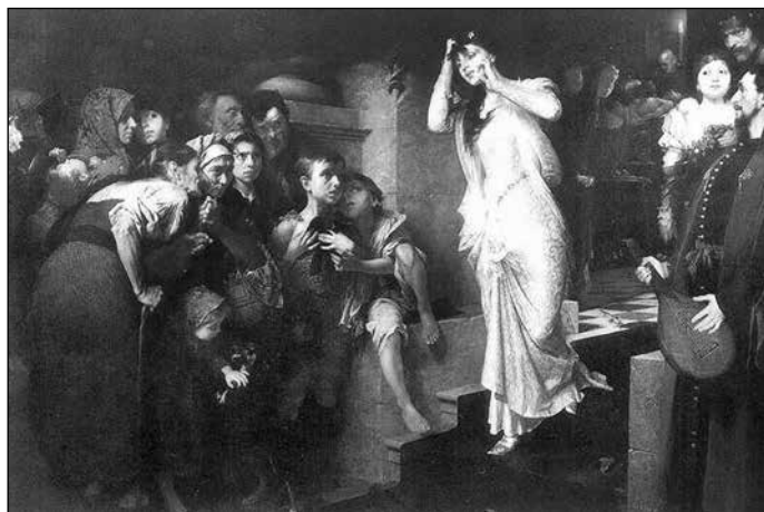
13. Gyárfás Jenő: Tetemre hívás. (1879)