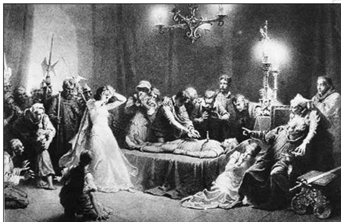
14. Zichy Mihály: Tetemre hívás. (1894)