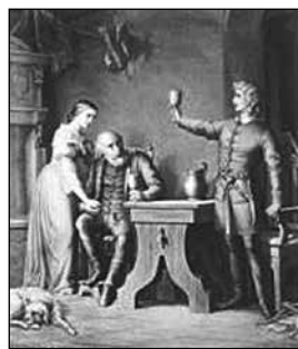
2. Orlai Petrics Soma: Szép Ilonka IV. A felköszöntés. (1858–1866 között)