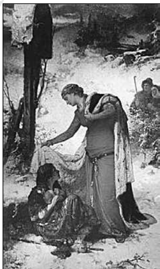
5. Liezen-Mayer Sándor: Árpádházi Szent Erzsébet. (é. n.)