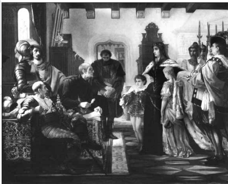
8. Madarász Viktor: Zrínyi Ilona a vizsgálóbíró előtt. (1864)

Az élőkép Madarász Viktor Zrínyi Ilona a vizsgálóbíró előtt című (1864) festményének egyik epizódját jelenítette meg. Az anya testtartása és arca egyszerre fejezi ki a gyermekek védelmére való végső elszántságot, valamint a férj emléke és a haza, a szabadság ügye melletti bátor kiállást. Az élőkép bemutatásával a Nőegylet mind a női bátorság, mind Rákóczi fejedelem emléke előtt hódolni kívánt. (8. kép)