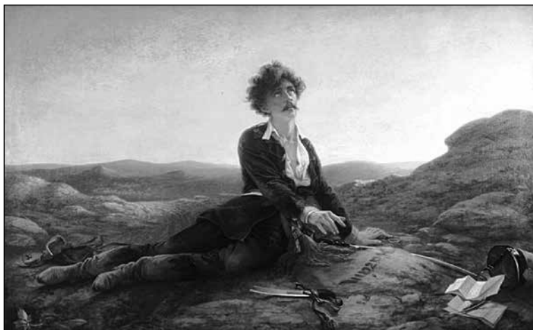
9. Madarász Viktor: Hazám (Petőfi halála). (1875)

11. 1909-ben a március 15-i műsor élőképe Petőfi halála volt. A tudósítás nem vállalkozik a kép szerkezetének bemutatására, csupán annyit jegyez meg, hogy a produkciót a sikeres teljesítmény miatt a közönség megújrázta. Ennek ellenére a képet nem nehéz