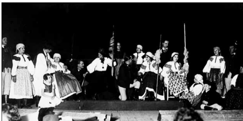
15. A magyar dal története: fonóban. (Élőkép, Torda, 1932)

A vizsgált korból nem áll rendelkezésünkre egyetlen felvétel sem tordai élőkép-be-mutatóról. A Szociális misszió nevű katolikus szövetség 1932-ben rendezte meg a Képek a magyar dal történetéből című élőkép sorozatot. Az ekkor készült fénykép a falusi fonó jelenetét, a parasztdal egyik kontextusát örökítette meg. A 18 alakos kompozíción három generáció van jelen, nők és férfiak. Az öltözetdarabok közül azonosítható a hímzett női ing, a férfi harisnya és posztókabát, továbbá a stilizált kötény, mellény, szoknya és kendő. Az asszonyok kezében orsó és guzsaly. A három központi asszony a fonás gesztusait reprodukálja, pörgeti az orsót, seríti a fonalat. Két férfi a serény asszonyok mellett szolgálatkészen vár arra, hogy az elejtett orsót feladhassa. Két fiatal enyelegve pillant egymás szemébe. Kétoldalt egy-egy pár táncra készen várakozik a dal felcsendülésére.