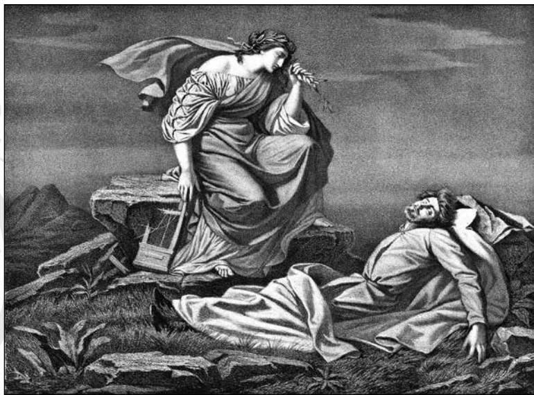
10. Lotz Károly: Petőfi halála . (Marastoni József litográfiája, 1899)

magunk elé képzelünk, hisz Petőfi „a nemzet összes elveszített vértanúját megtestesítő, alakja a szabadságharc utáni nemzetgyász egyik legfőbb szimbólumává válik”, s halálának romantikusan megjelenített képe az 1850–60-as évektől közismert. A Hazám szót a vérével a földre író költő romantikus ábrázolása Madarász Viktortól származik, 1875-ből. (9. kép) A jelenet emléklapokra is rákerült. Lotz Károly 1899-ben klasszicista stílusban örökítette meg a pillanatot. A csatatéren angyal vigyáz a hős költőre. (10. kép)