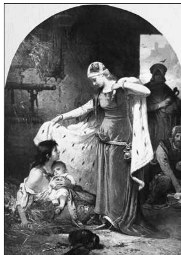
6. Liezen-Mayer Sándor: Árpádházi Szent Erzsébet. (1882)