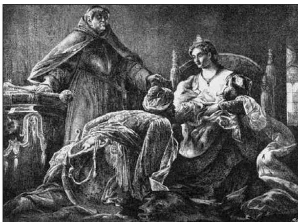
7. Madarász Viktor: Izabella királyné Szulejmán szultán követét fogadja. (azonosítatlan év)

A nyolcadik programpontot képező élőkép szereplői Erdélyi Elemérné úrnő, valamint Novák Miklós és Osztián Ernő. Szintén festmény képezte a jelenet kiindulópontját, a szerző ezúttal Madarász Viktor. A képen Izabella királynő látható, amint Martinuzzi jelenletében a kis János Zsigmondot bemutatja a török követnek. (7. kép) A festmény a millenniumi kiállításon vált híressé. ( Aranyosvidék XIV. 9. 1904. febr. 27. 5.) Az első két élőkép vallásos érzelmeket kívánt kiváltani. Liezen-Mayer Sándor a könyörületes, segítőkész, mértéktartó, az árvákat és a szegényeket felkaroló szent példázatát idézte meg. Mi ösztönözte az Oltáregylet tagjait Madarász Viktor festménye életre keltésére? Habár az unitáriussá lett János Zsigmond 1568-ban Tordán jelen volt azon a diétán, amelyen Dávid Ferenc a vallásszabadságot – a világon először – kimondta, Erdély első – és unitárius vallású – fejedelmére, valamint az eseményre való illetően emlékezés aligha lehetett az Oltáregylet szándéka. Inkább az az esemény képezte a bemutató üzenetét, amelynek a képen látható jelenet részét képezte. Hiszen a török követ látogatása, a csecsemő János Zsigmond I. Szulejmán szultán elé kérése egybeesett Buda elestével, csellel való bevételével, azaz a másfélszáz éve török uralom kezdetével.