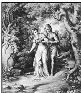
1. Orlai Petrics Soma: Szép Ilonka II. A meglepetés. (1858–1866 között)

Csupán feltételezni tudjuk, hogy a megjelenített „képletek” Orlai Petrics Soma képeiből ihletődtek. Ha igen, az élőkép rendezője számára a képek kínálták a gesztusok és a díszlet retorikáját. 309 (1–4. képek)