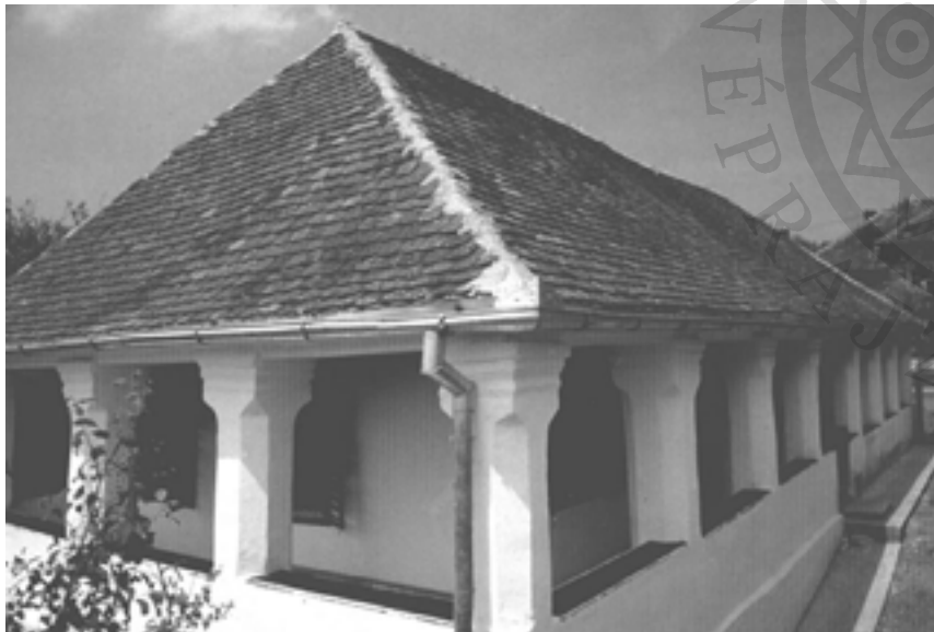
A Bogdándi Magyar Múzeum (Szatmár megye)