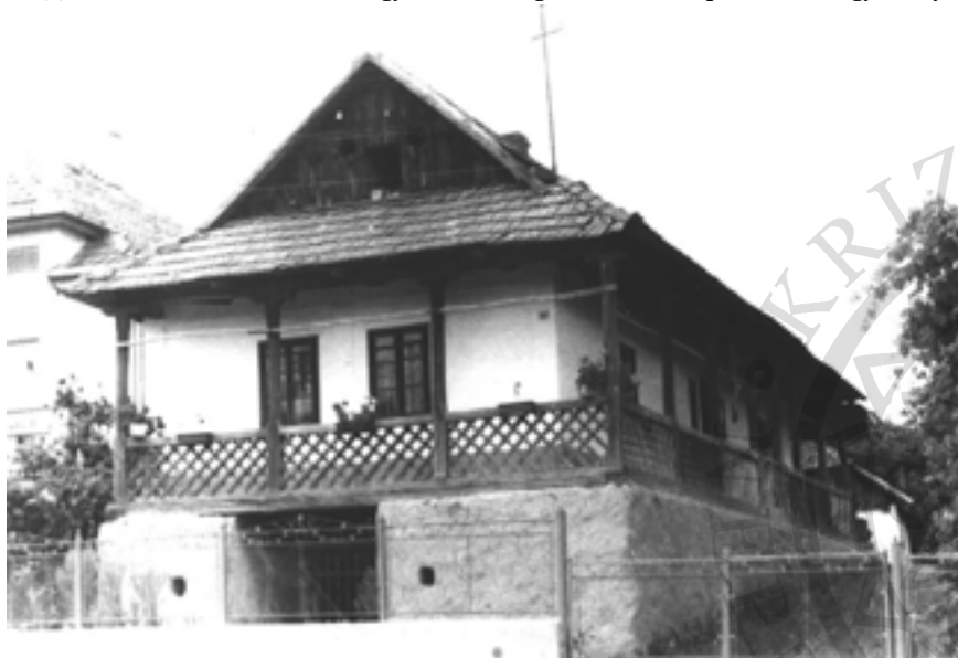
Magyar tájház Kőszegremetén (Szatmár megye)

1993-ban a Szatmárnémeti–Nagyvárad országút menti Mezőpetriben (Nagykároly-