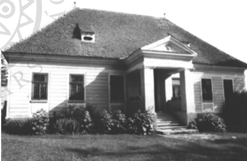
Alsócsernátoni Néprajzi Múzeum (Kovácszna megye) – Damokos kúria