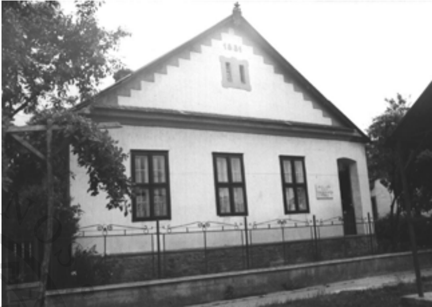
A mezőpetri sváb tájház (Szatmár megye)

Végezetül összesítésként elmondhatjuk, hogy a Partium területén ismereteink szerint 16 néprajzi vagy a néprajz körébe is sorolható gyűjtemény van, melyből 7 közösségi, 9 pedig magántulajdonban van, 5 tájház, melyből 2 magánkezdeményezésre alakul ill. alakult, 1 közösségi tulajdonban van, kettőt pedig az állam karolt fel és működtet.