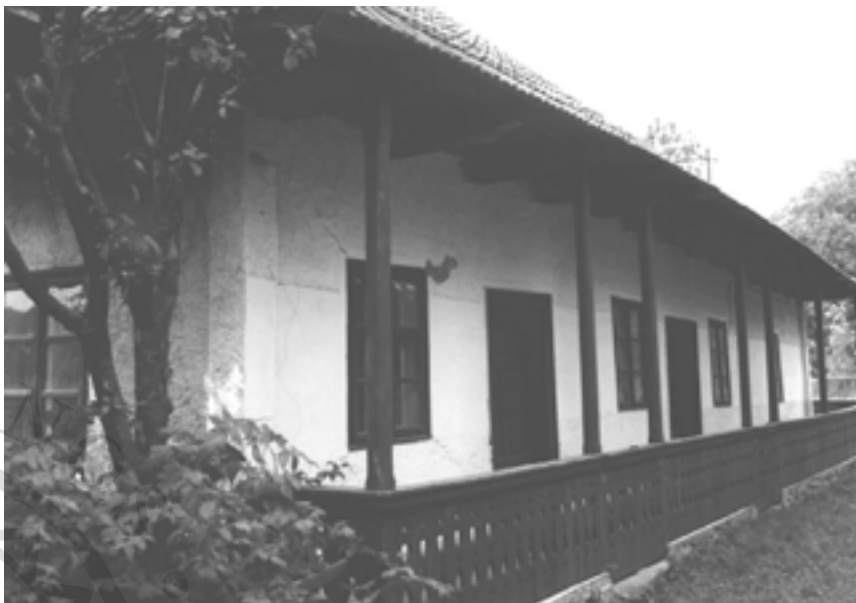
Tájház Zabolán (Kovásszna megye)

annak a veszélye, hogy az alapítók halála után az örökösök eladják vagy elkótyavetyélik a gyűjteményeket (pl. Várfalva).