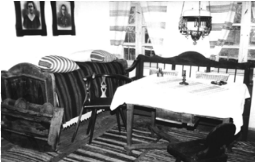
Tájház Zabolán (Kovácszna megye)

Az 1974-ben megnyitott első kiállítás egy század elején épült földműves három szobás házában a zabolai kerámiaközpont termékeit, a falu festett hozományos ládáit,