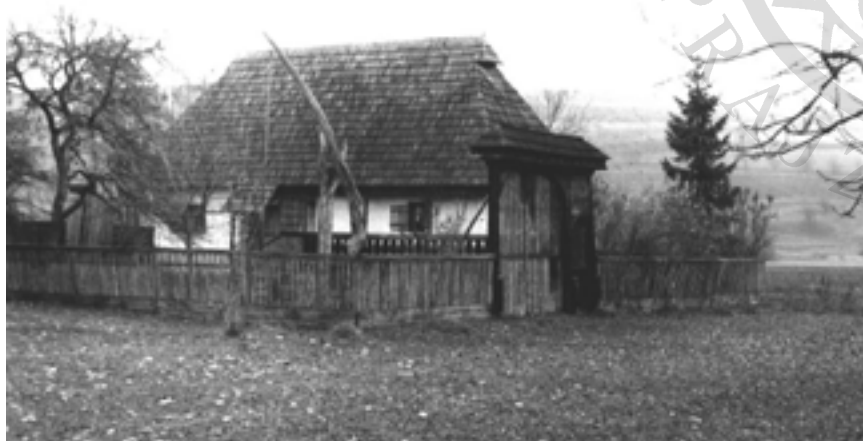
A székelyszentléleki tájház (Harghita megye)